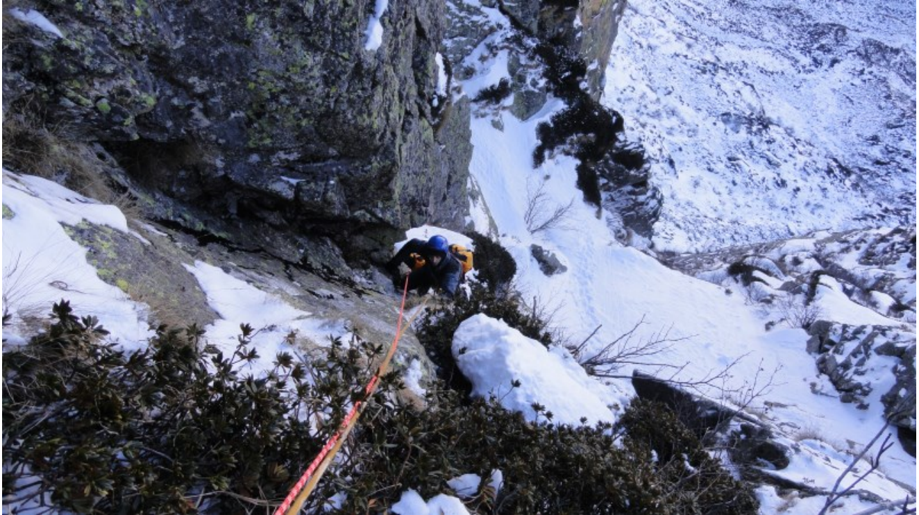
Sesta lunghezza, M5