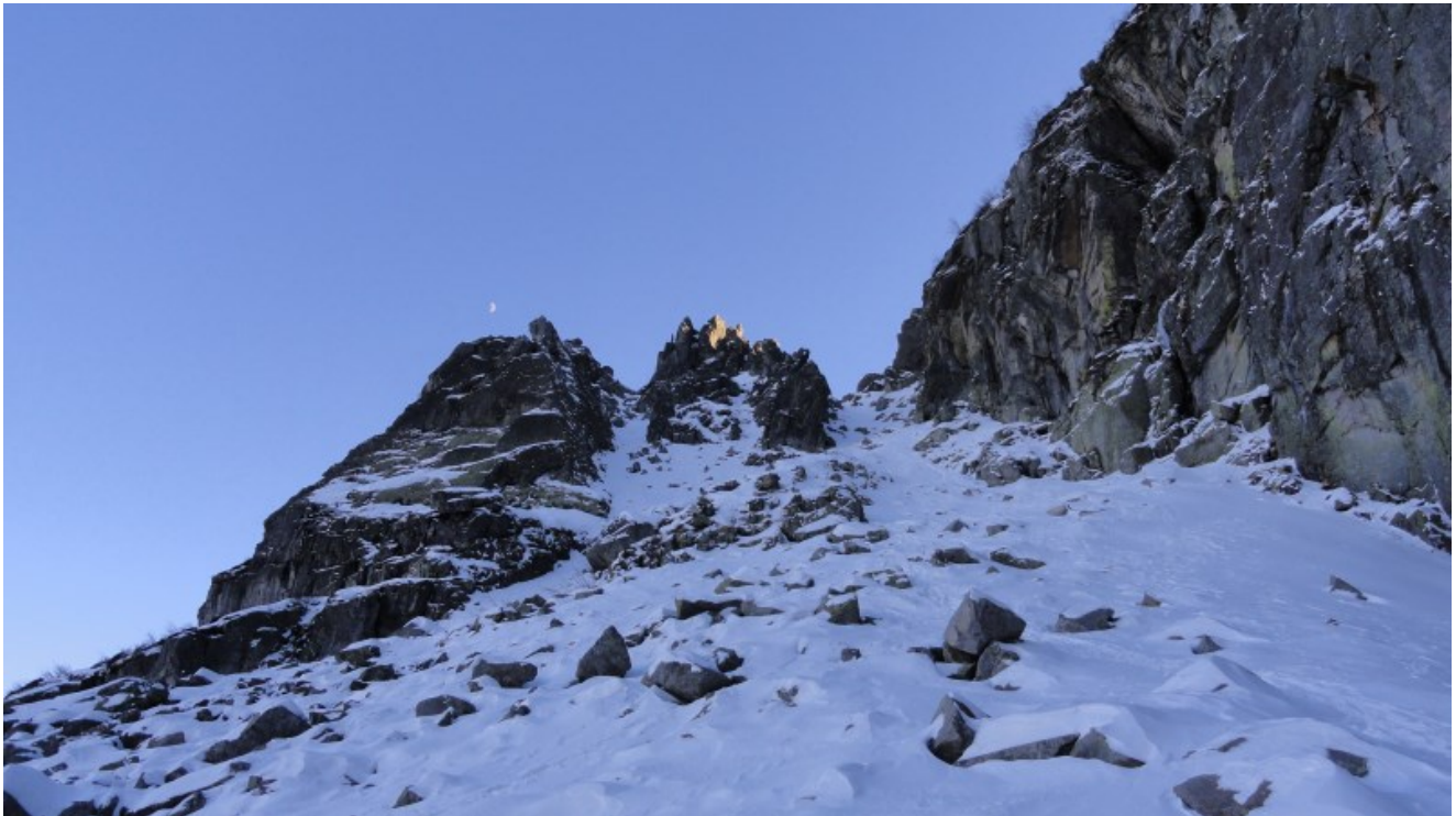
Il canale di discesa, a dx