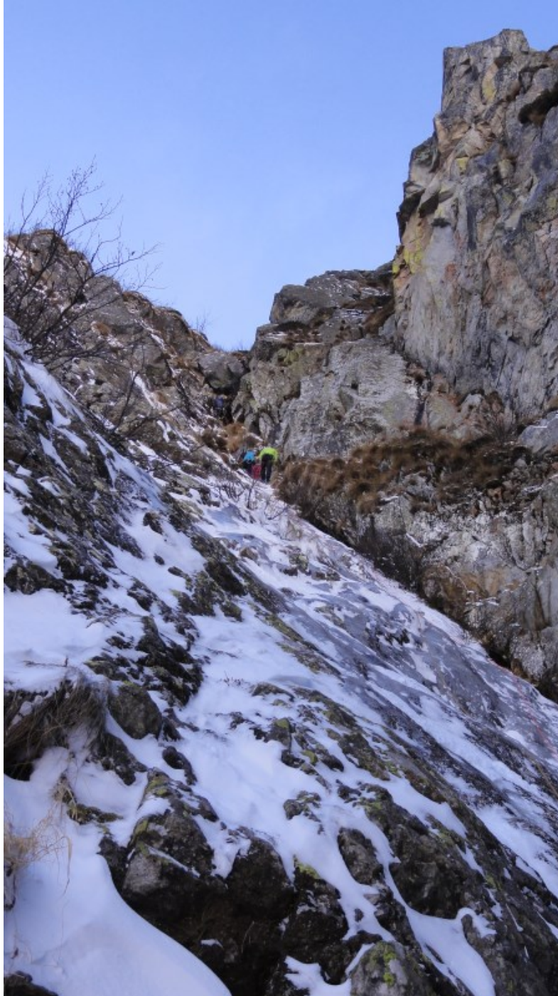
Terza e quarta lunghezza