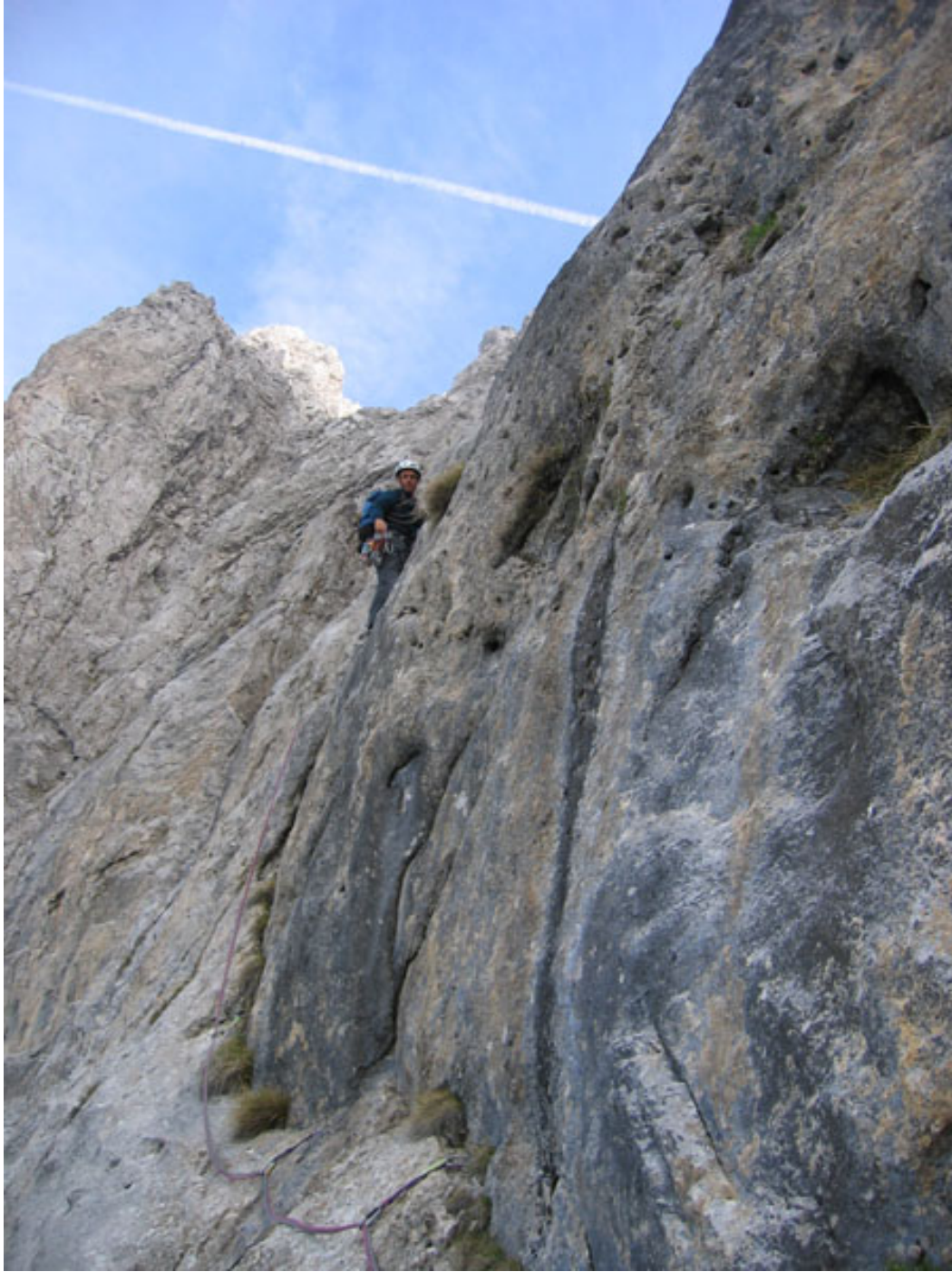
Mario sul terzo tiro