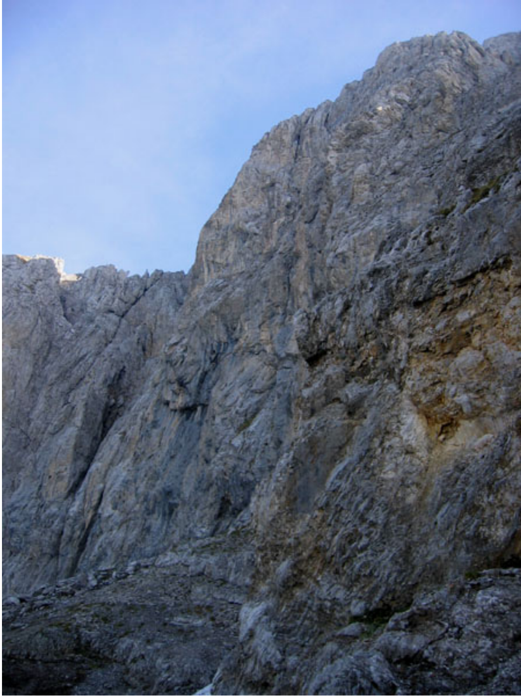
La parete vista dal canale