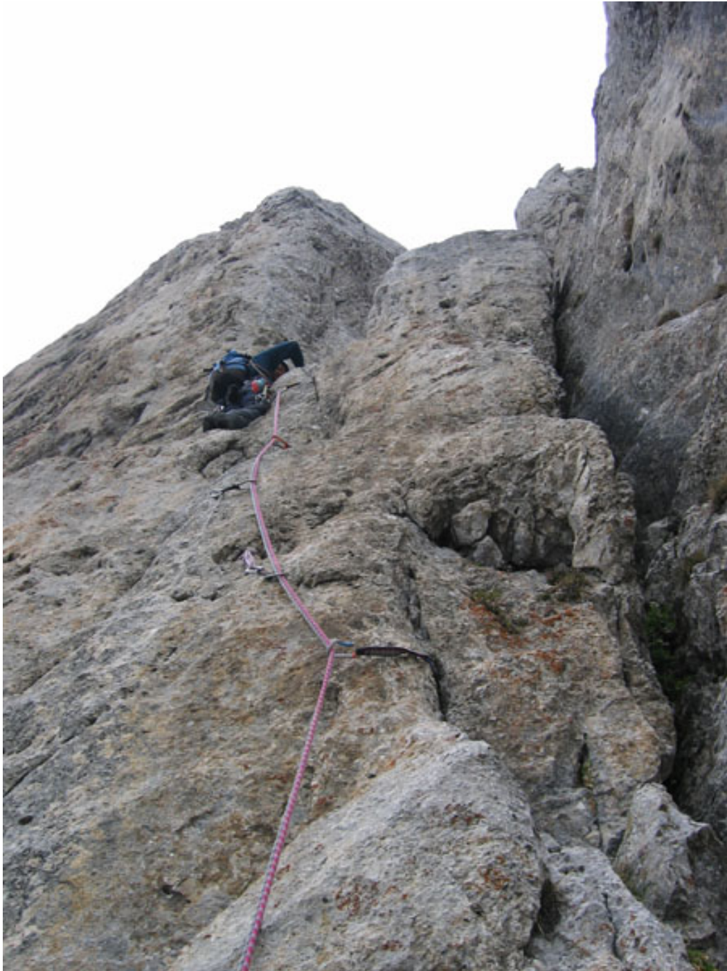
Mario sul decimo tiro