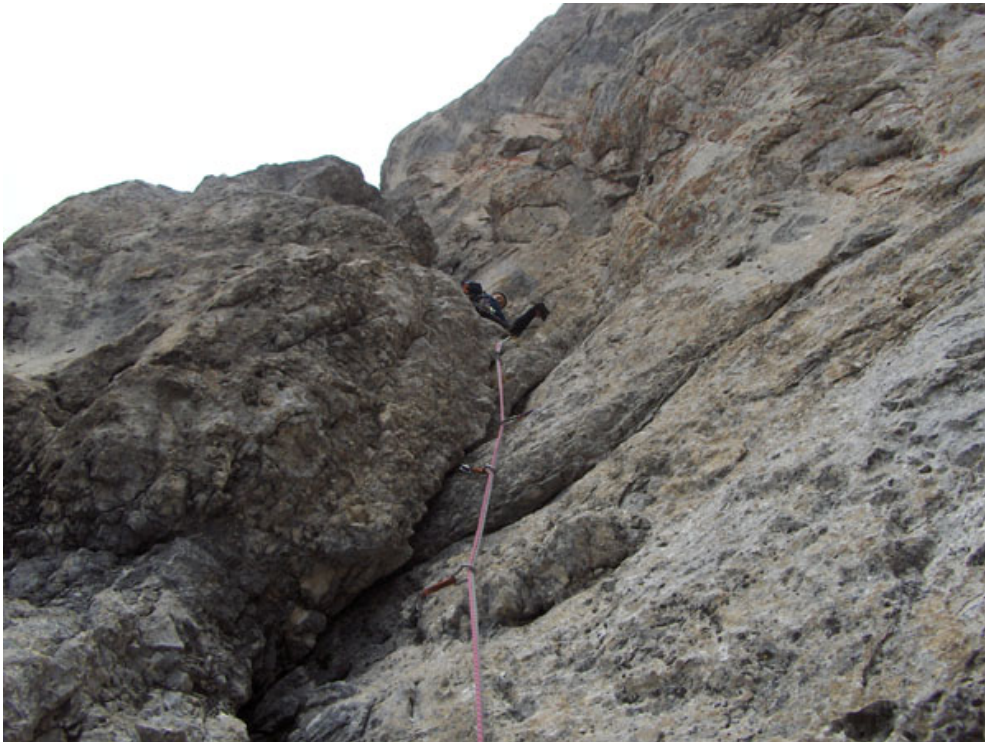
Walter sul nono tiro