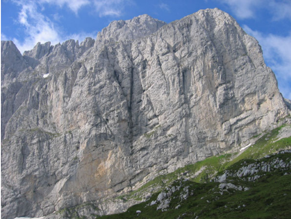
La parete nord della Presolana