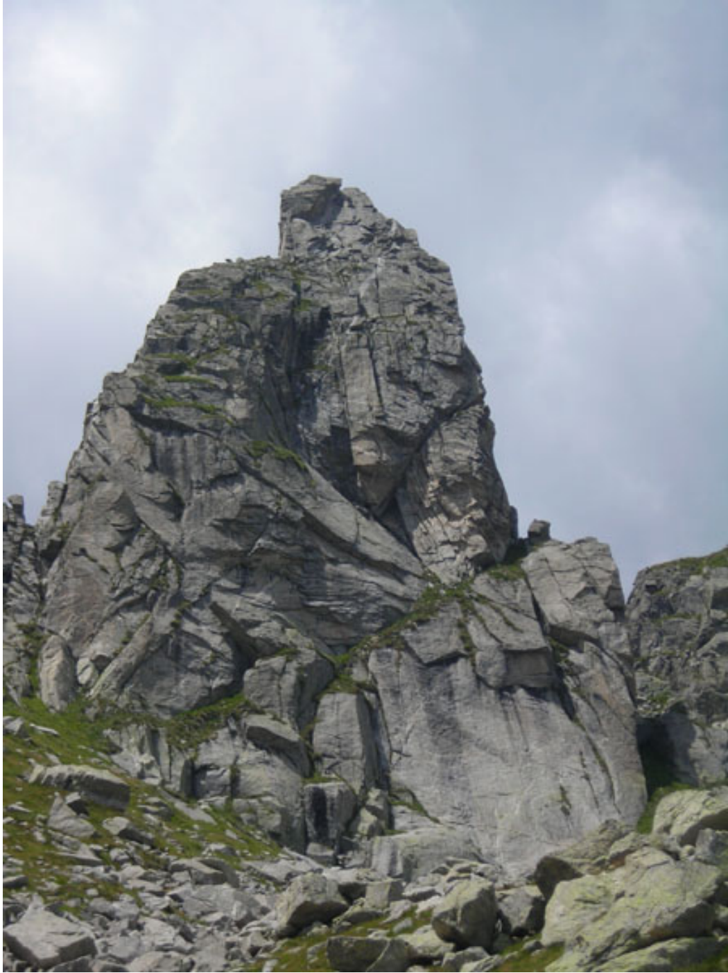
La Punta Milano