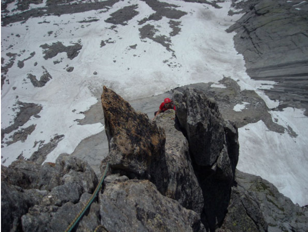
Davide in uscita dalla quinta lunghezza