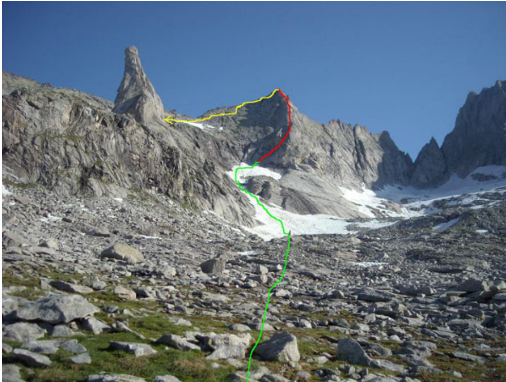
Verde: avvicinamento, rosso: sviluppo della via, giallo: discesa