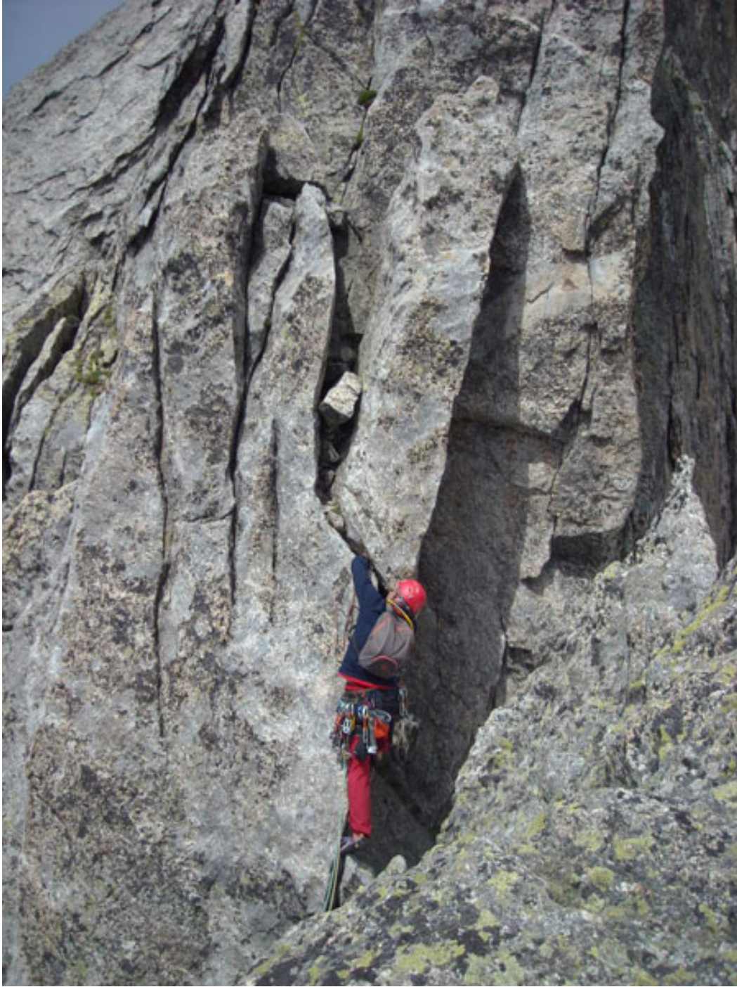
Davide impegnato sulla nona lunghezza