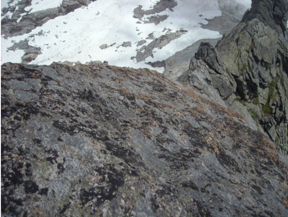
La placca vista dalla sommità