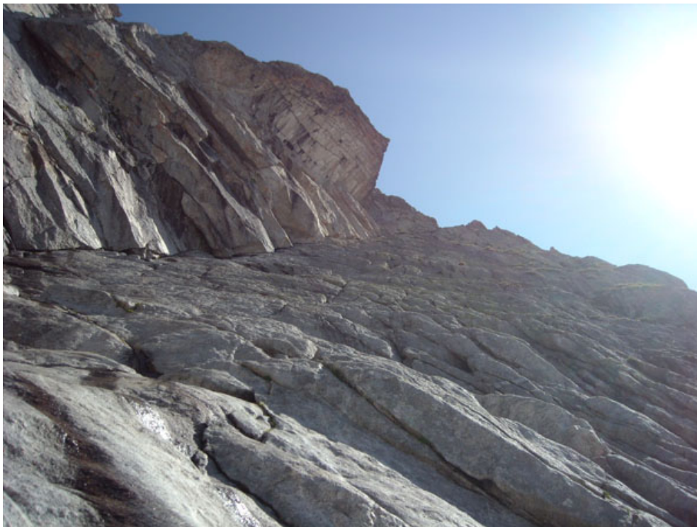
La rampa rocciosa dove attacca la via