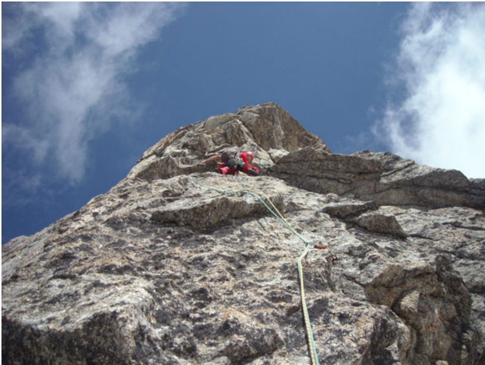
Davide sulla placca della quarta lunghezza