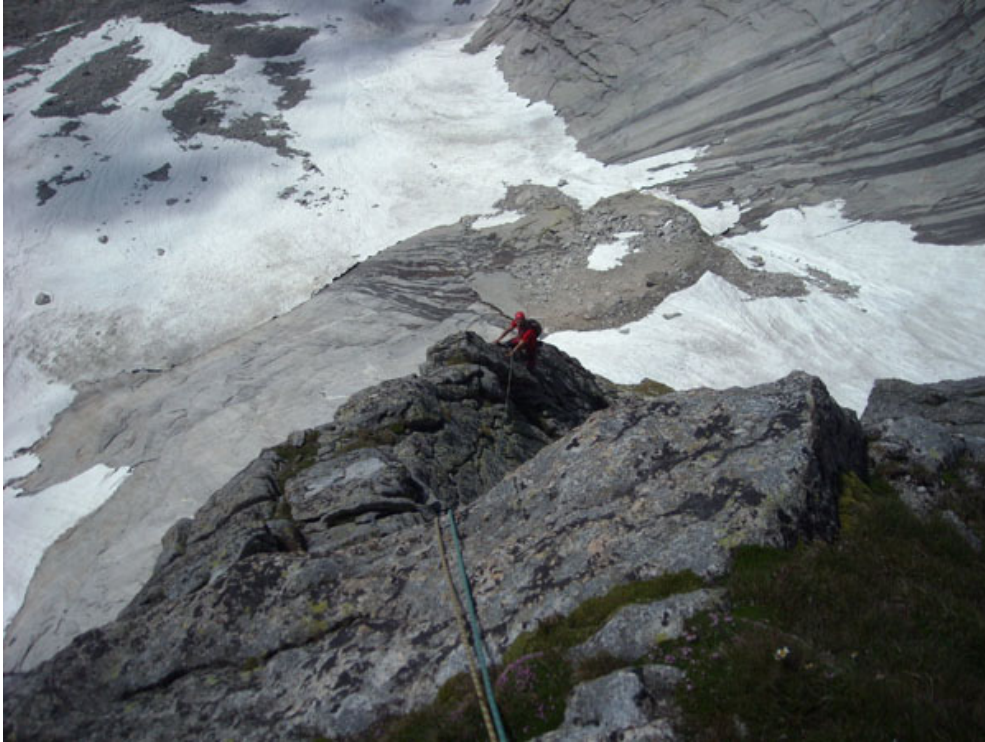
Davide sulla terza lunghezza