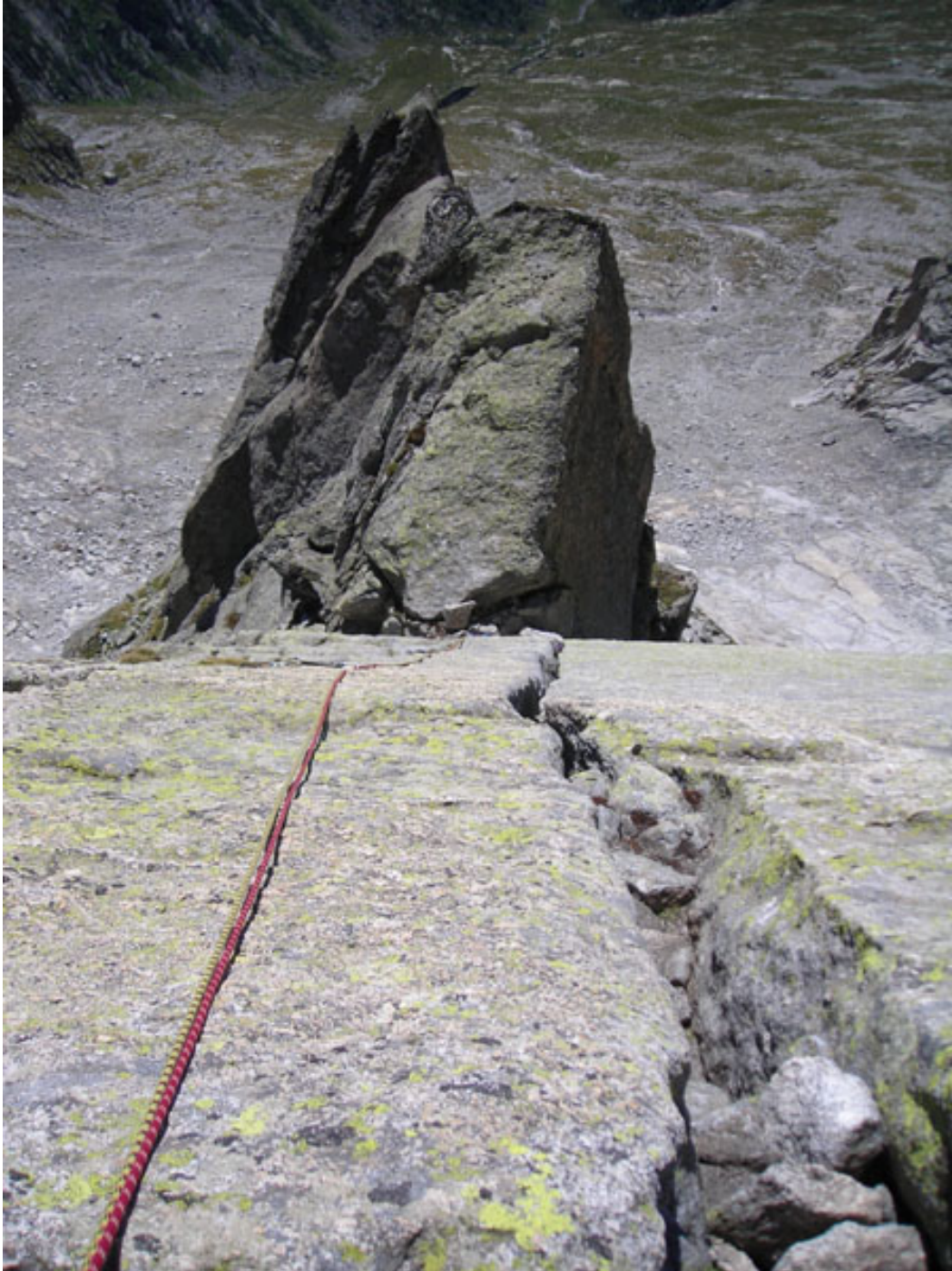
Sulla nona lunghezza