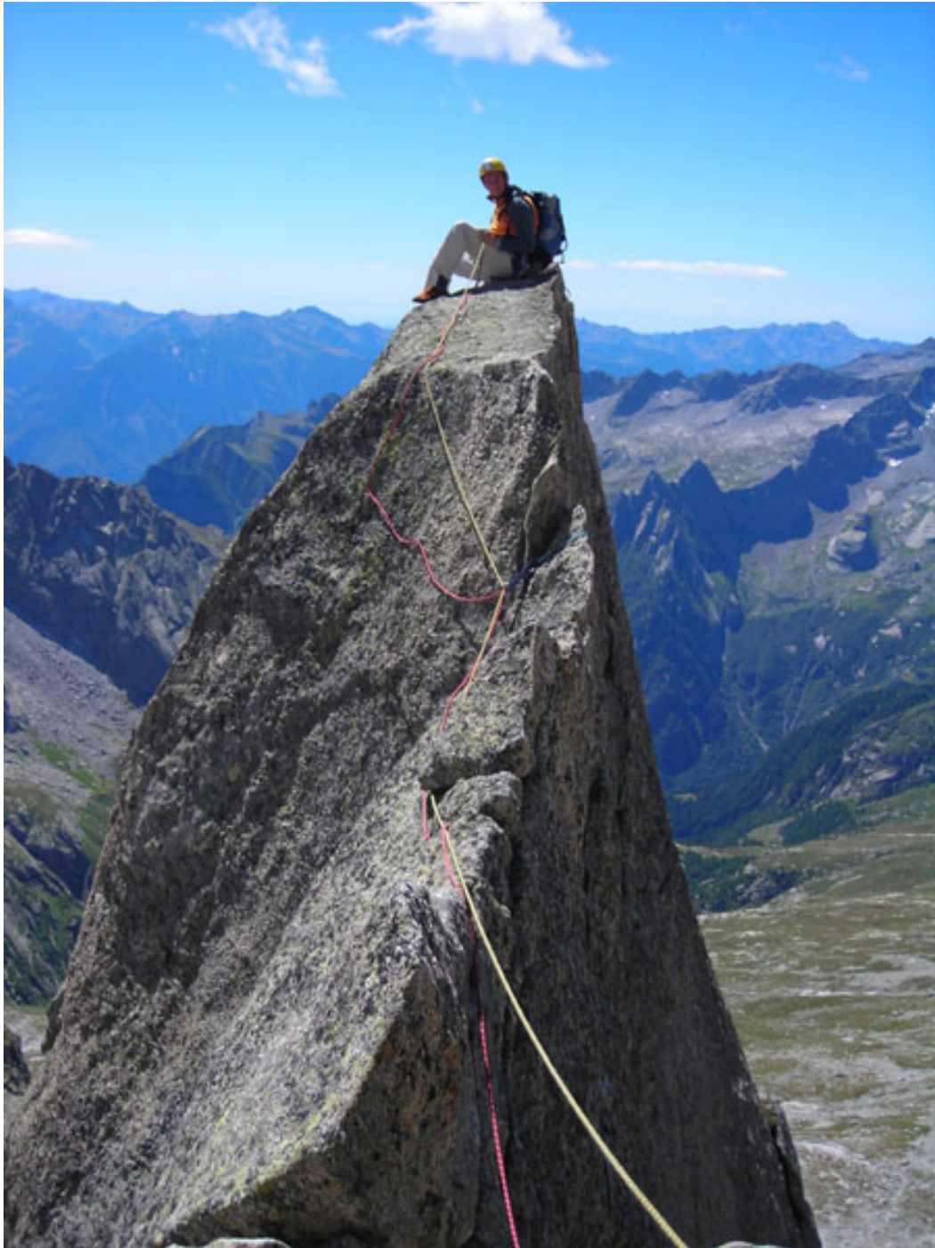
Sulla cima della seconda cuspide