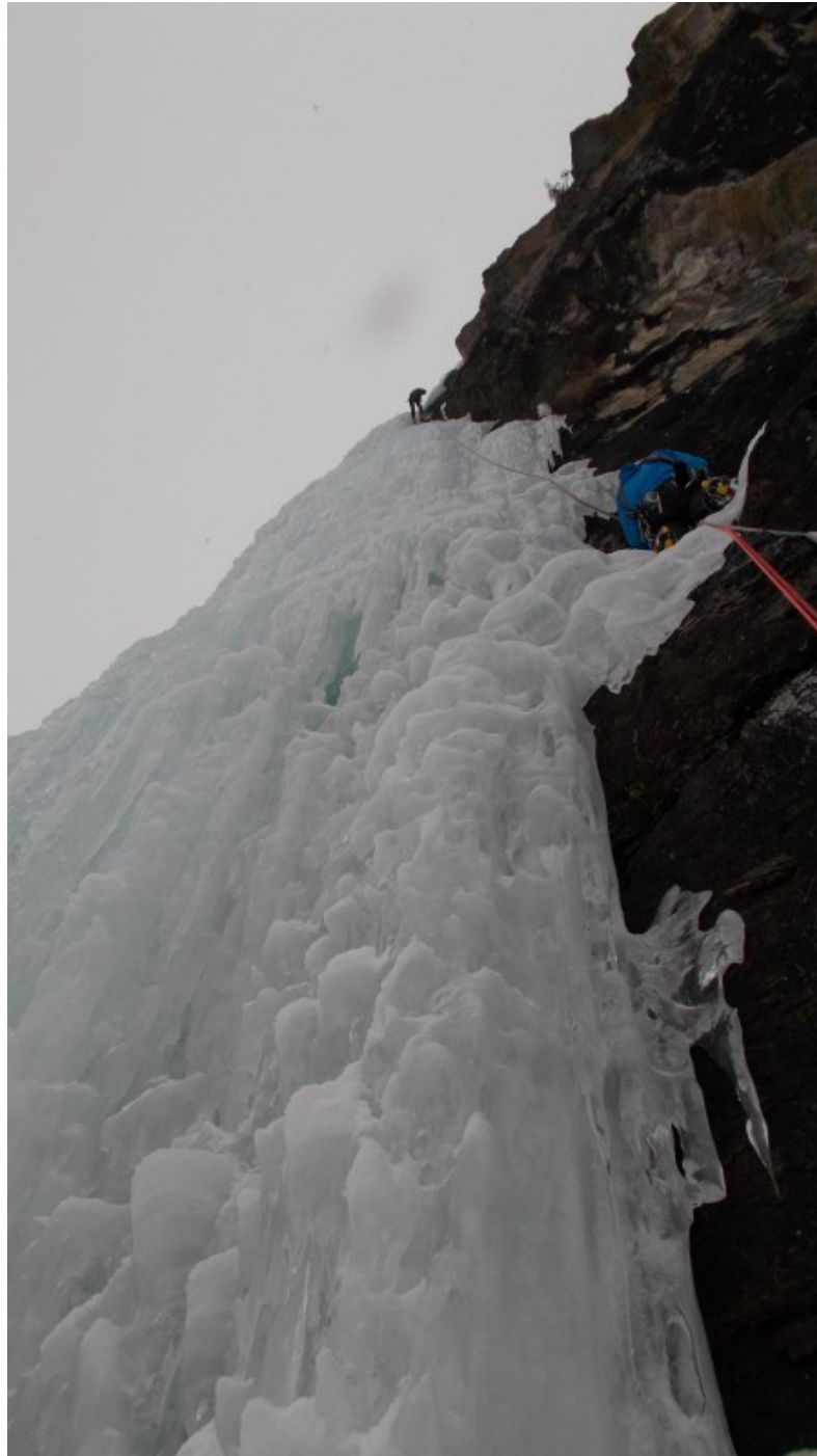
In doppia. Ben visibile la sosta 1