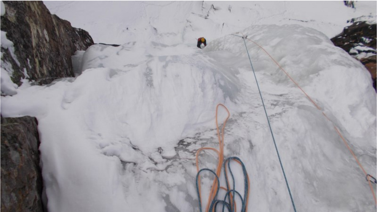
Uscita dalla terza lunghezza