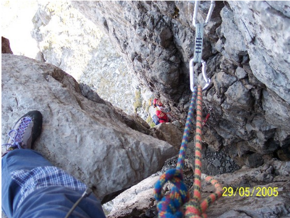
Sulla cima del pilastro...