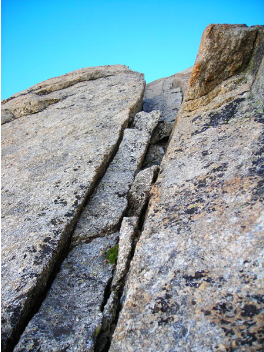
All'attacco del quinto tiro