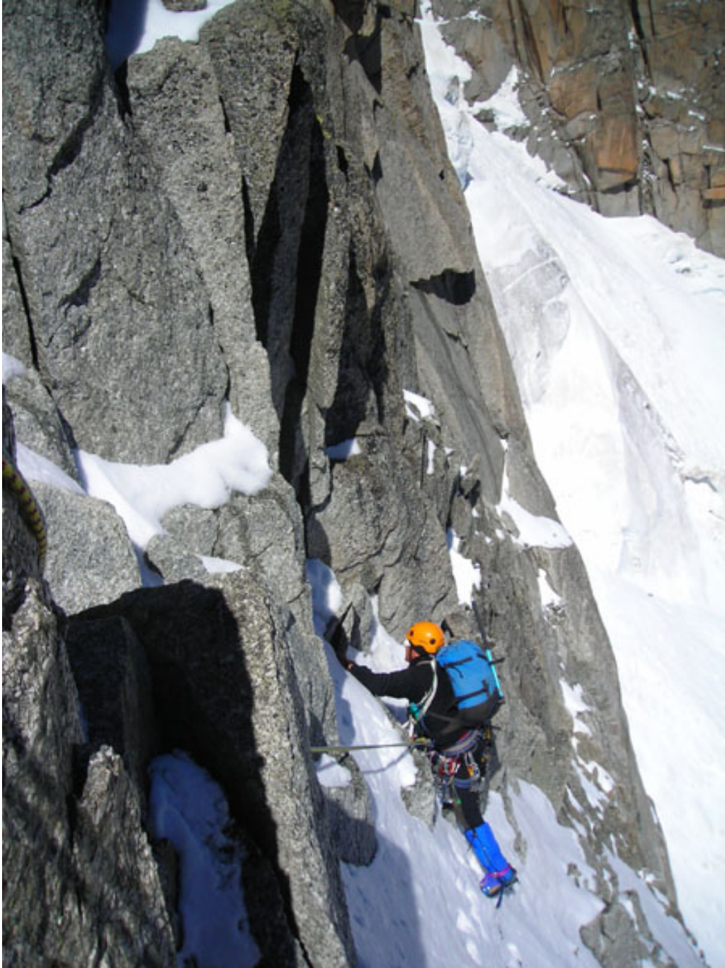
Mario sul delicato traverso di avvicinamento