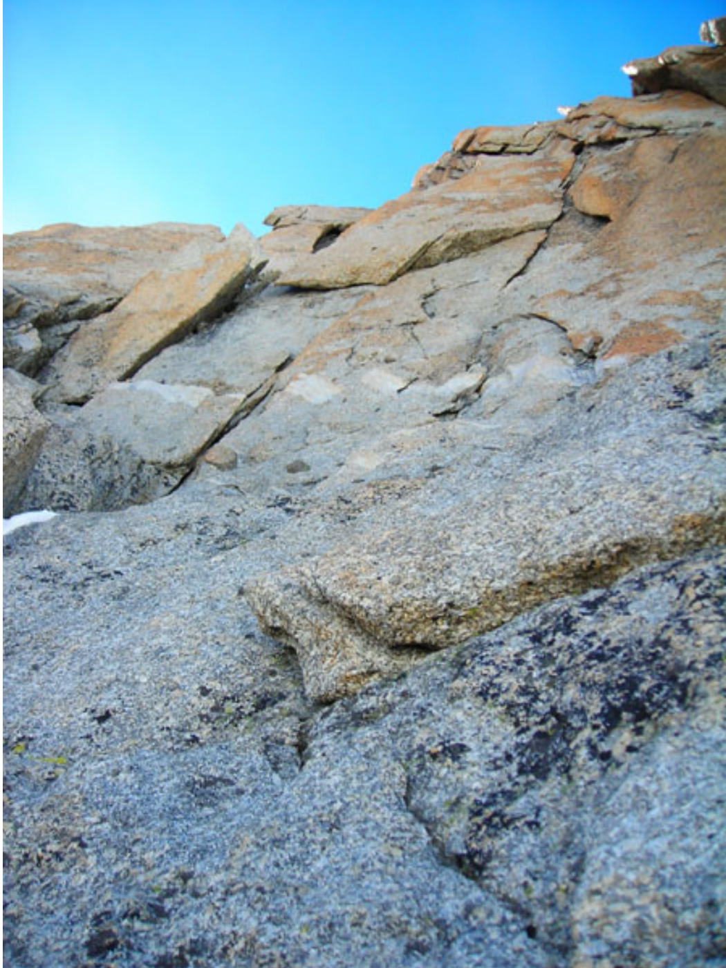
All'attacco del terzo tiro