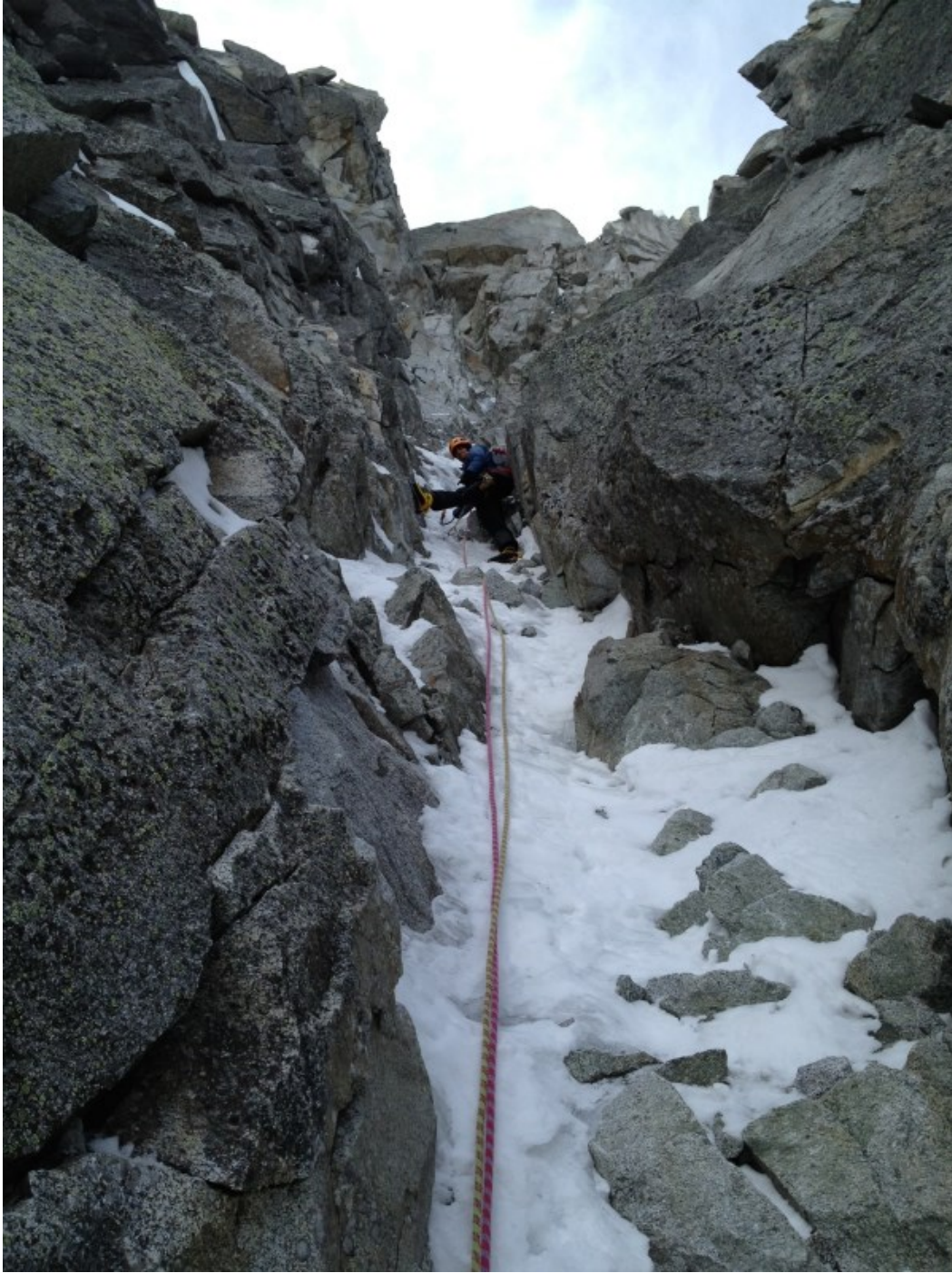
Tommy in relax sul quarto tiro