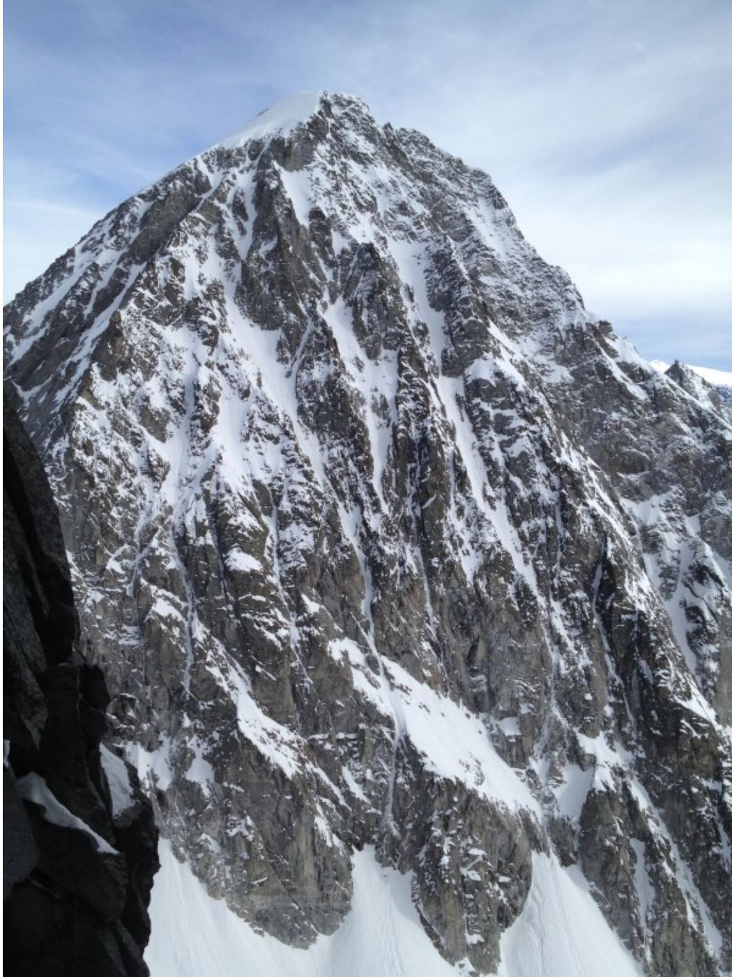
Vista costante per tutta la salita sul Hochgall-Collalto