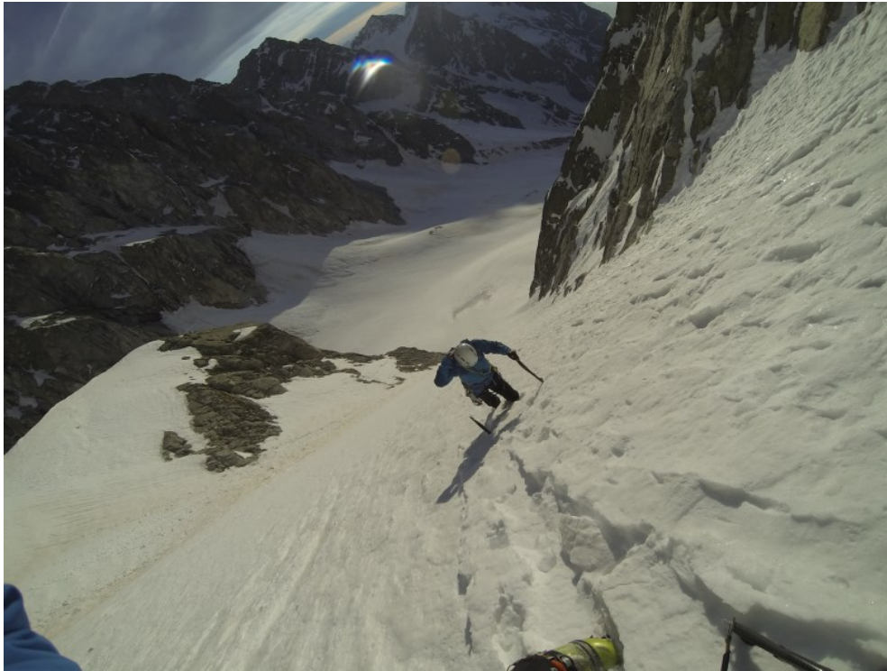
Conoide originale di salita