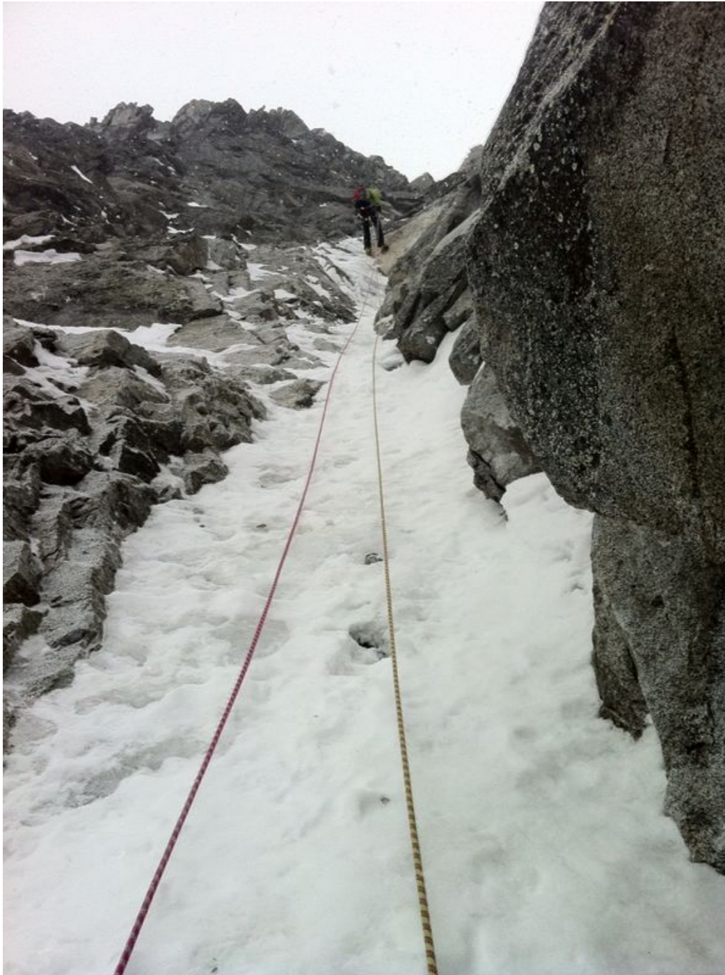
Discesa in doppia, per lo stesso itinerario di salita, sotto un pò di neve