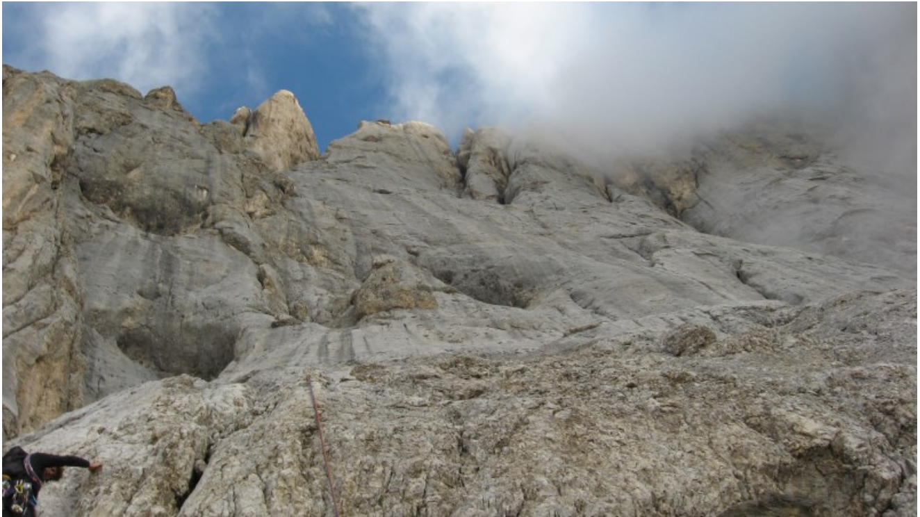
La parte superiore dalla grande cengia