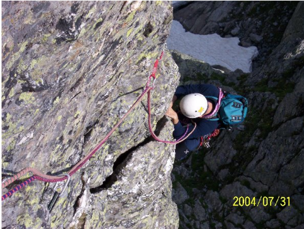
Sulle belle lame dei tiri centrali