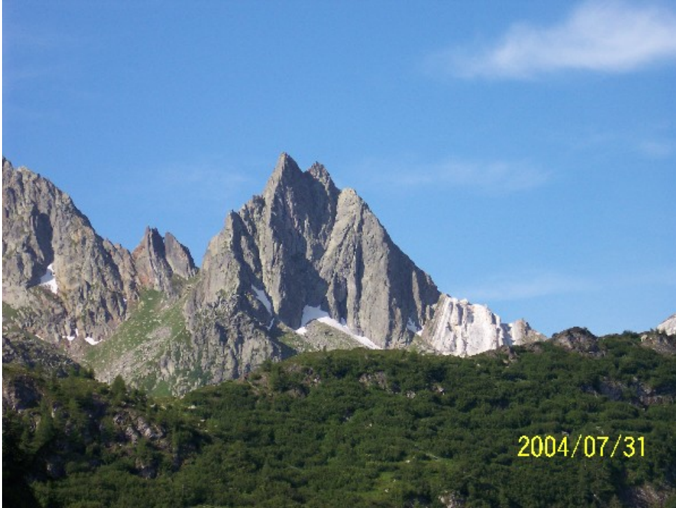
Il Piz Prevat durante l'avvicinamento. La via sale lo spigolo centrale. Si notino i singolari affioramenti di calcare sulla destra.