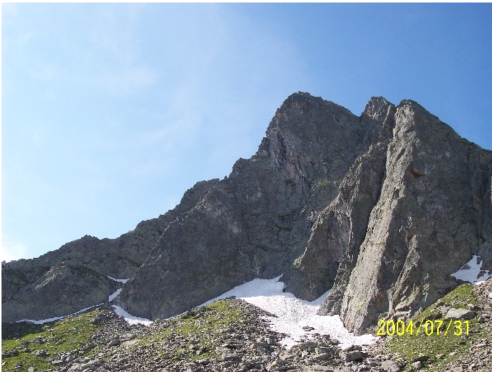
Visto di fianco lo spigolo appare come è in realtà, cioè molto più appoggiato.