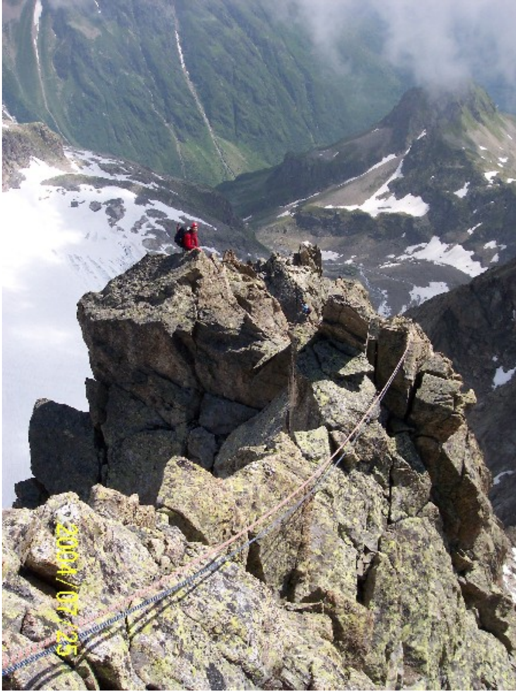
Ancora torrioni di cresta