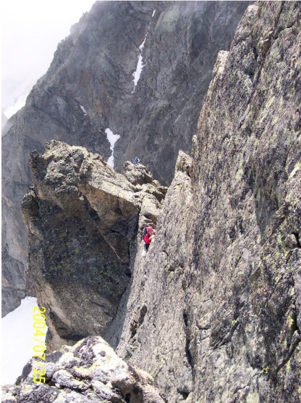
L'esposto tratto della sesta lunghezza