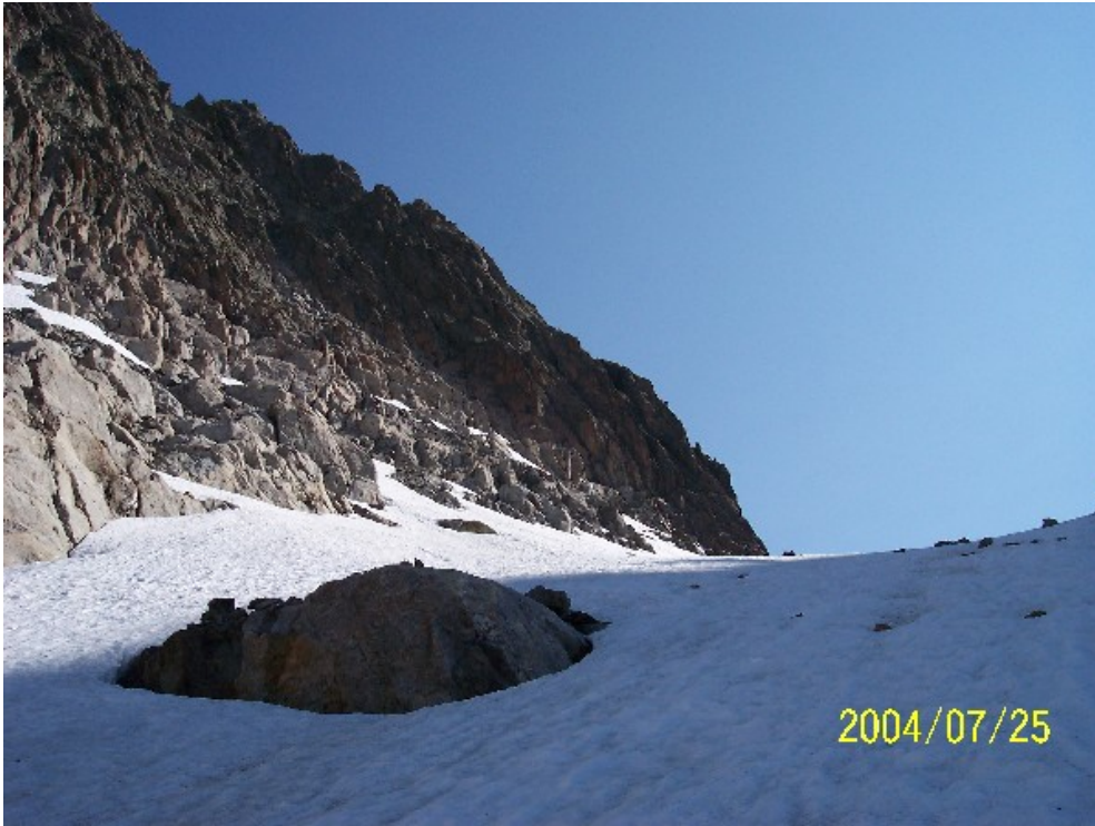
Il profilo della cresta dal nevaio di accesso