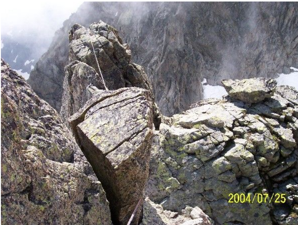
Torriani di cresta