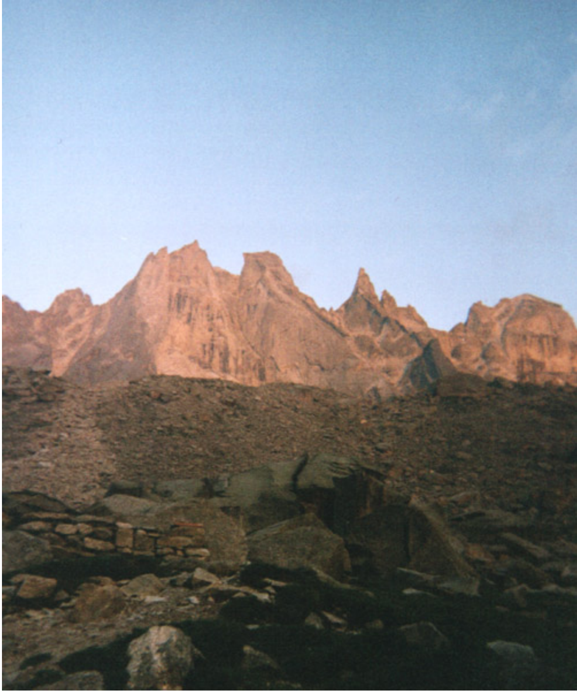
Al centro la Pioda di Sciora