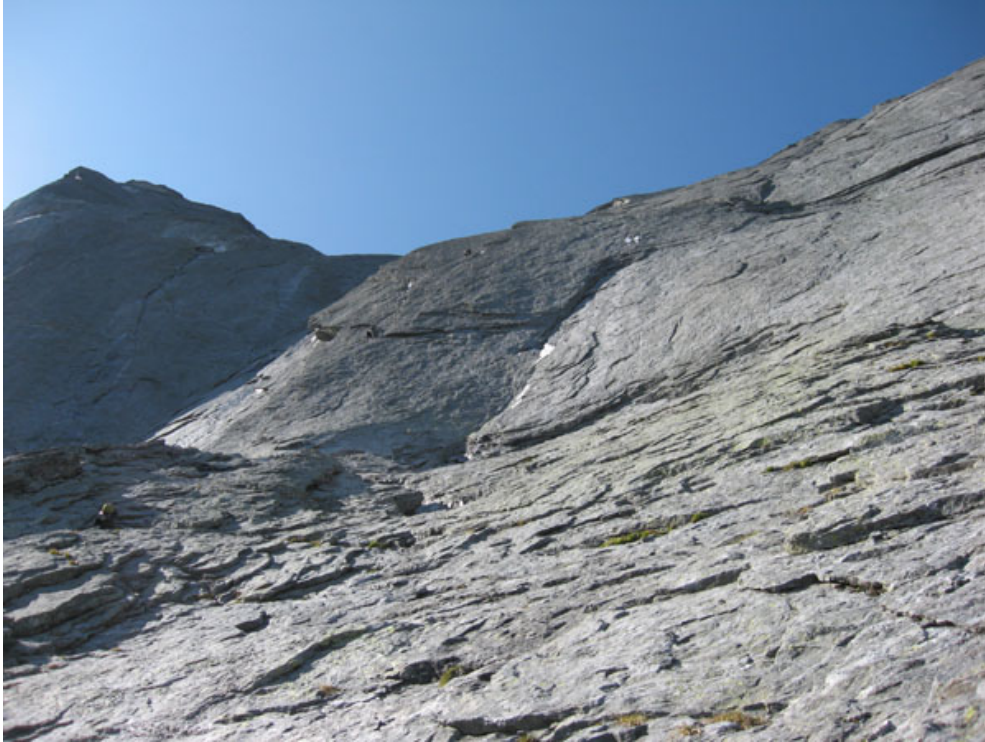
Verso la grande cengia e i diedri