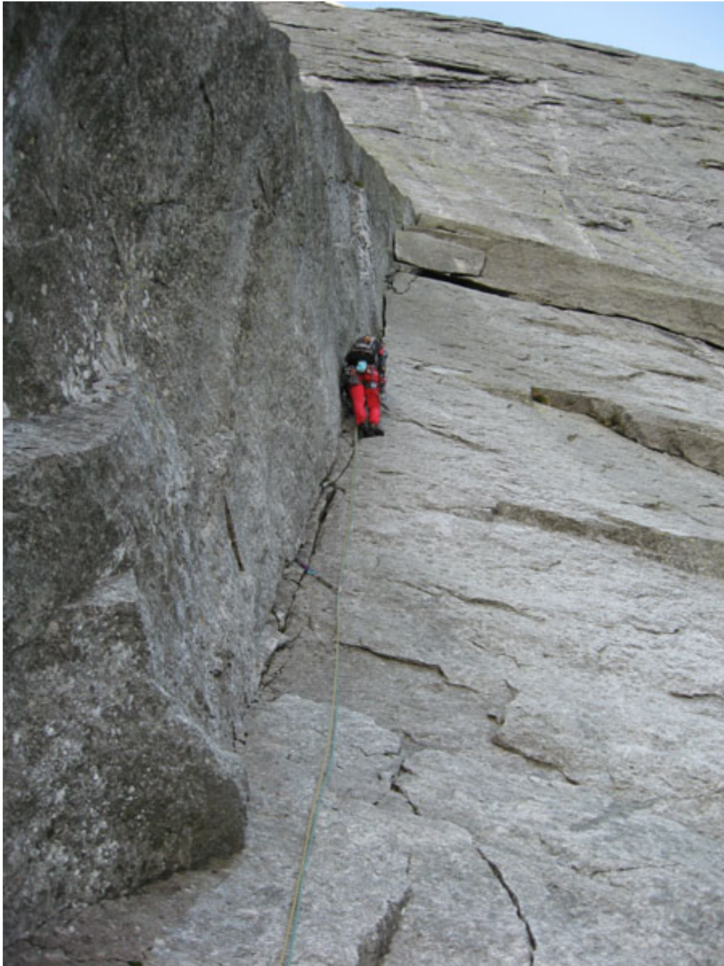
Simone sul diedro Rebuffat