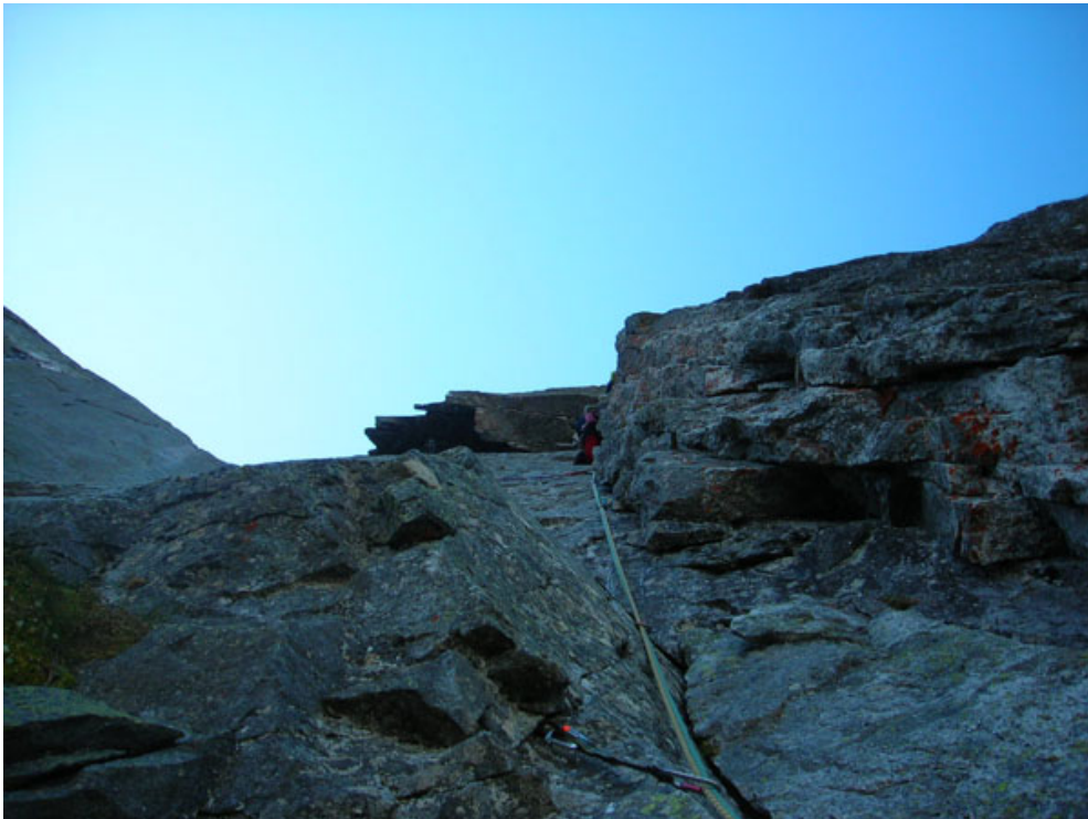
Walter sul diedro chiave