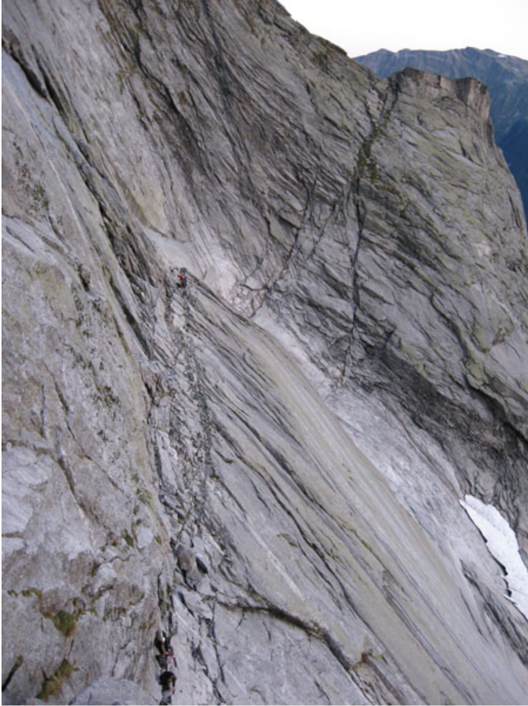
Colletto e cengia d'attacco