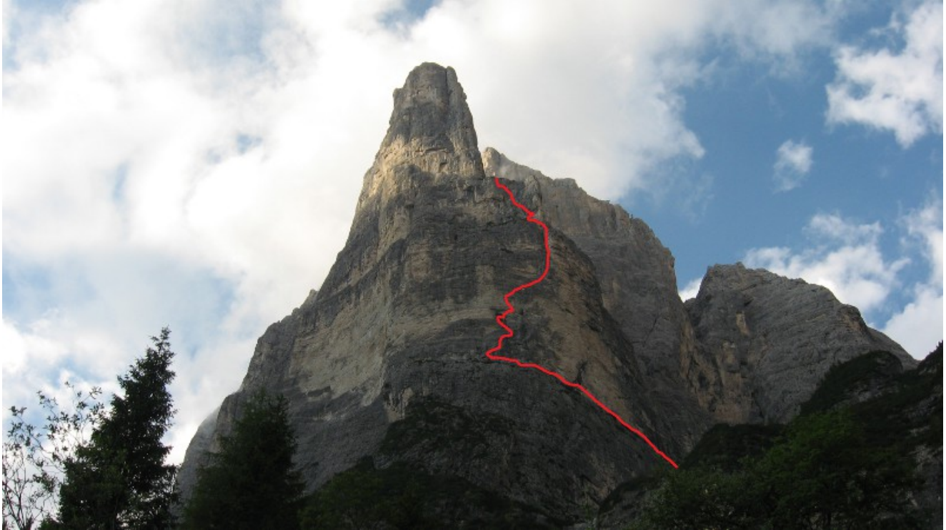
Tracciato della via fino alla seconda cengia