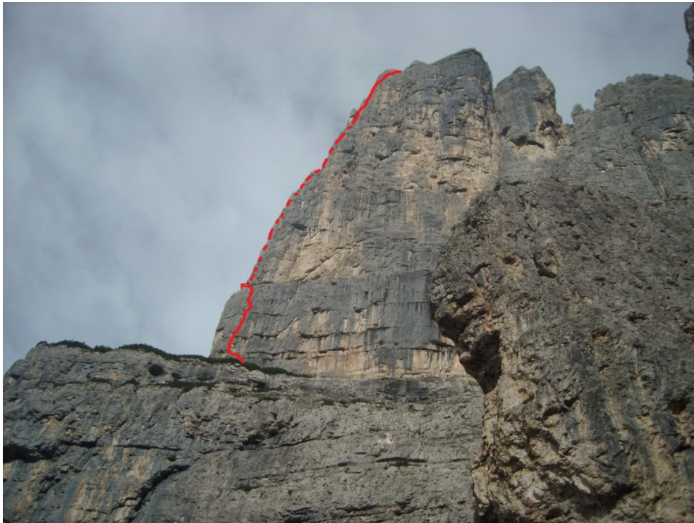
Tracciato della via sopra la seconda cengia