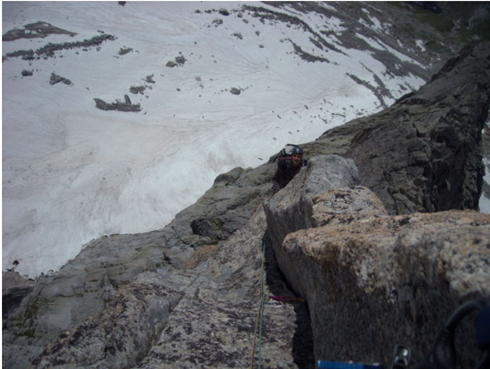
Emanuele in uscita dalla schiena di mulo