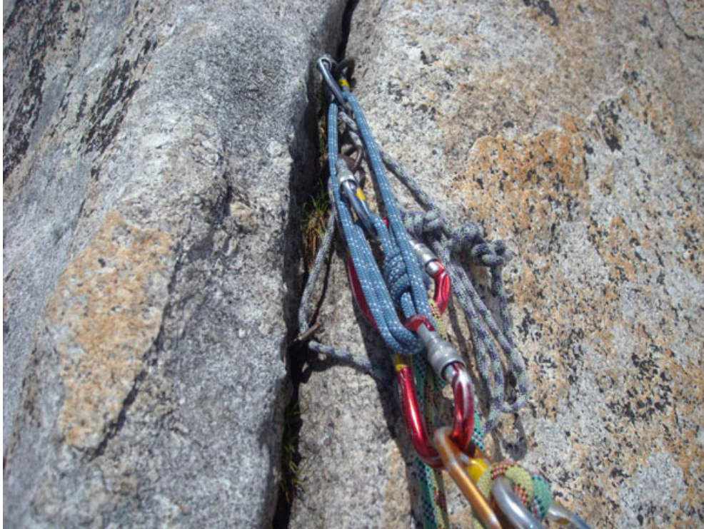
Sosta a chiodi