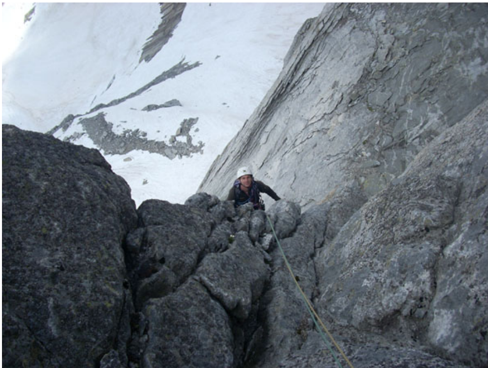
Uscita dal diedro nero