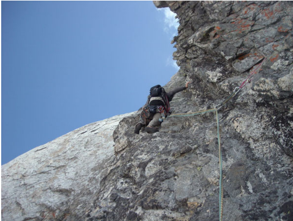
Il diedro nero