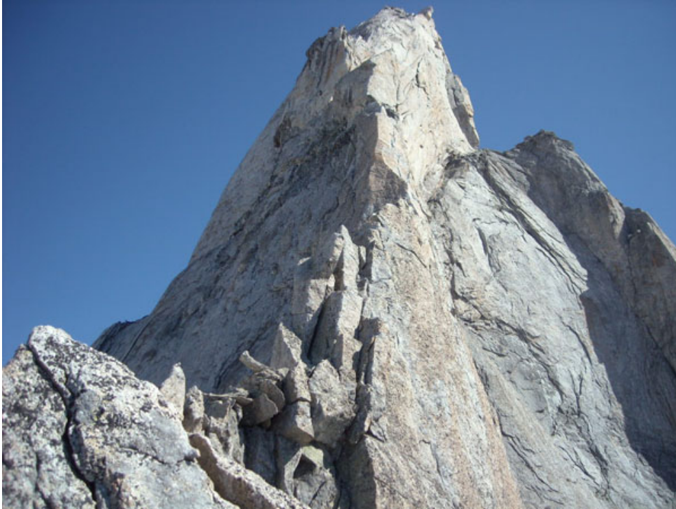
La magnifica linea dello spigolo Vinci