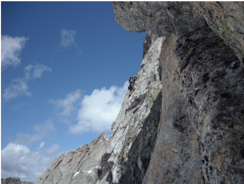
Il traverso prima del diedro nero