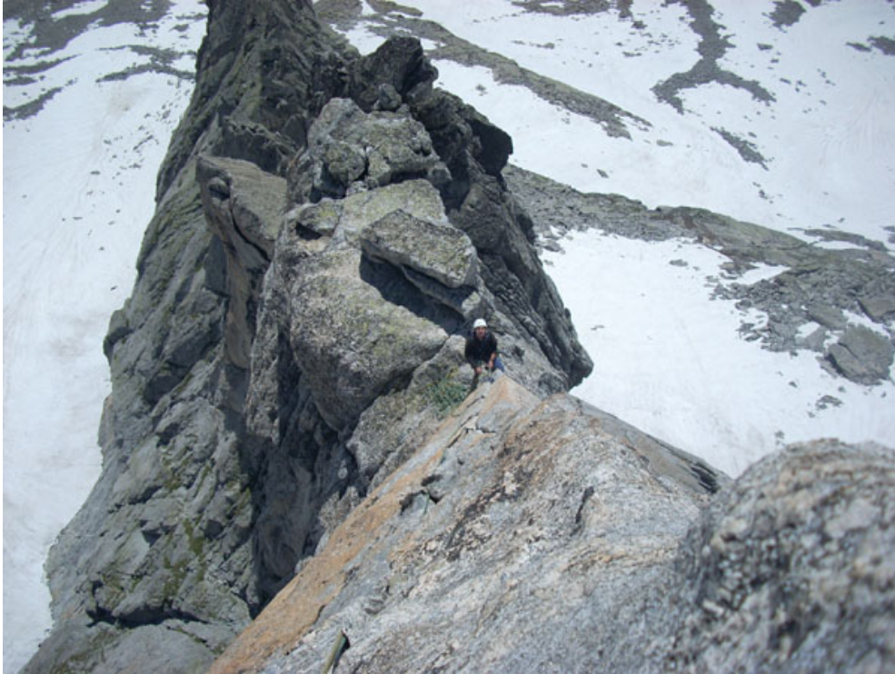
Simone alla base del salto giallo