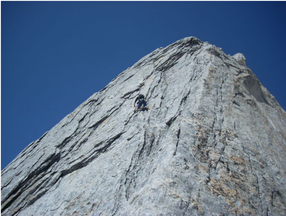
Simone sulle lame della decima lunghezza