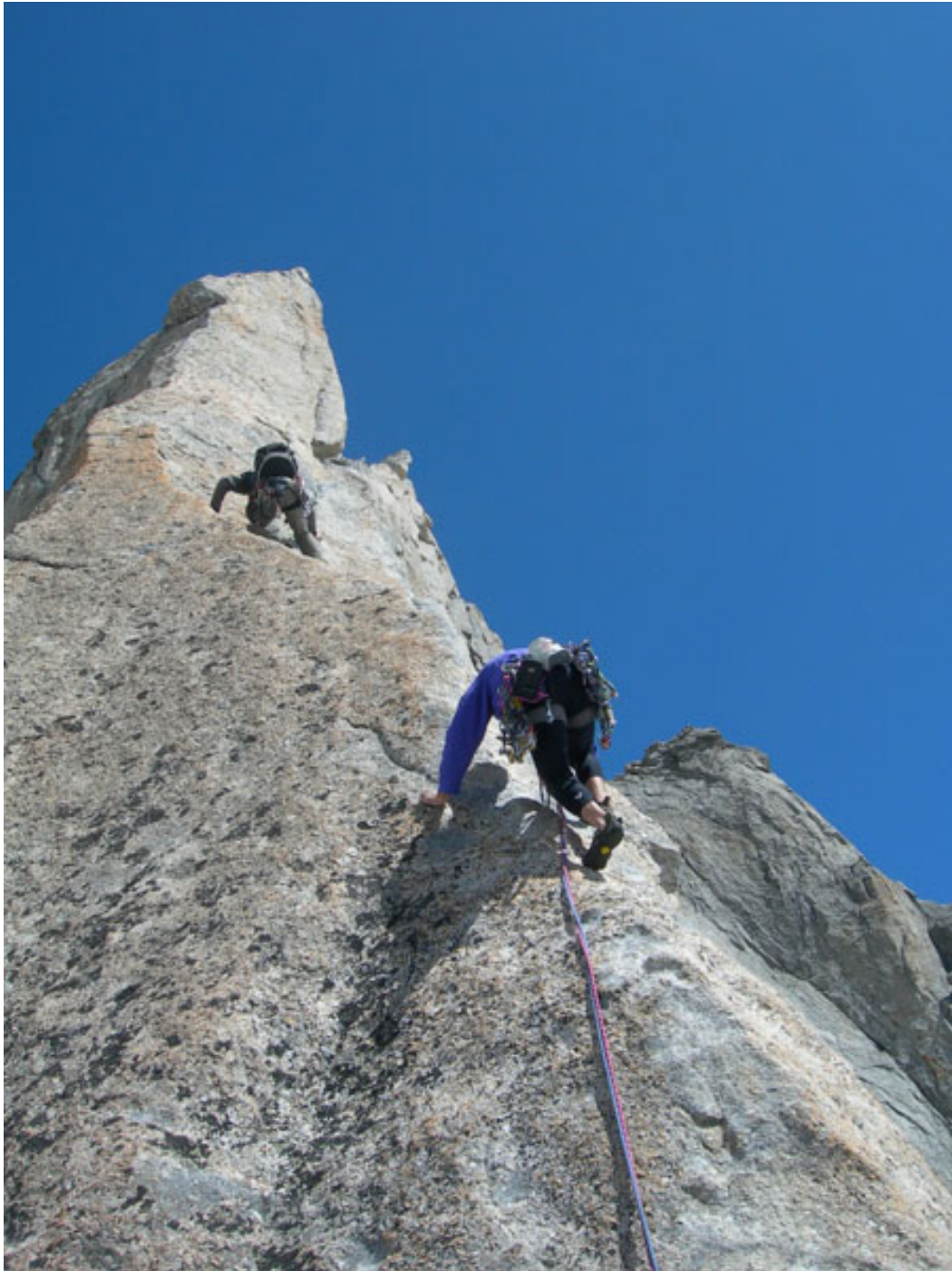
Lunghezza chiave della via: la schiena di mulo