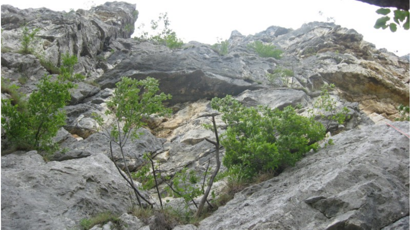
A sx il diedro grigio, a dx il monotiro degli orbi