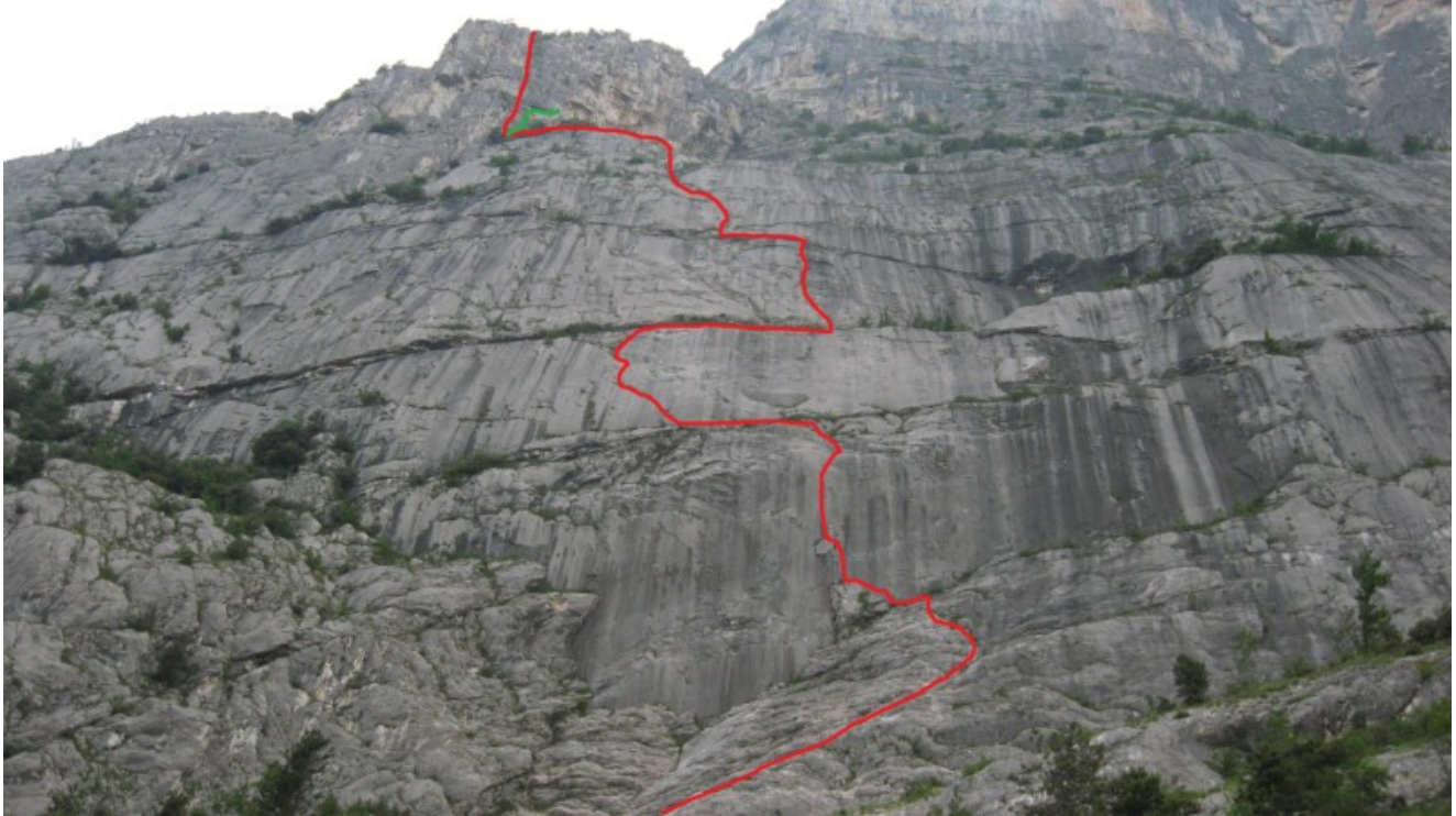
Tracciato della via (in verde il monotiro trad)