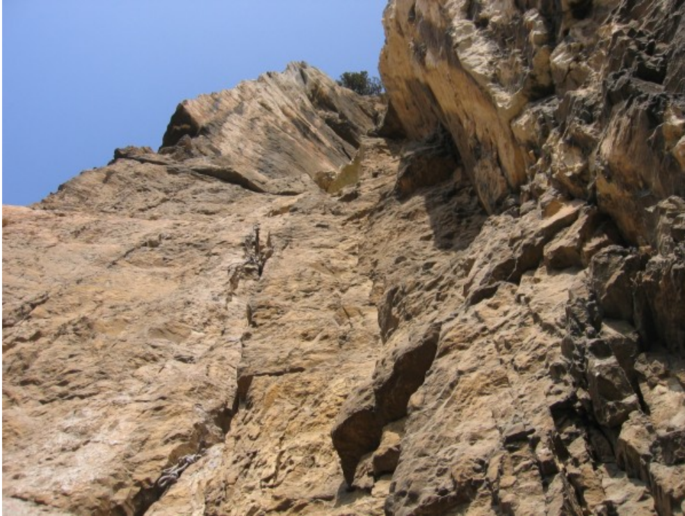
La fessura del quarto tiro