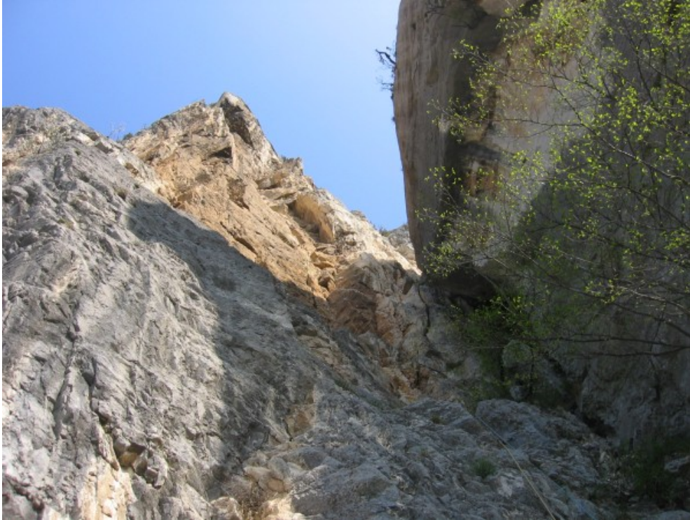
Sotto la via, dopo lo zoccolo