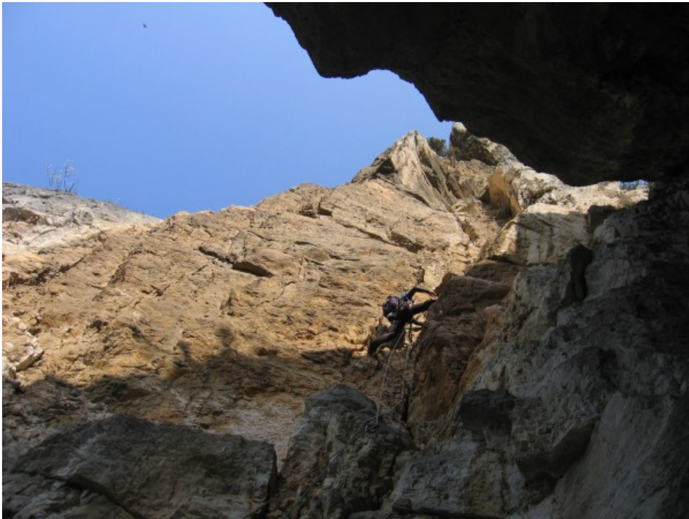
Olindo sul terzo tiro