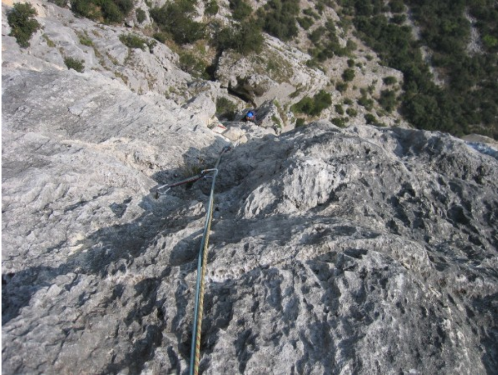
Il tiro di A0 (VII+)