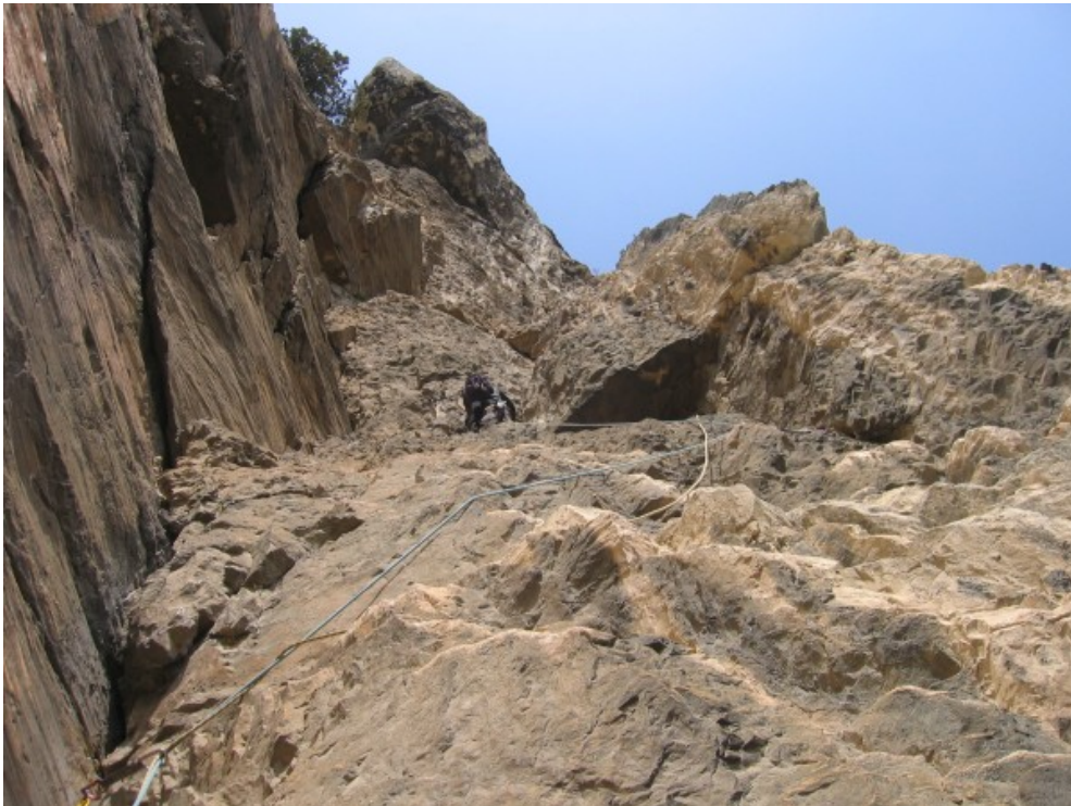
Oiindo sul quinto tiro