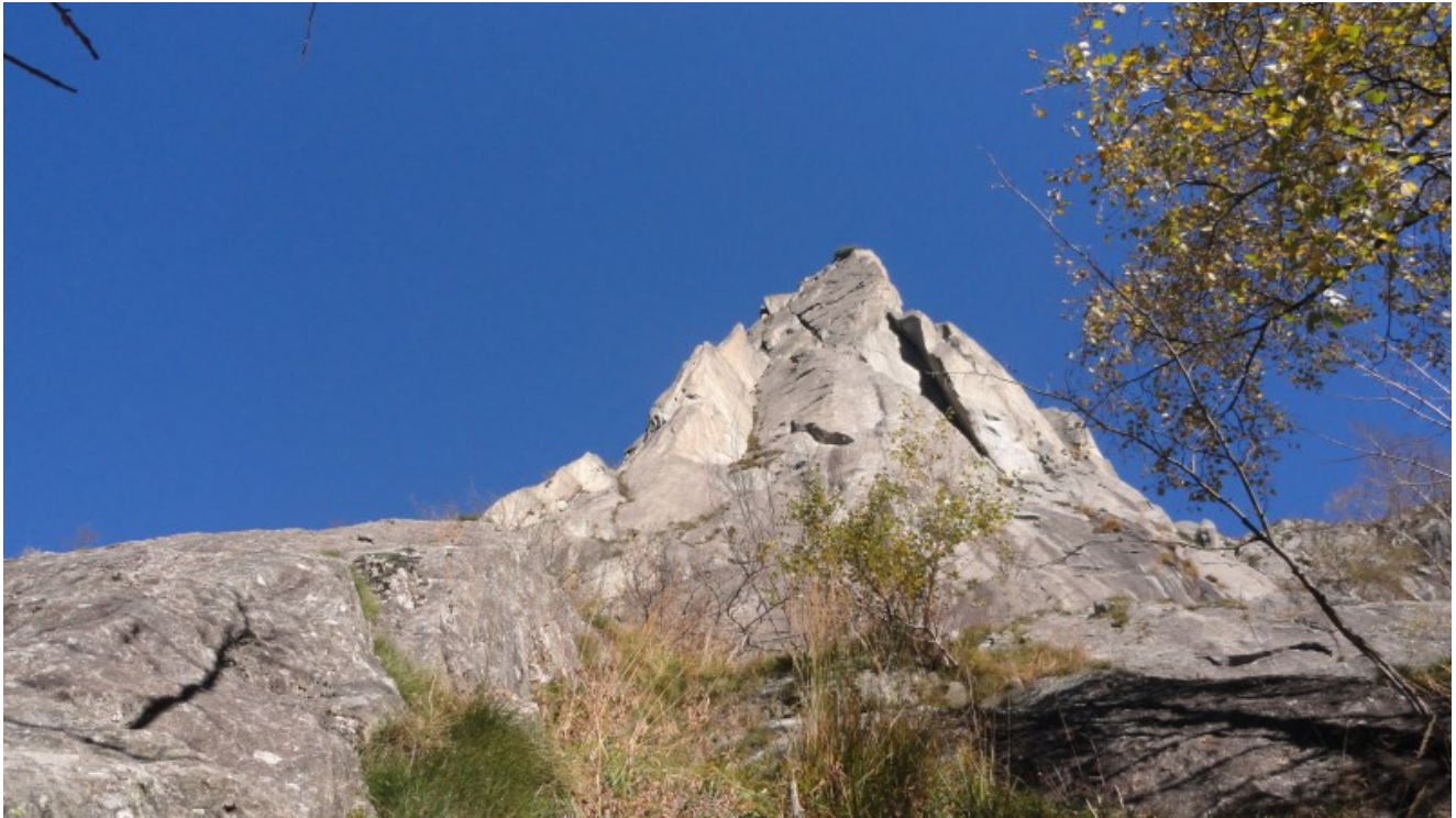
Il Pinnacolo dalla base