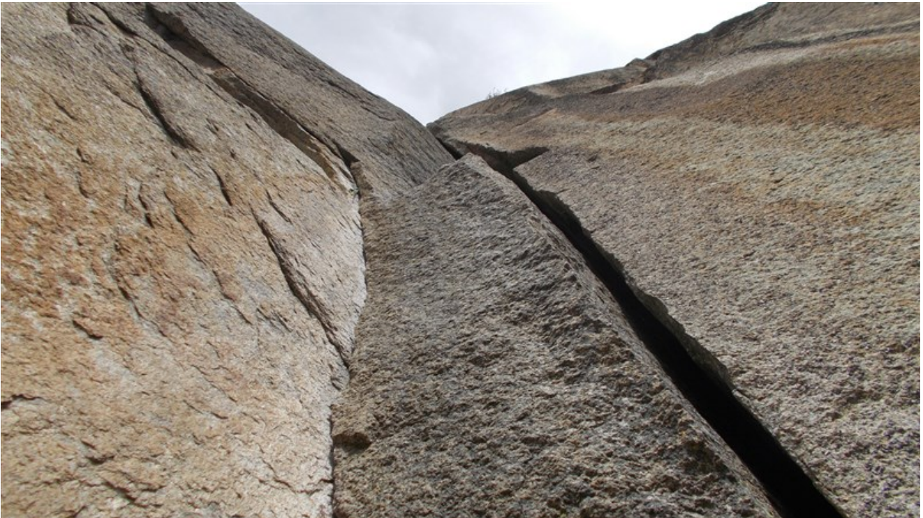
Partenza sesta lunghezza