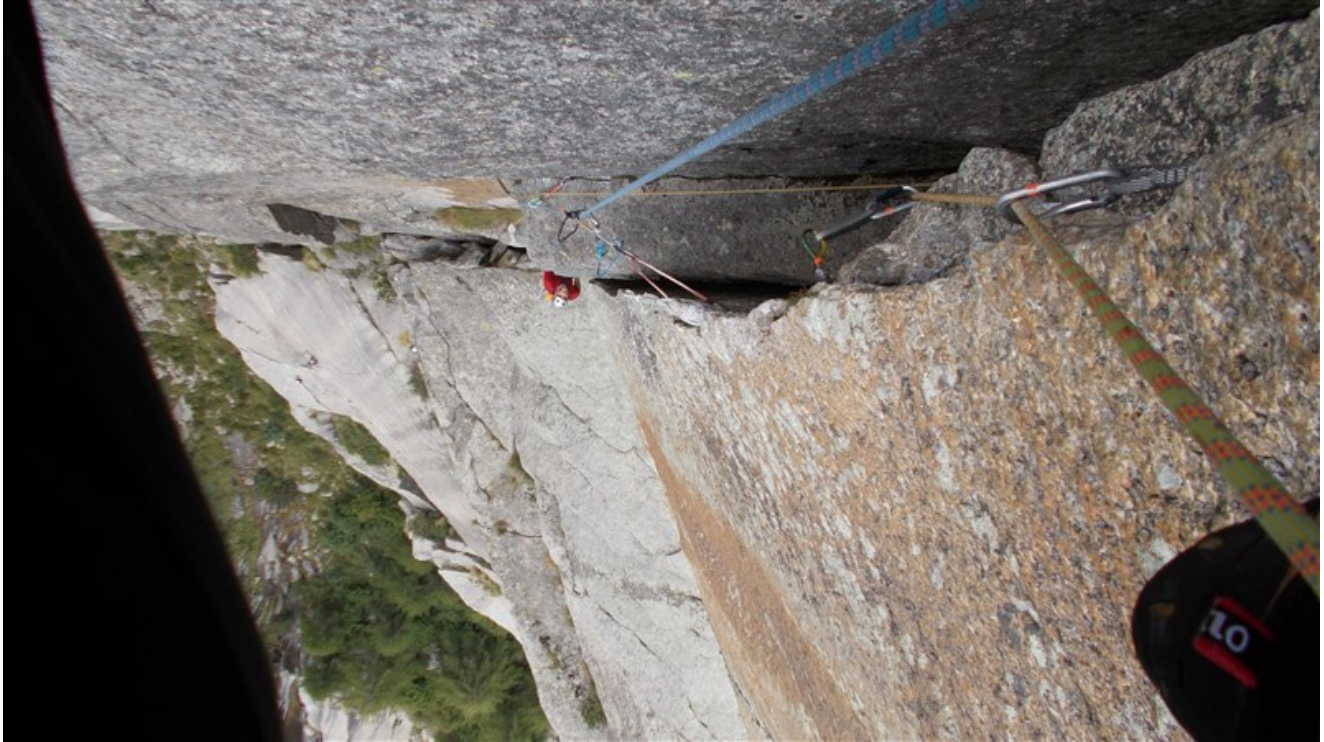
Sesta lunghezza, camino