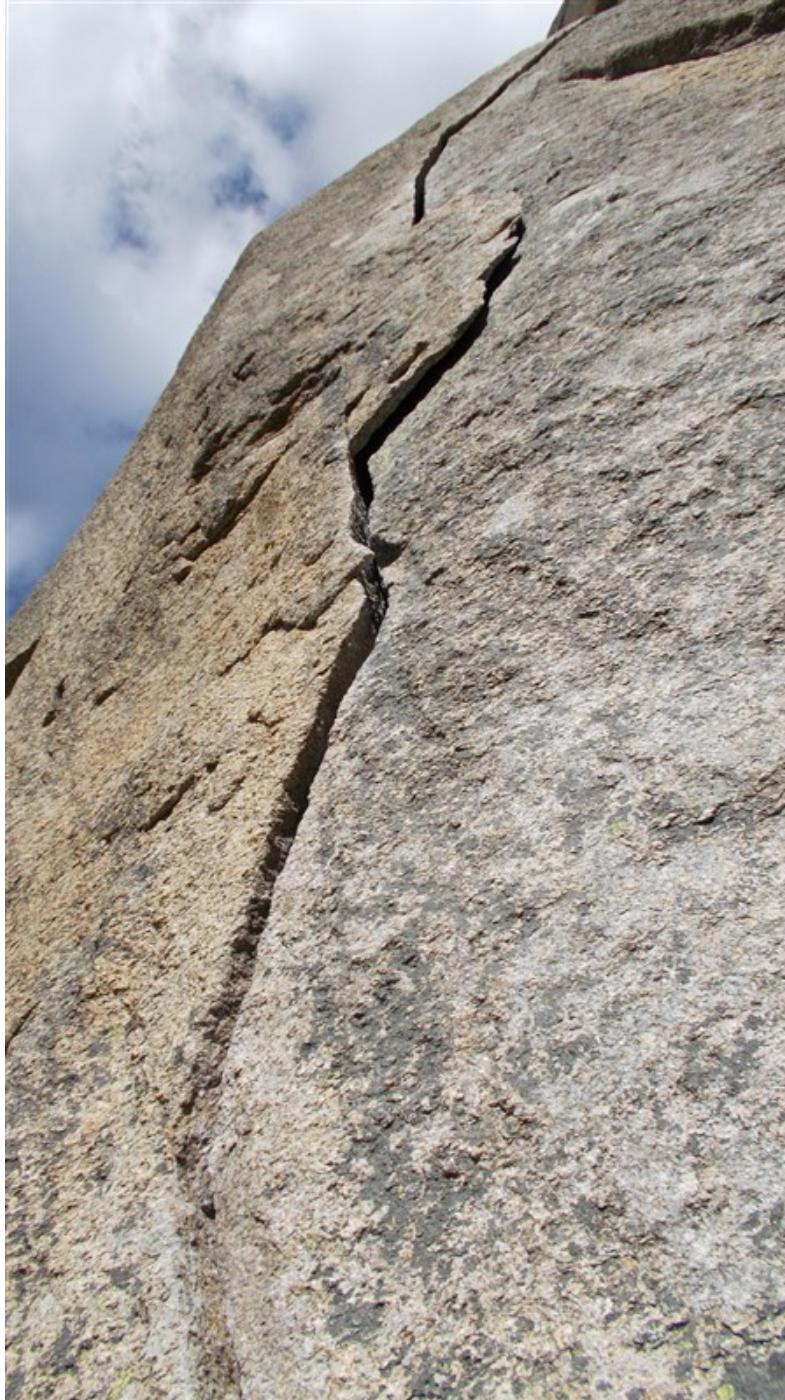
L'Orecchio del Pachiderma