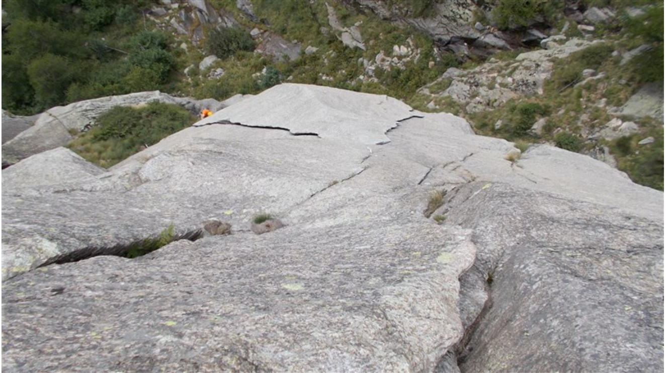
Uscita seconda lunghezza e terza lunghezza