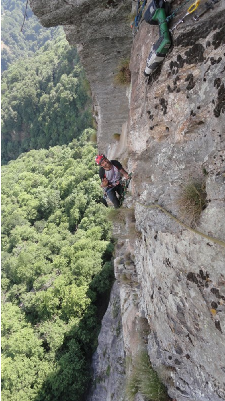
Uscita dalla sesta lunghezza