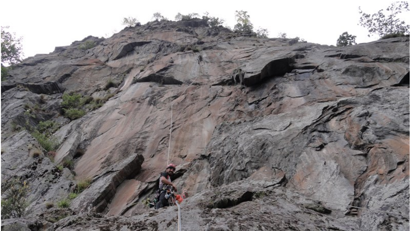
Alla base della terza e quarta lunghezza