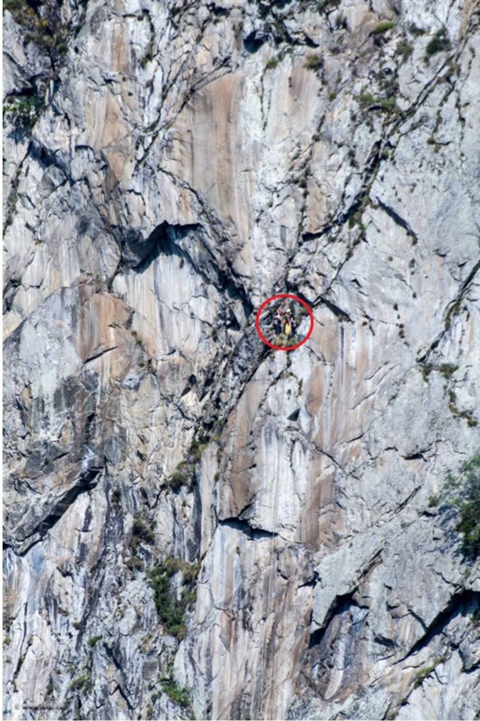
In parete, sosta 4