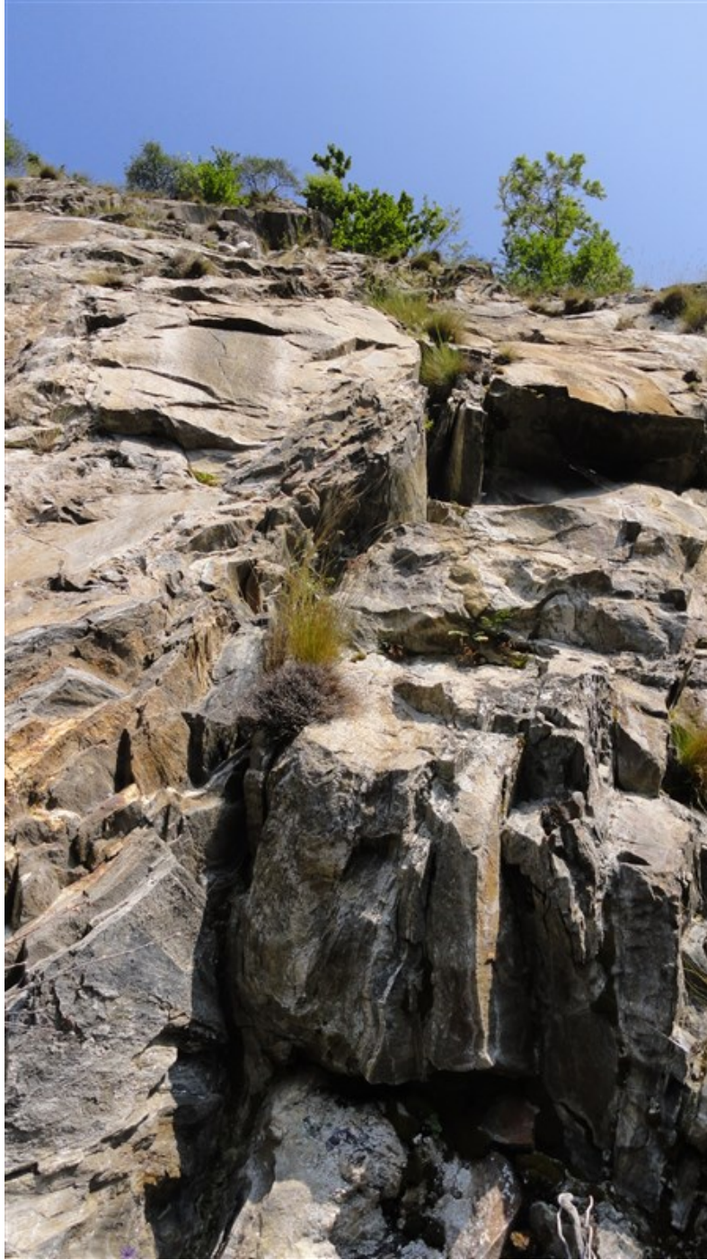
Quinta lunghezza, la rampa