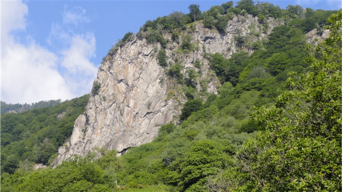
La parete da Solada