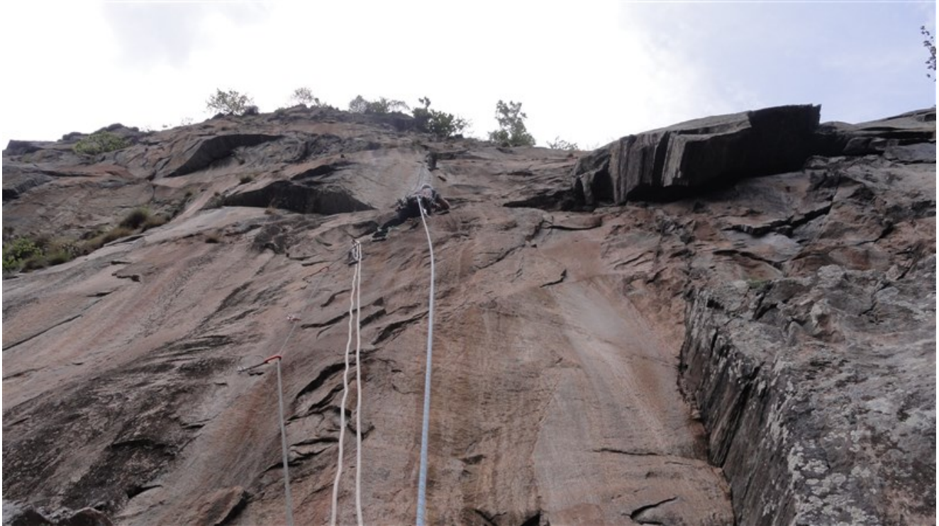
Tommaso sulla terza lunghezza, il muro arancione