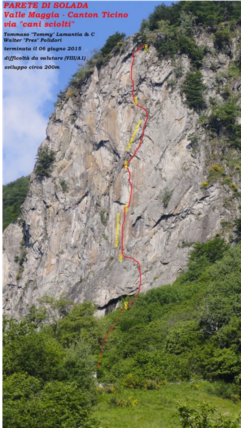
Tracciato della via