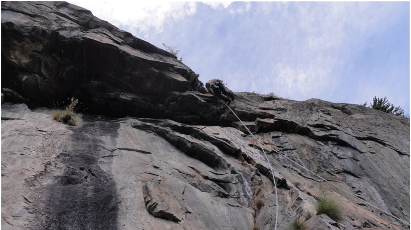
Tommaso sulla seconda lunghezza