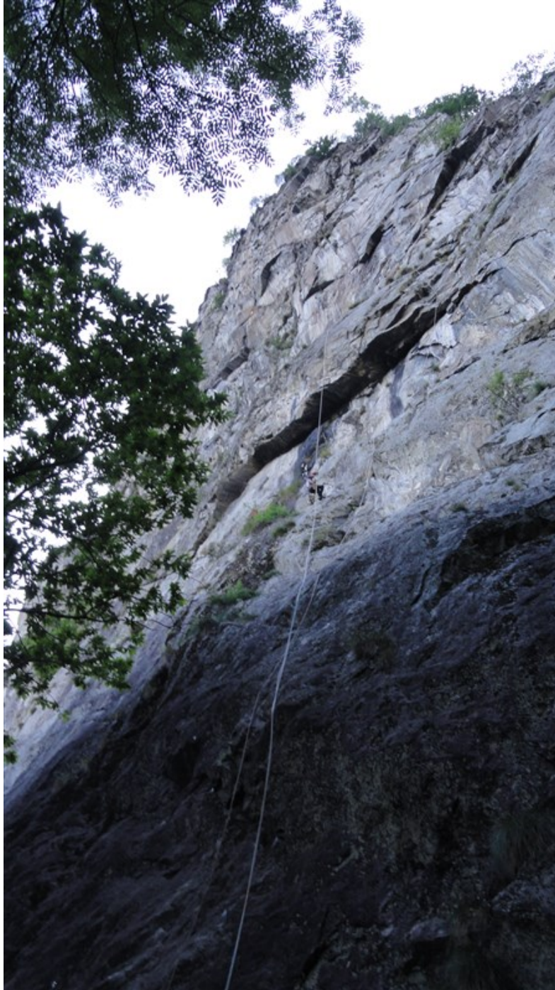
La parete dalla base