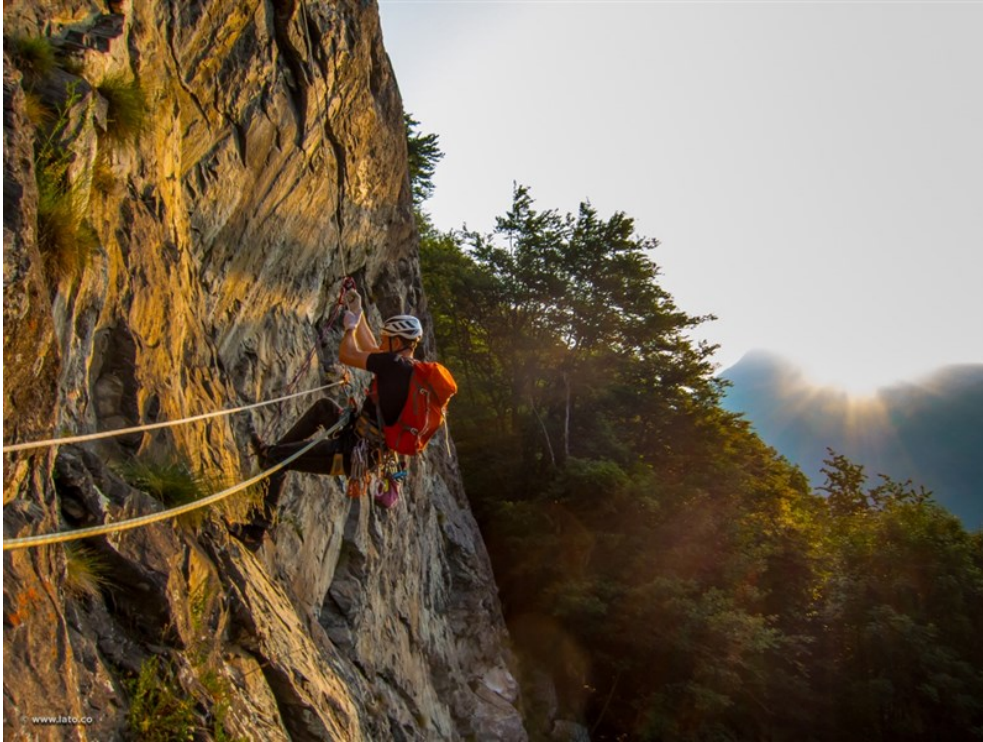
Risalita sulle fisse della seconda lunghezza