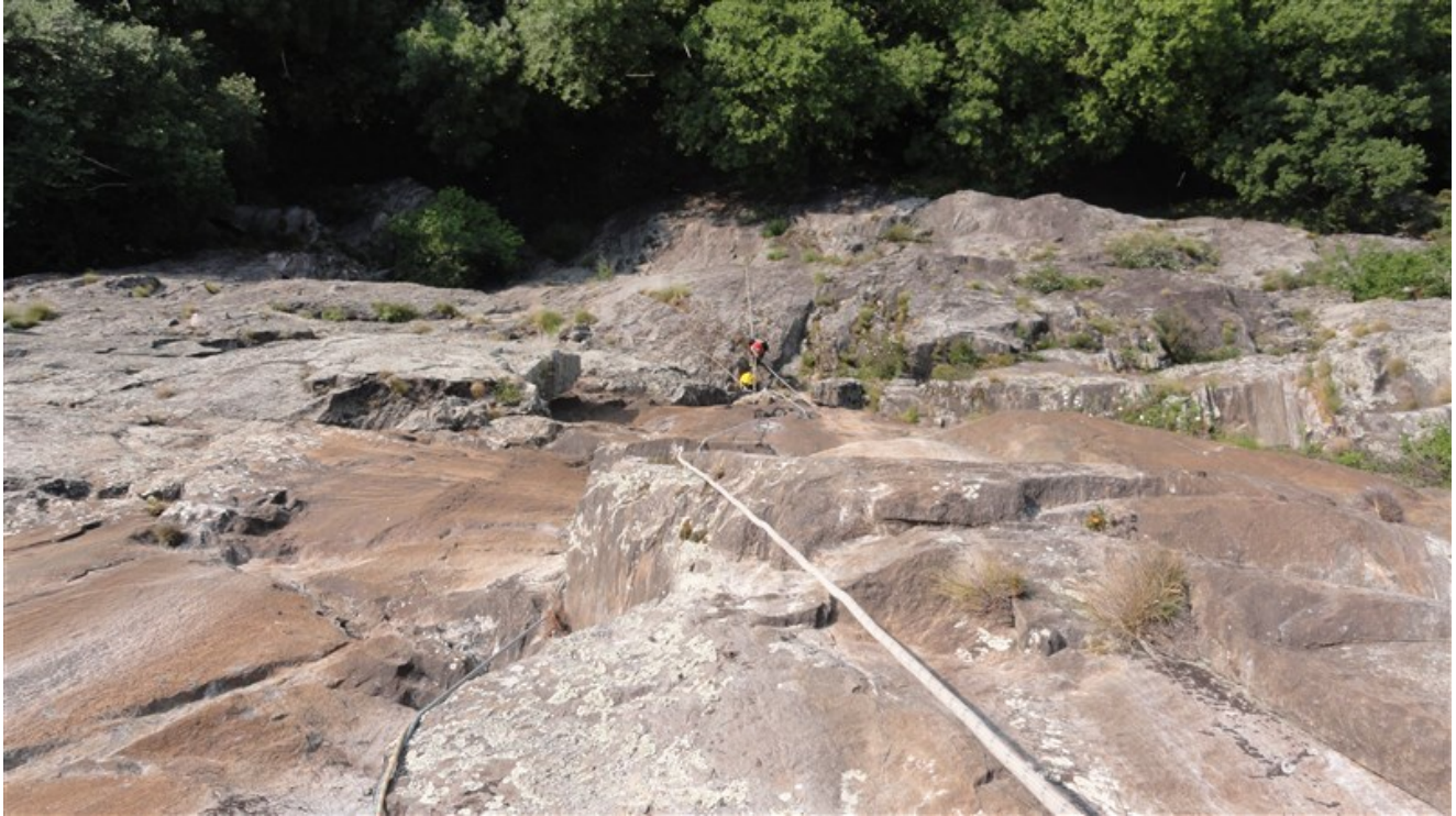
Terza e quarta lunghezza dall'alto