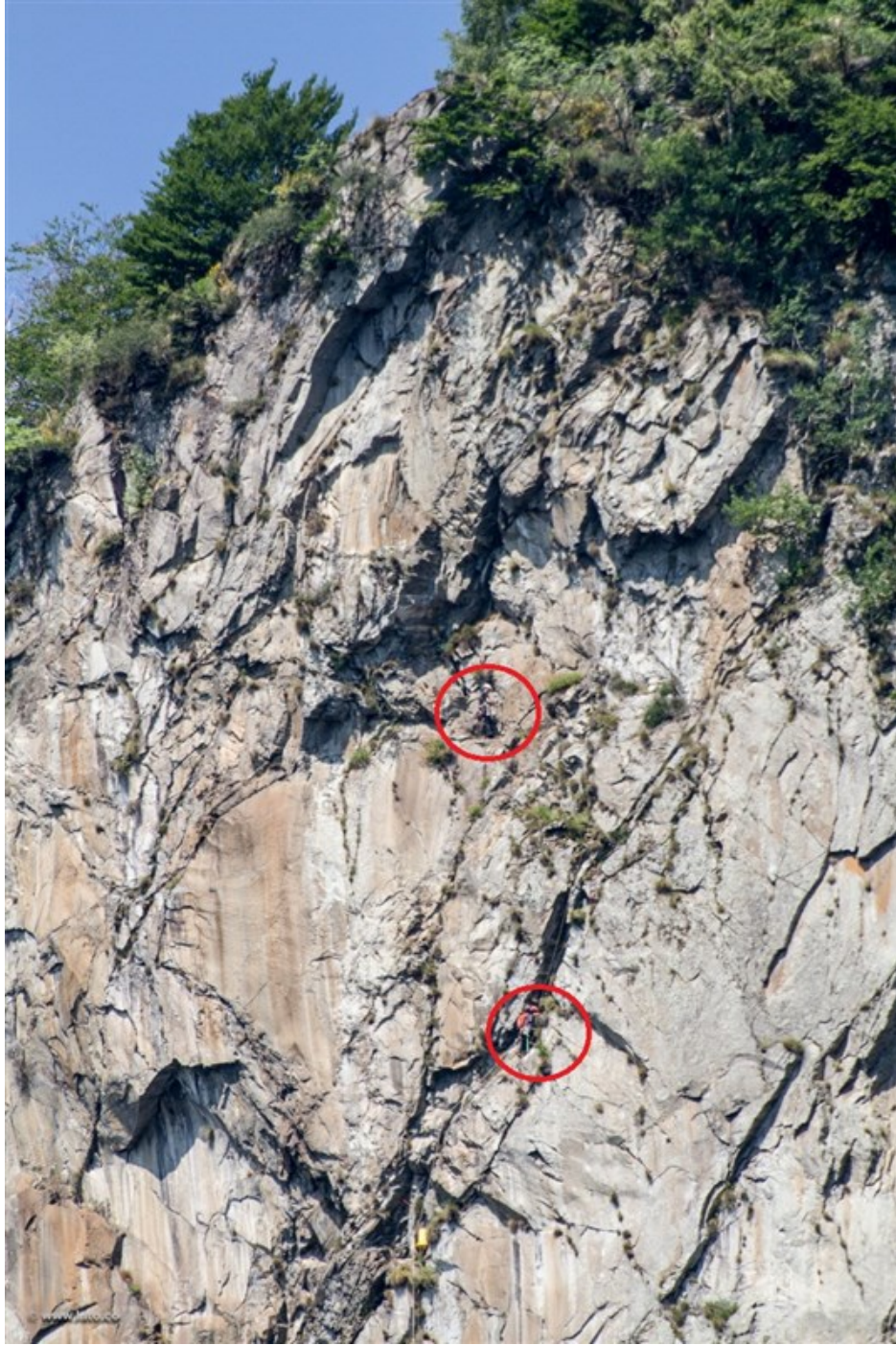
In parete, Walter alla sosta 5 e Tommaso sulla rampa