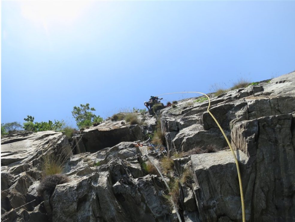
Walter sulla quinta lunghezza