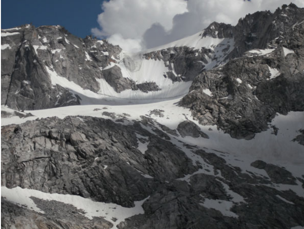
La parete nord: si arriva alla base da sinistra