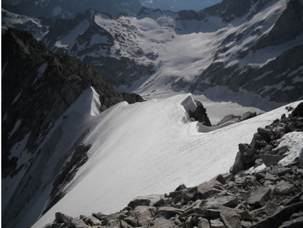
La breve cresta finale che conduce in vetta