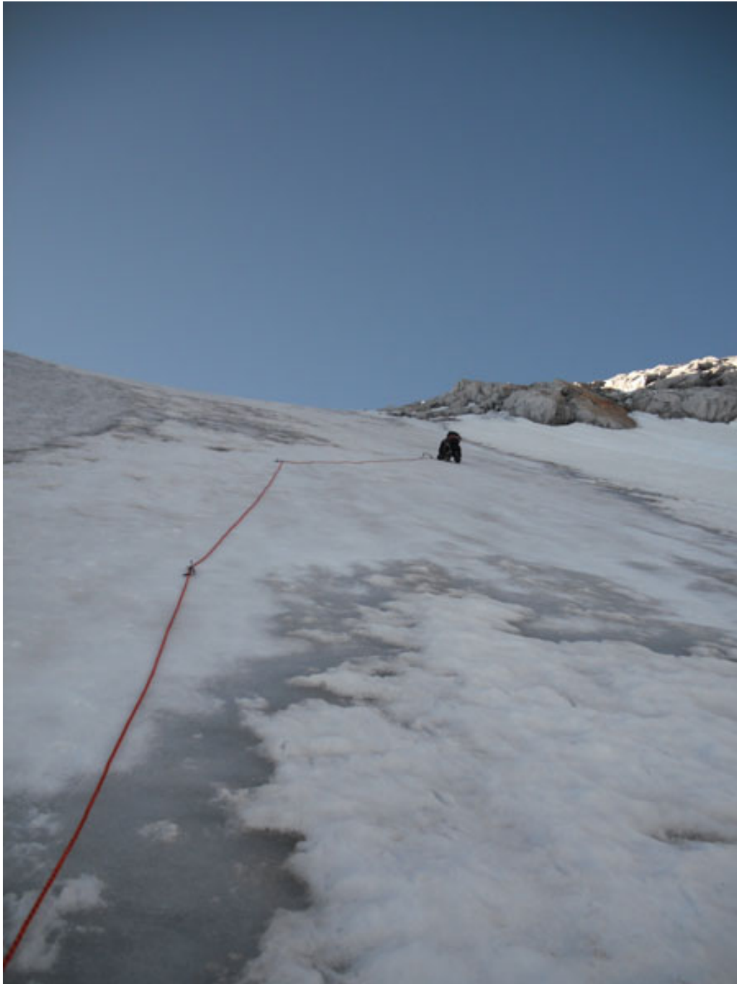
I tiri sul ghiaccio...