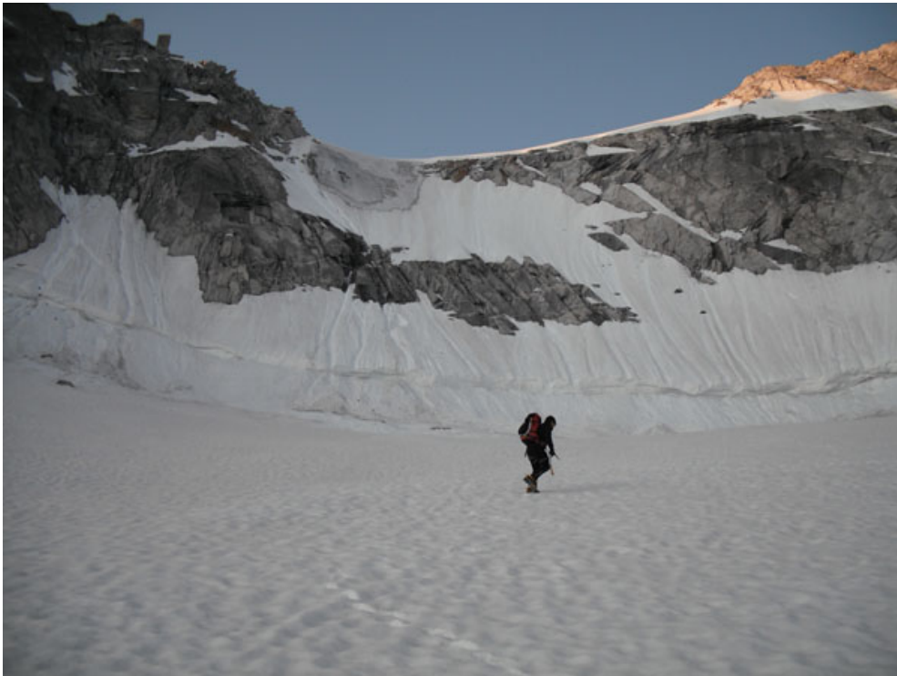
Nei pressi della crepaccia terminale