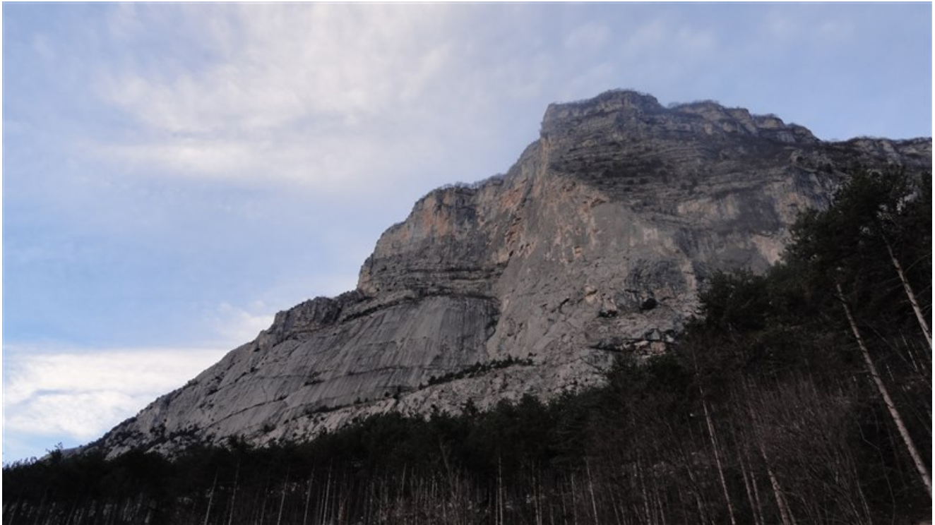
Cima alle Coste