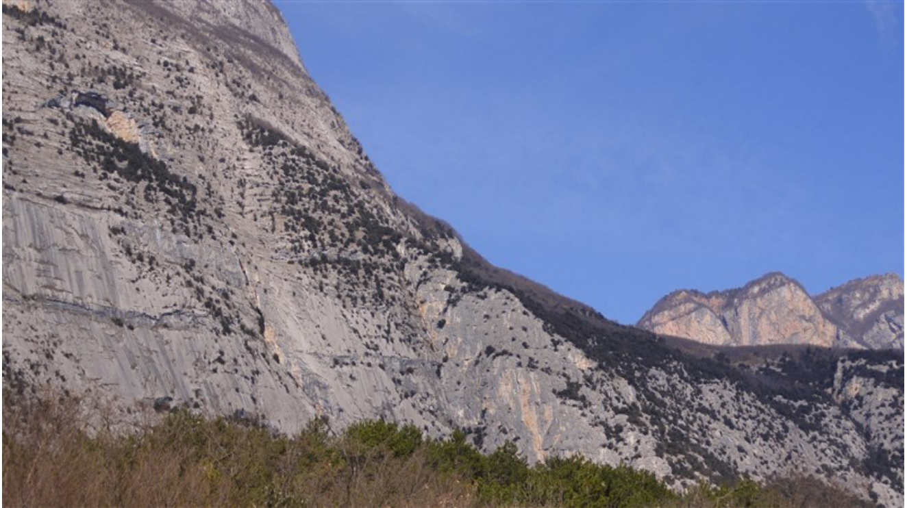
Pala dele Lastiele all'estrema dx delle Placche Zebrate