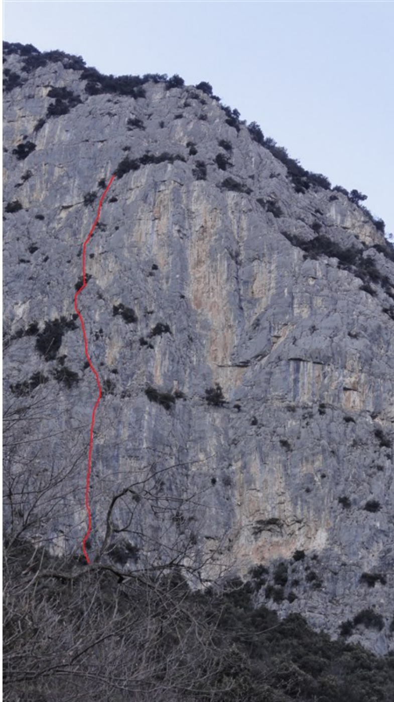
Tracciato indicativo della via