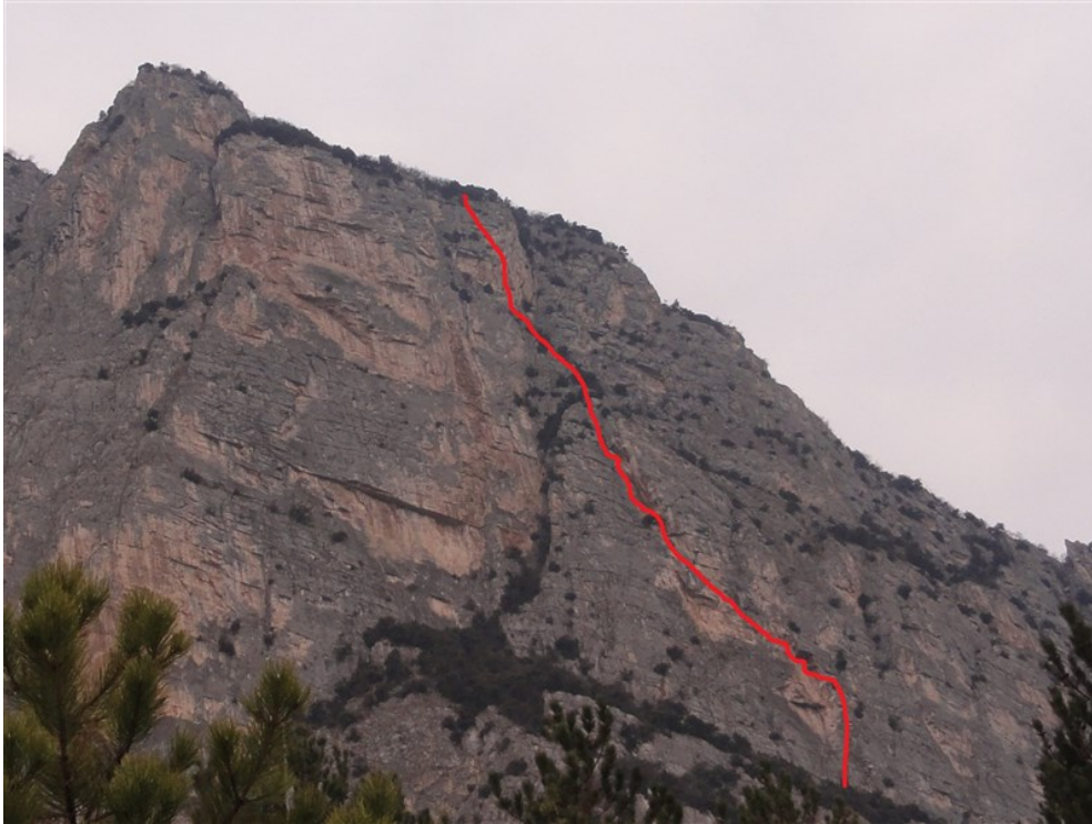
Tracciato indicativo della via