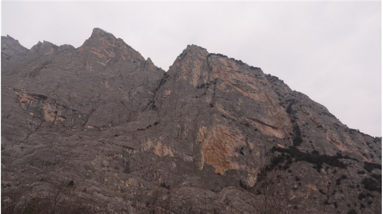
Monte Casale, I e II Pilastro