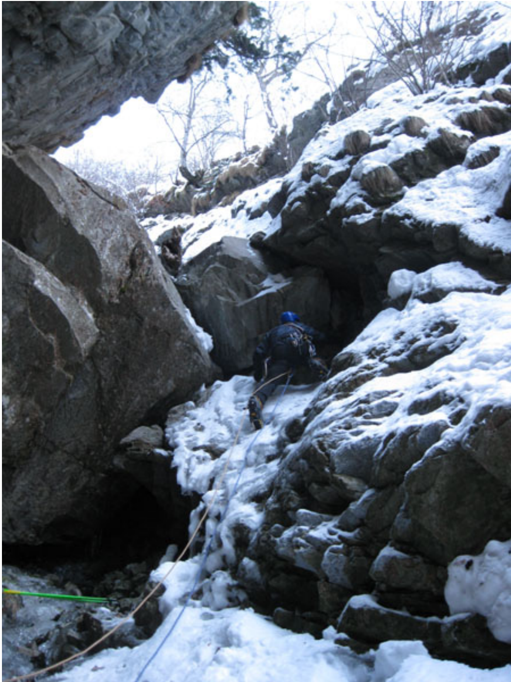
Paolo attacca il masso incastrato al primo tiro