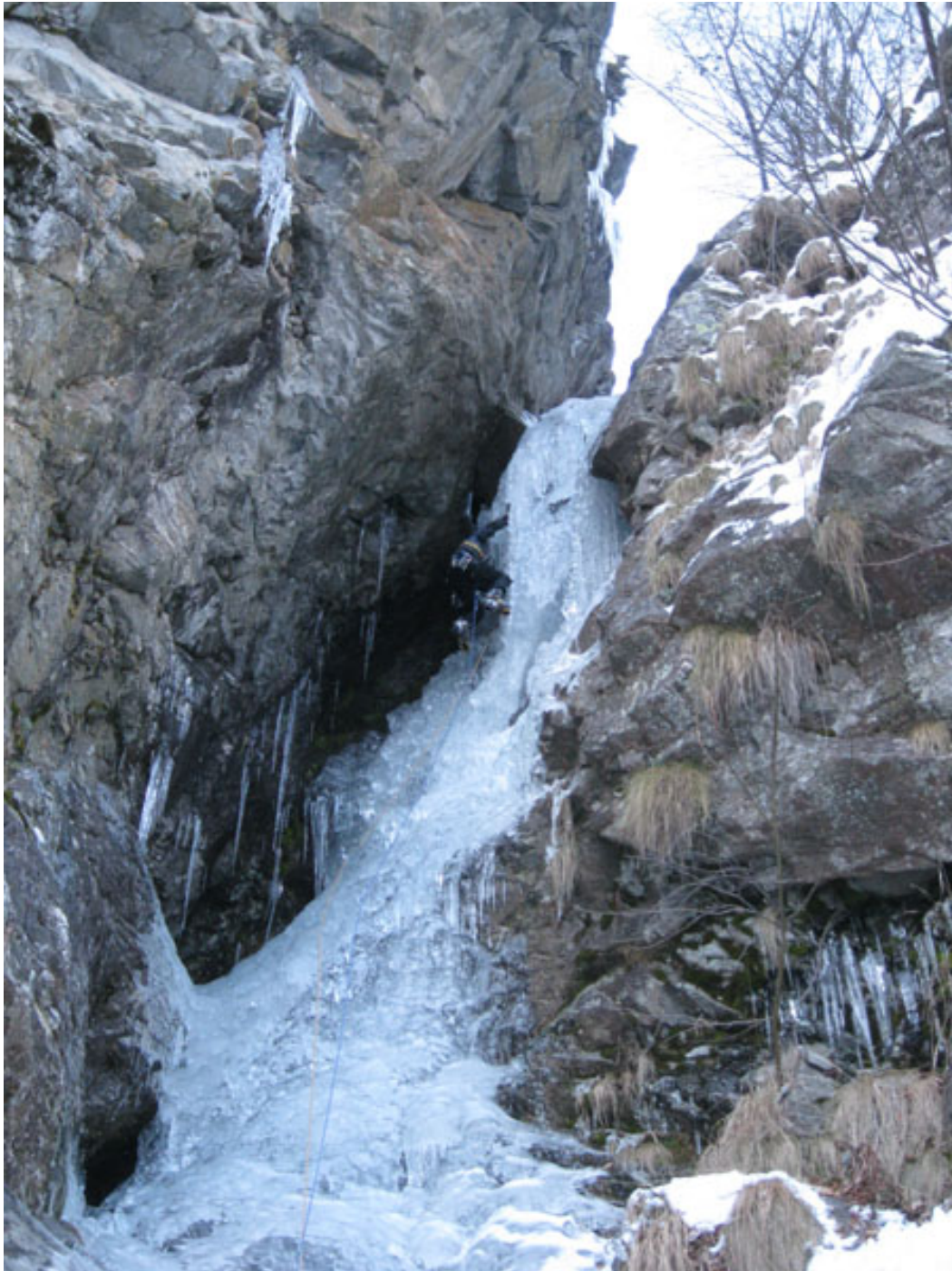
Paolo sul delicato 4° tiro