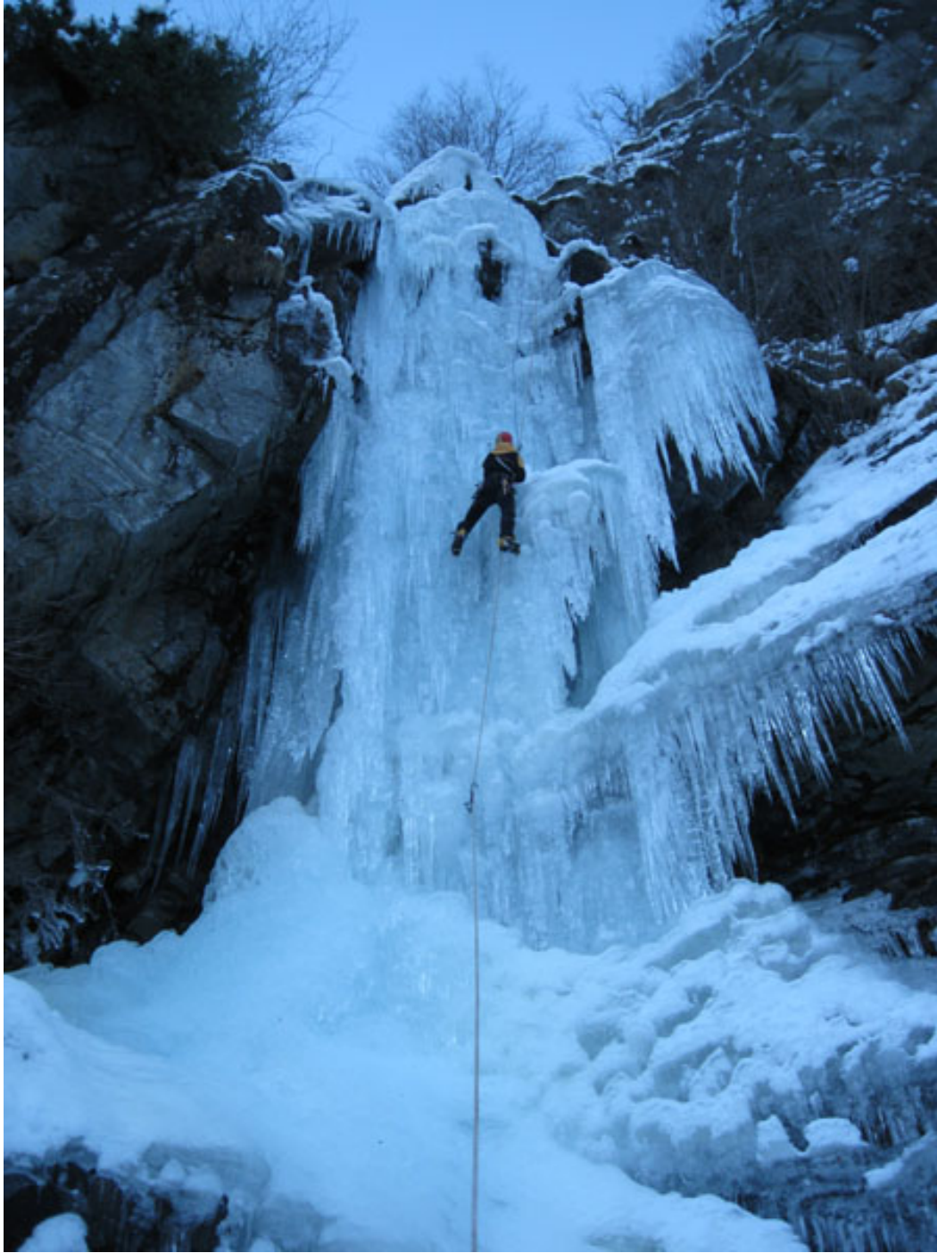
Guido sullo spettacolare 3° tiro