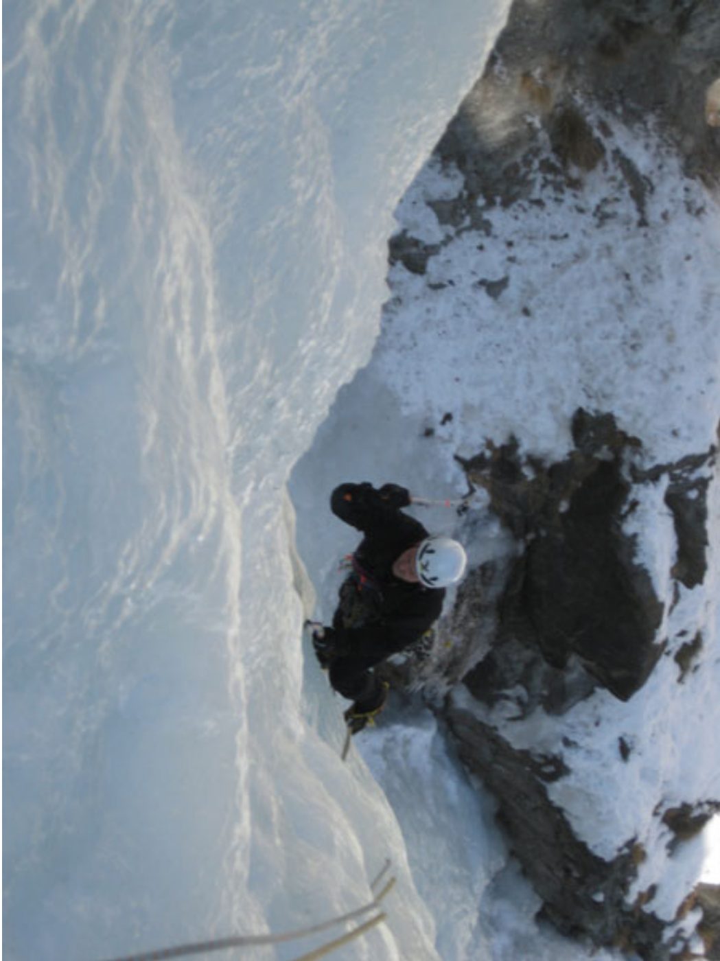
Walter sul terzo tiro