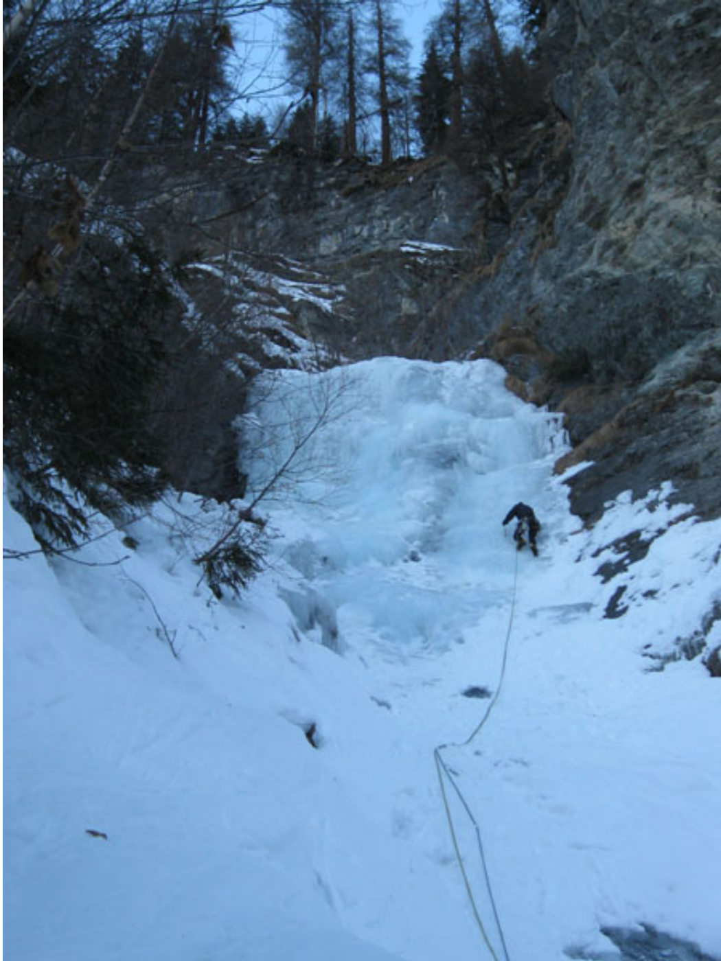
Il secondo salto