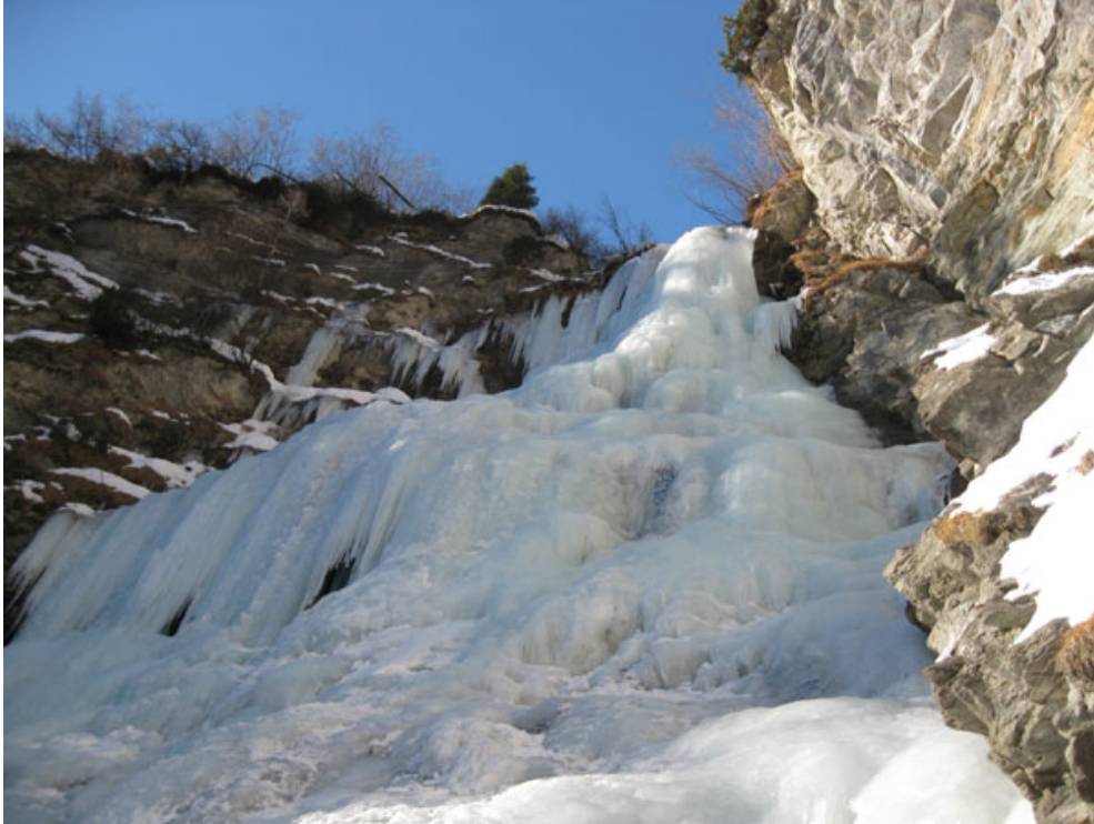
La colata finale (terzo e quarto tiro)