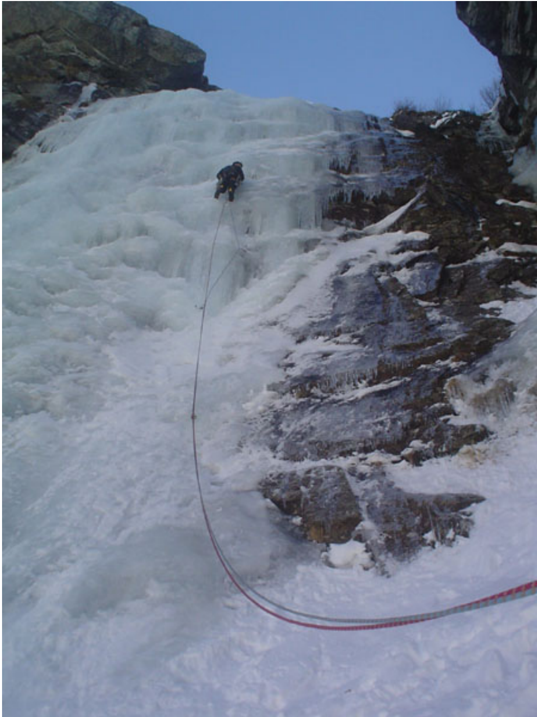
Walter sul tiro chiave: l'ultimo