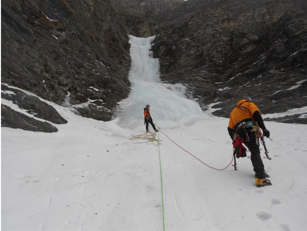
In avvicinamento all'ultimo salto