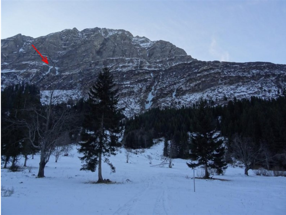
La parete del Gugernull con indicata la via Abalakov