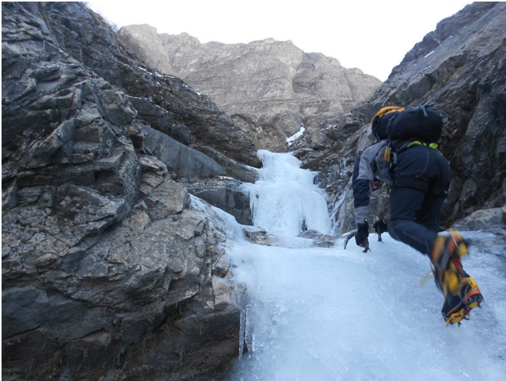
I primi semplici salti