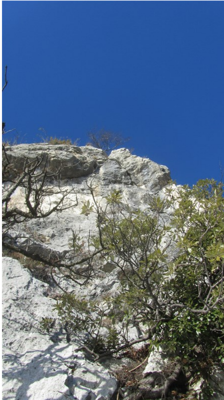
Terza lunghezza, in alto a dx la fessura strapiombante che si evita a dx