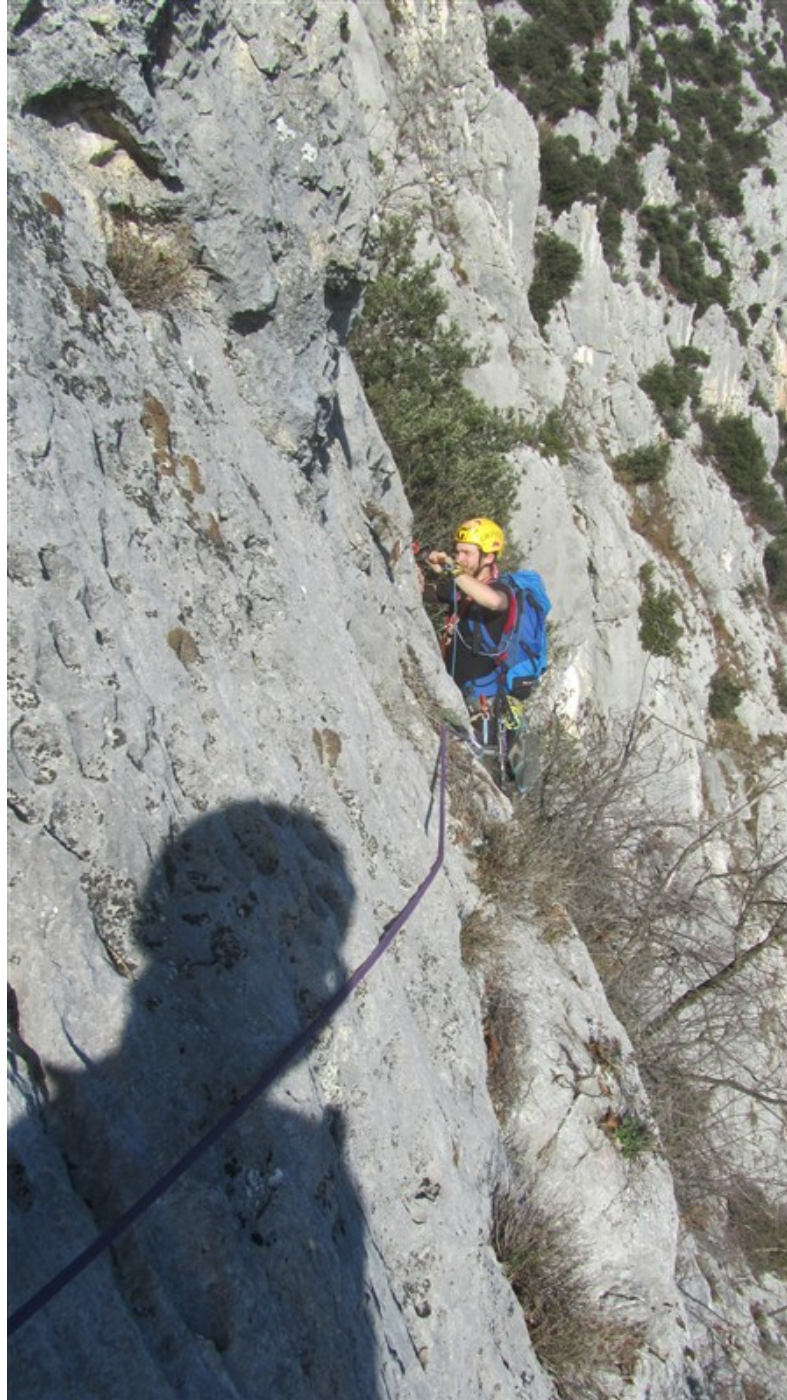
Il traverso del secondo tiro