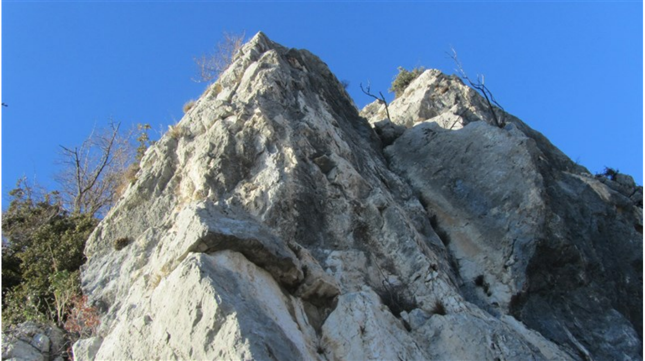
Lo spigolo iniziale della quarta lunghezza