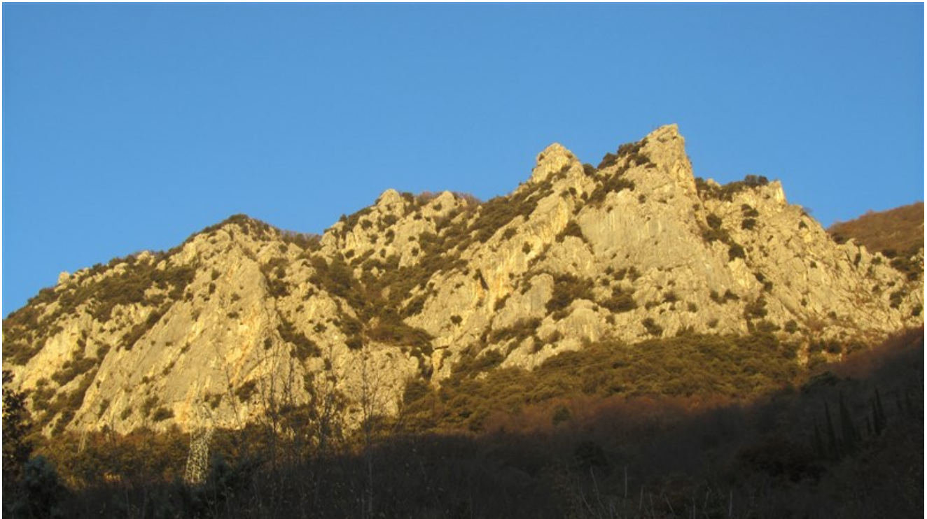
Pilastri S. Valentino