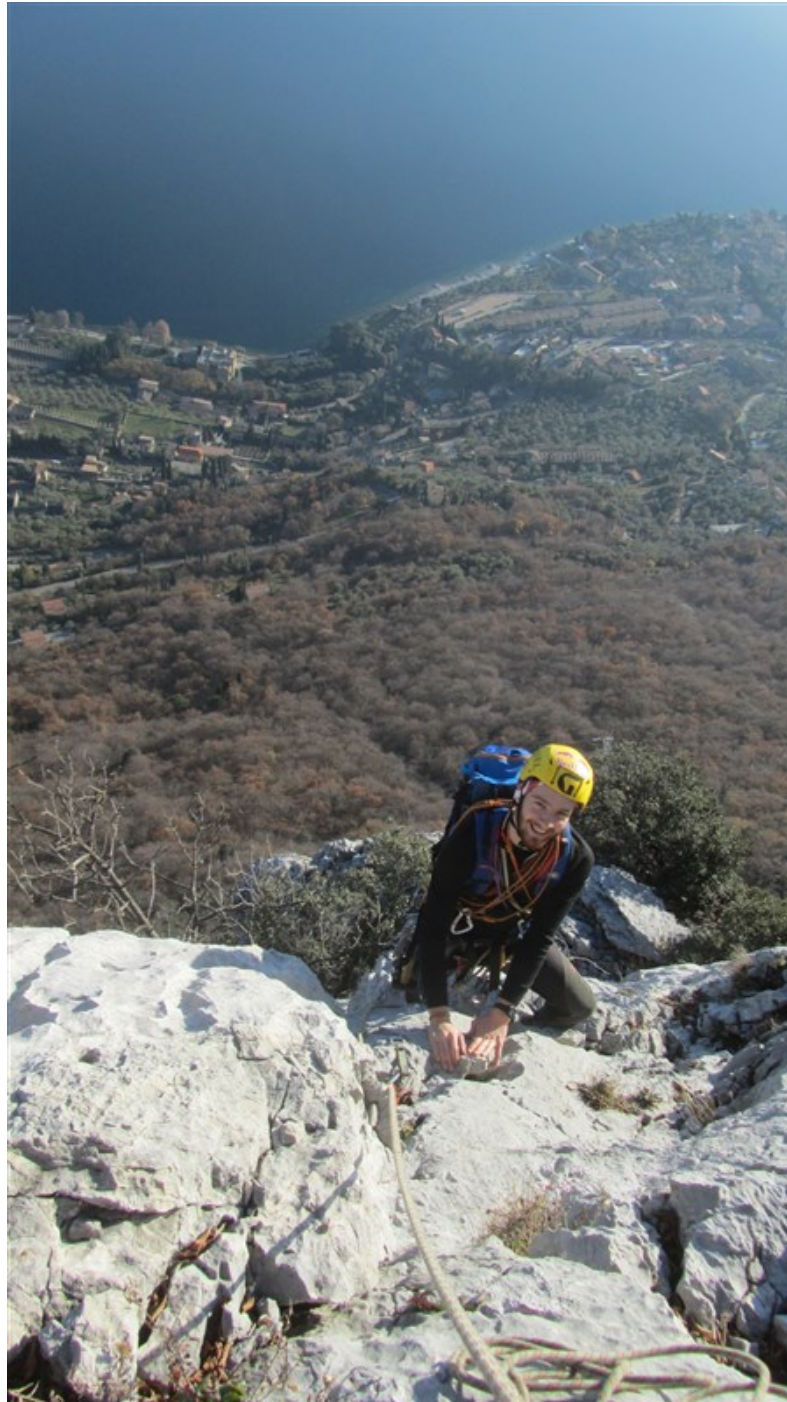
Uscita dalla quarta lunghezza