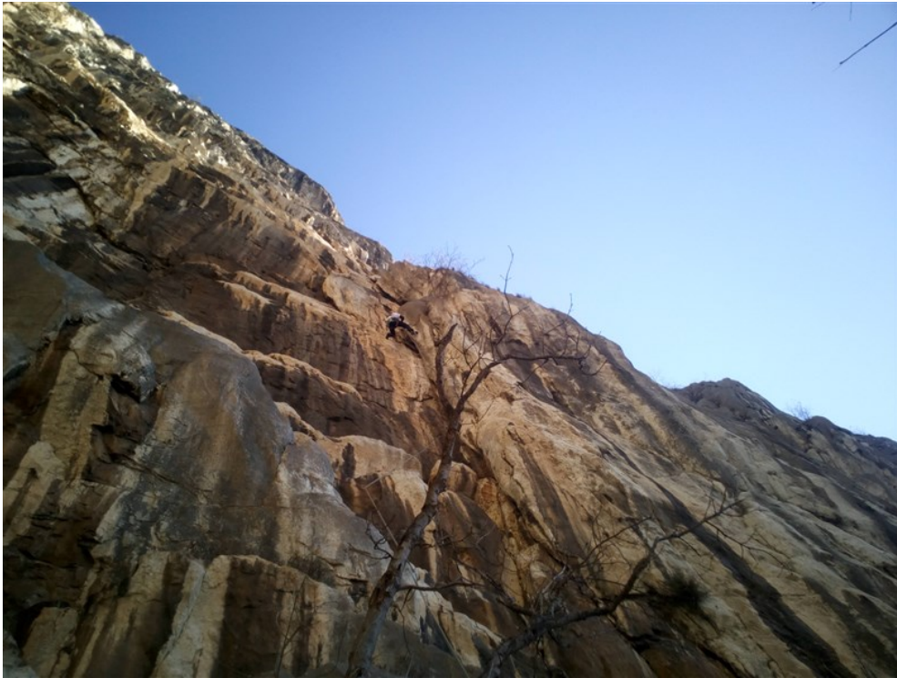
Simone sul diedro impegnativo della prima lunghezza