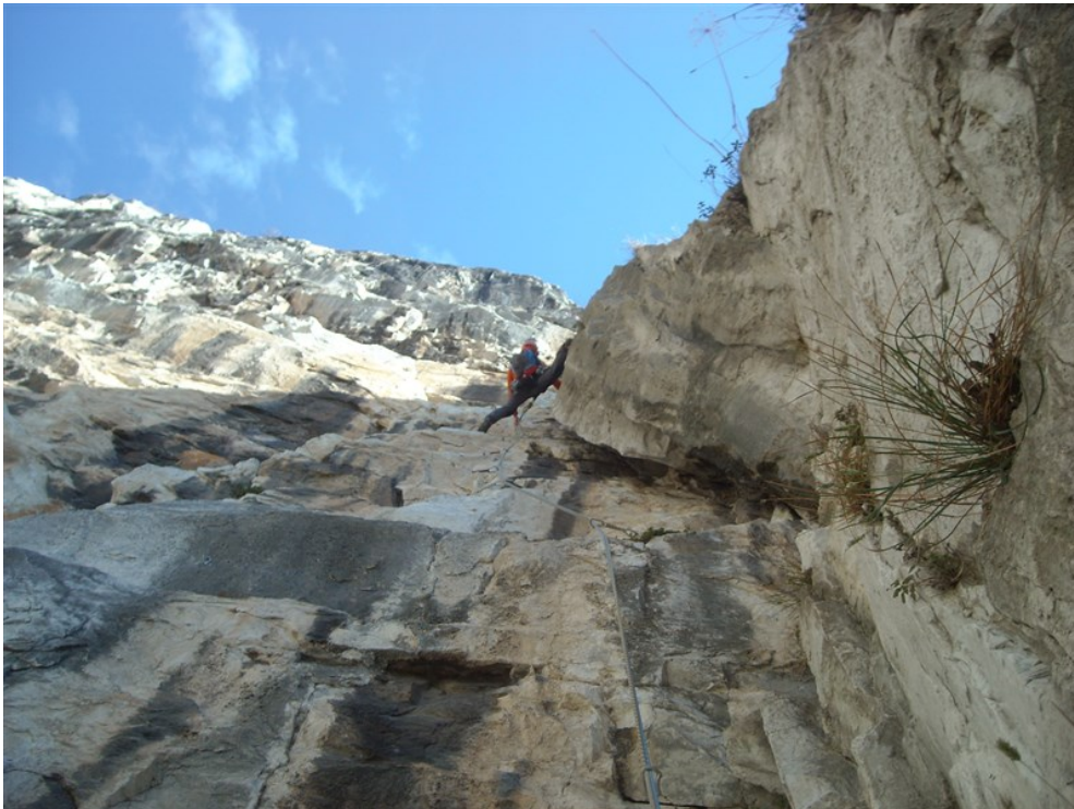
Riccardo sulla fessura camino della seconda lunghezza