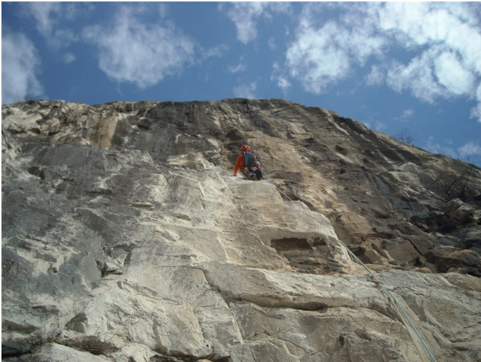
Riccardo oltre il diedro del quarto tiro