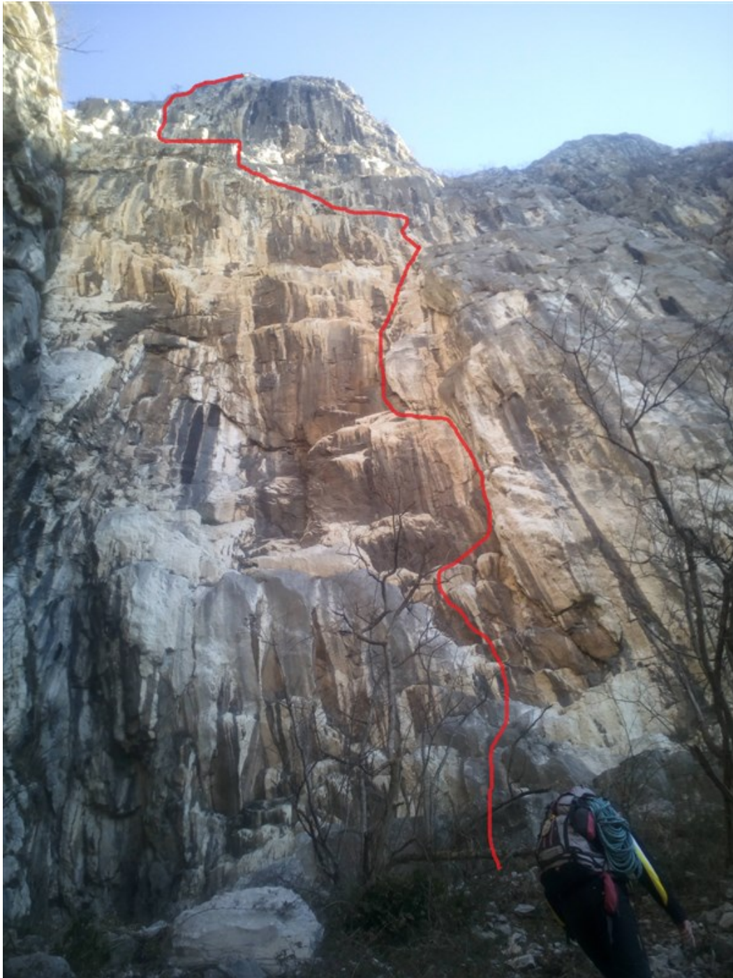
Sviluppo della via Panzeri-Riva al Pilastro Rosso