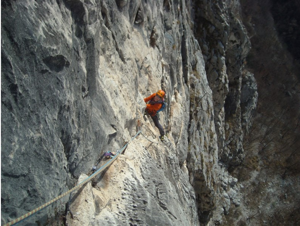
Riccardo in uscita dalla traversata del terzo tiro