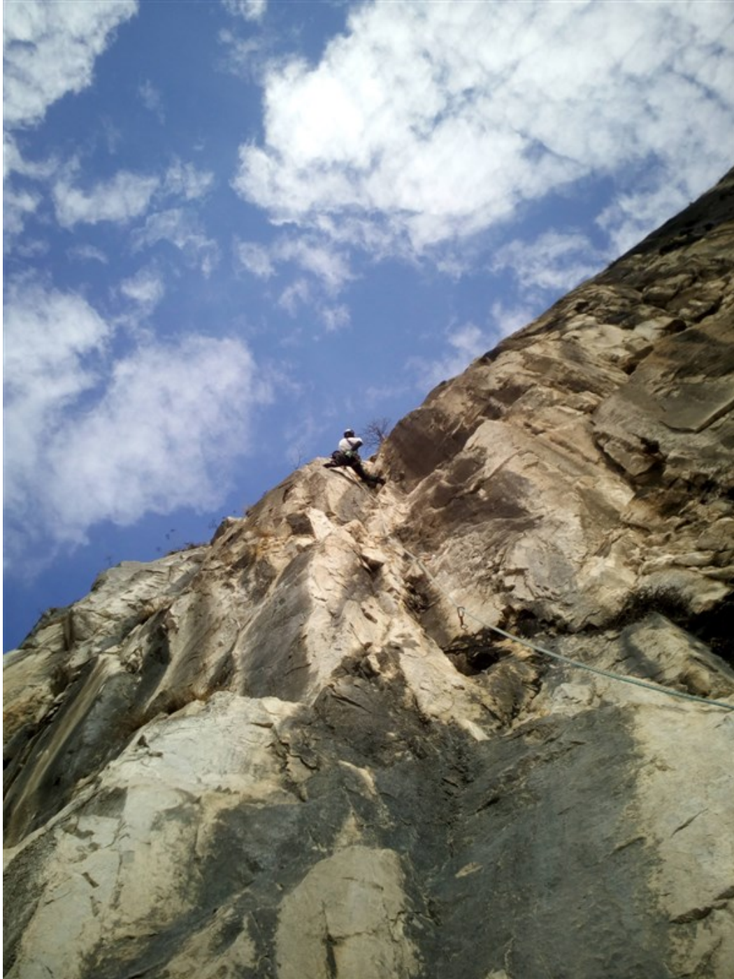
Simone sul diedro della quinta lunghezza