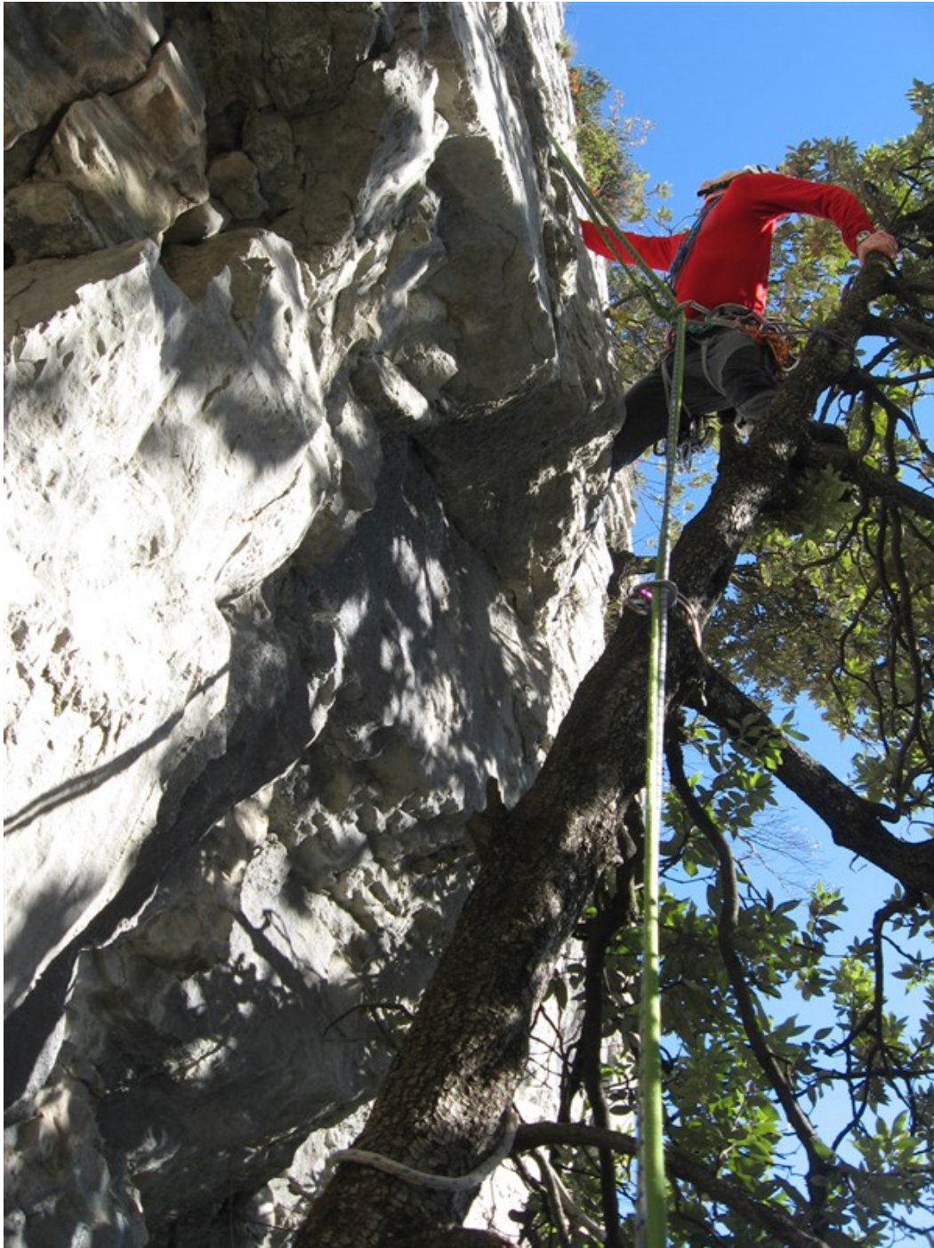
Partenza su albero per la settima lunghezza