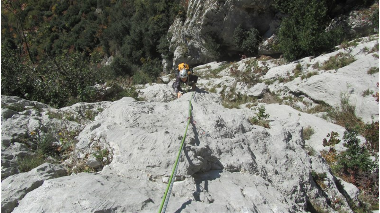
Uscita terza lunghezza