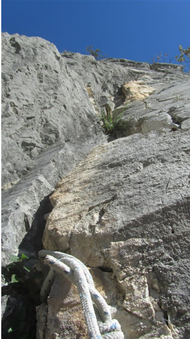
La lama della quarta lunghezza