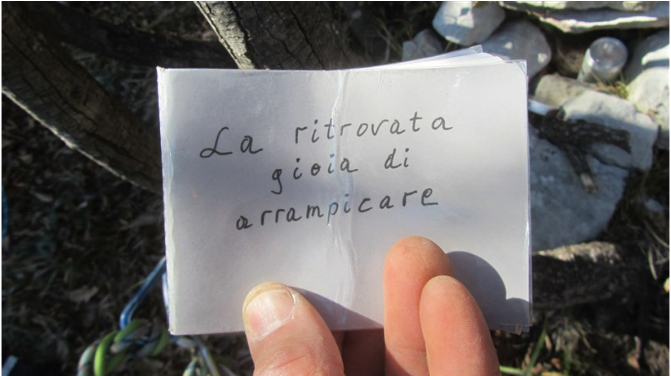
Libro di via