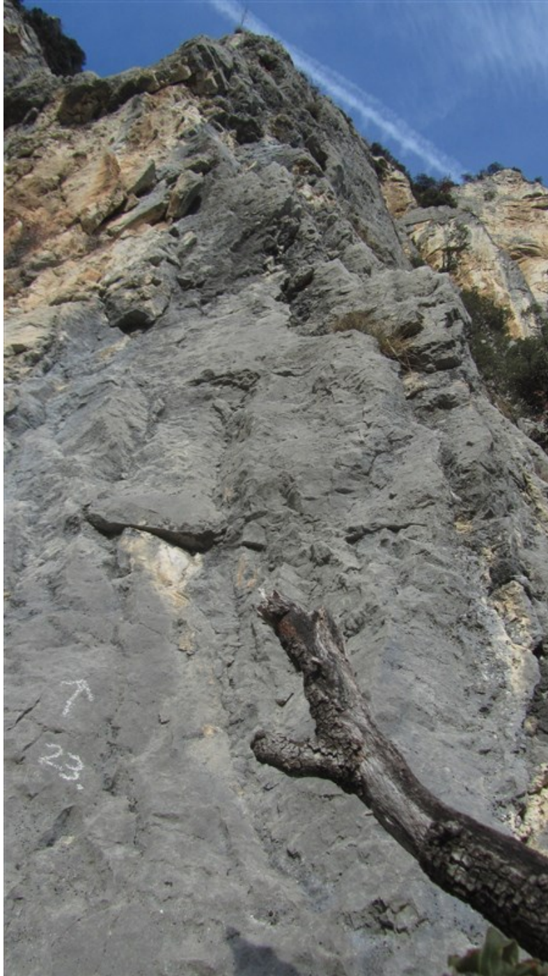
Attacco quarta lunghezza