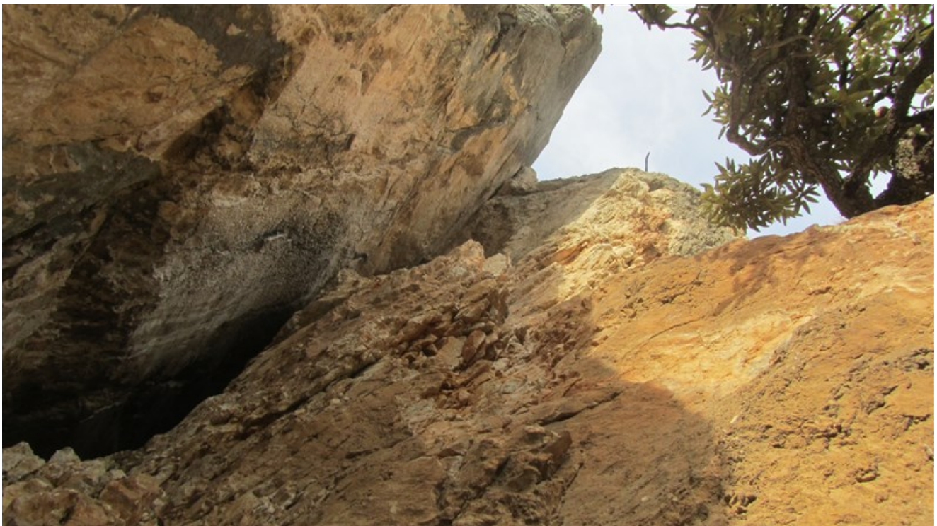
Partenza settima lunghezza