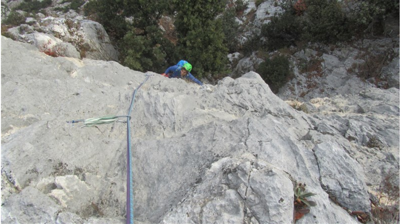
Uscita nona lunghezza