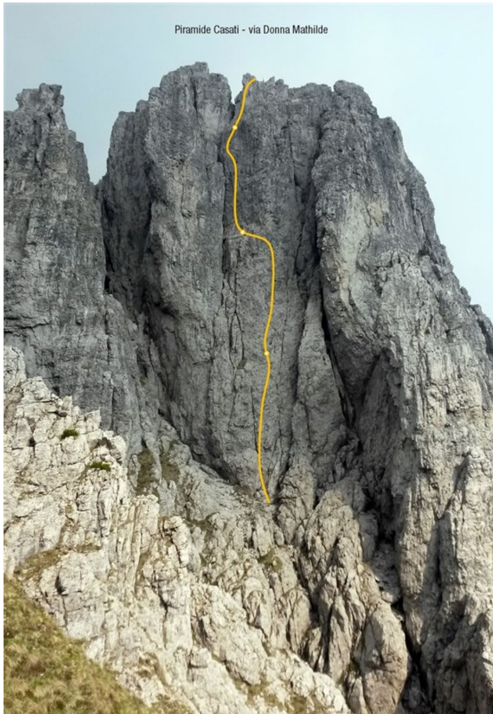
Tracciato della via