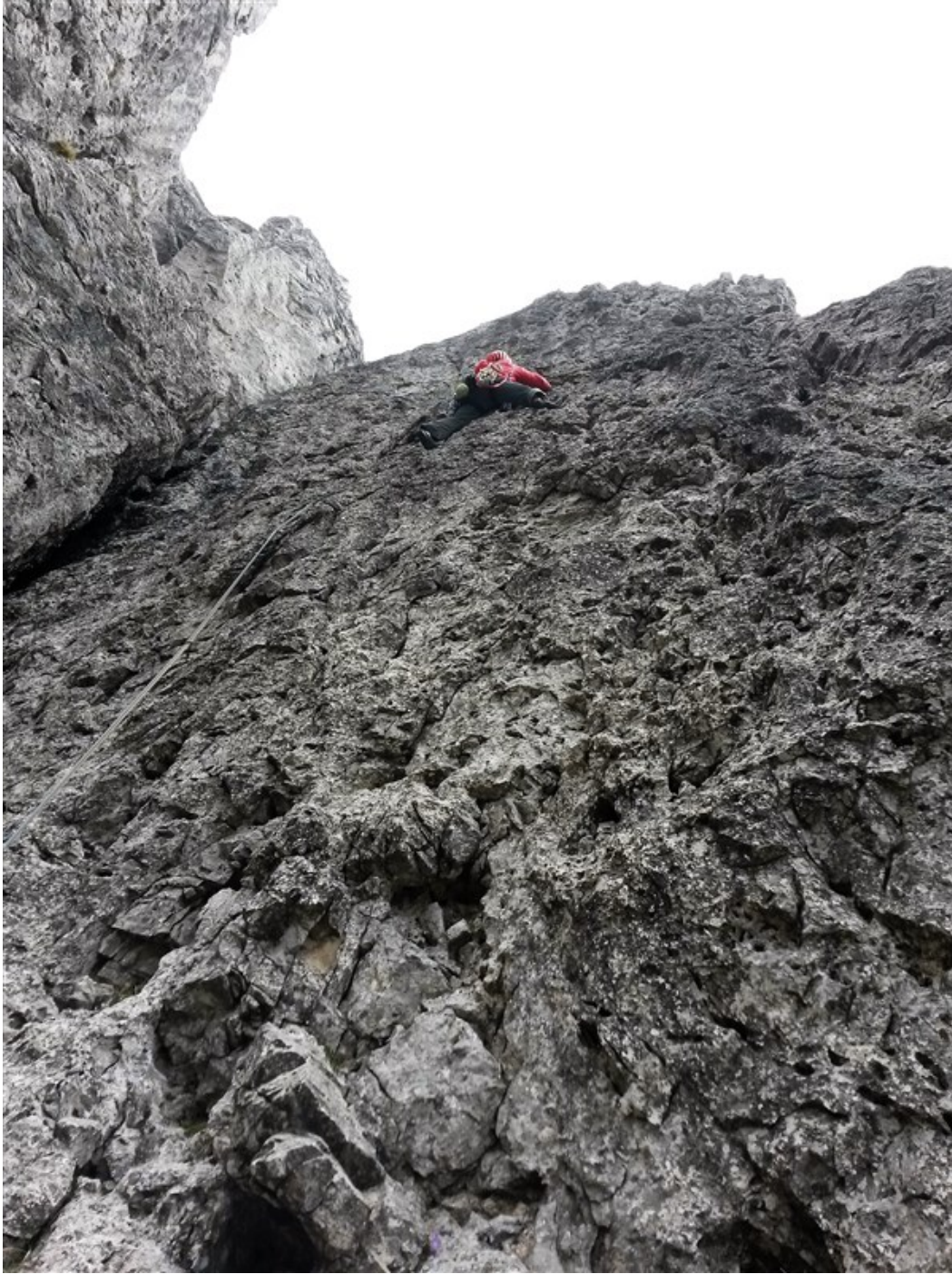
Sulla terza lunghezza