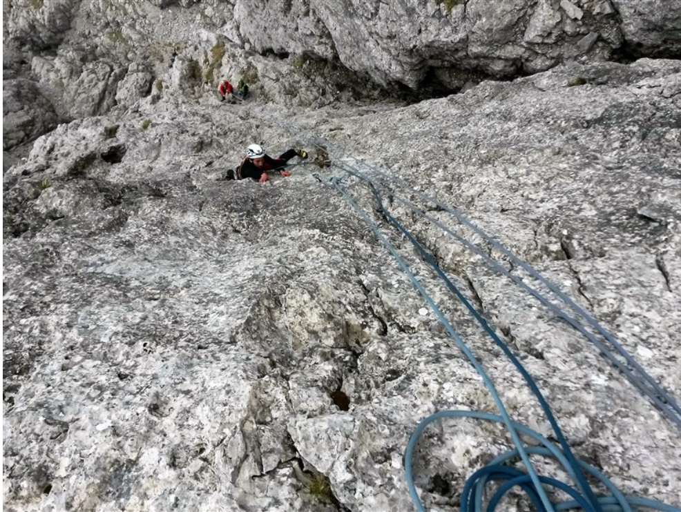
In uscita dalla terza lunghezza