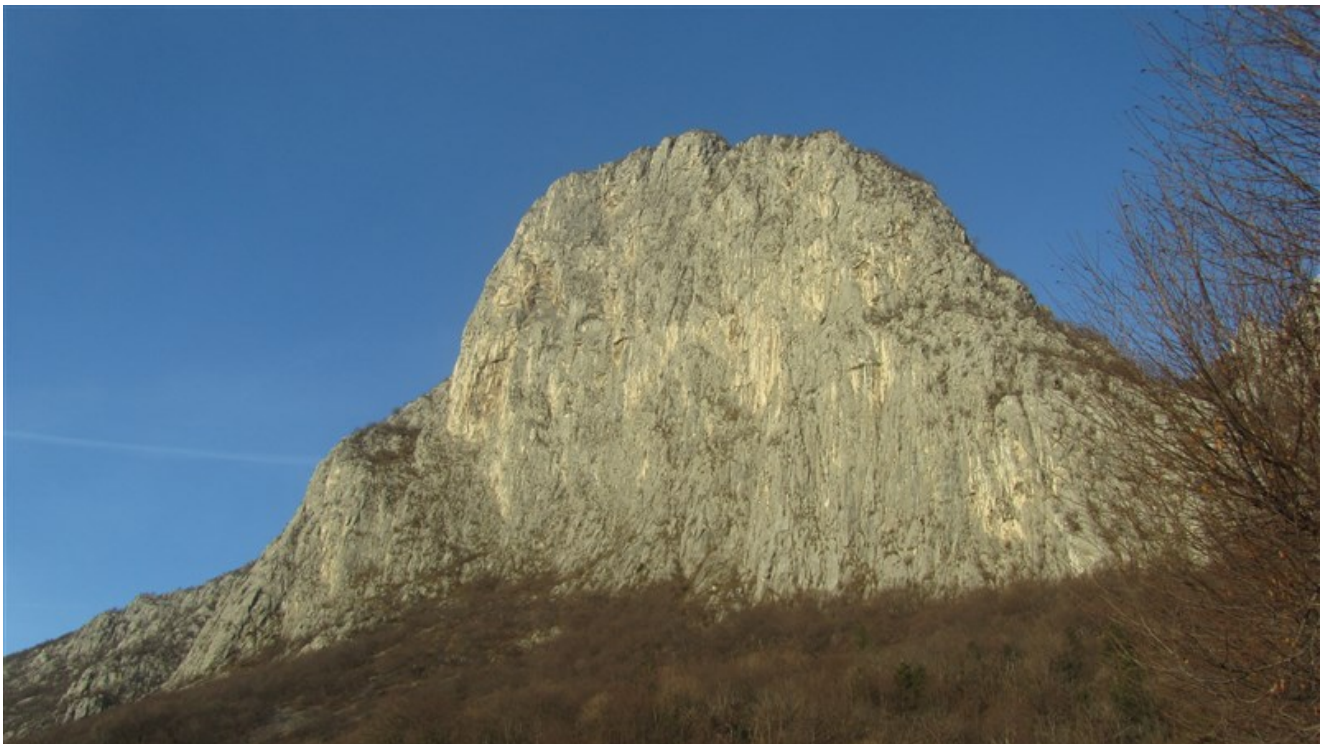
La Corna di Medale e sulla sx il Pilastro Irene