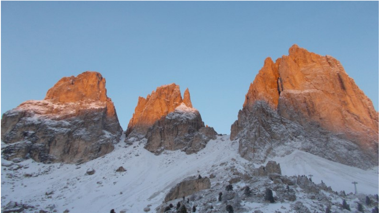
Verso la forcella del Sassolungo