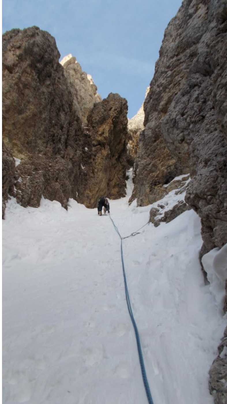
Il canale della terza lunghezza