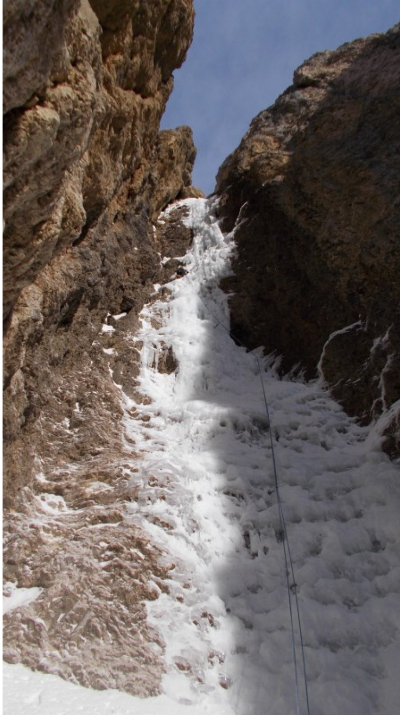
Seconda lunghezza - tiro chiave