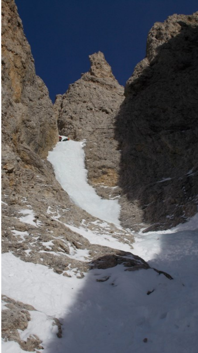
Quinta e sesta lunghezza