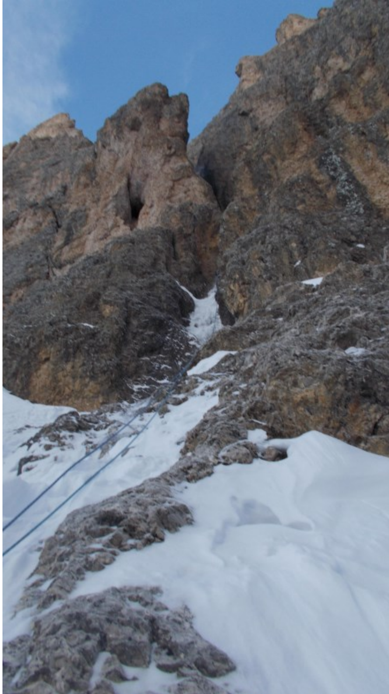
Attacco del couloir