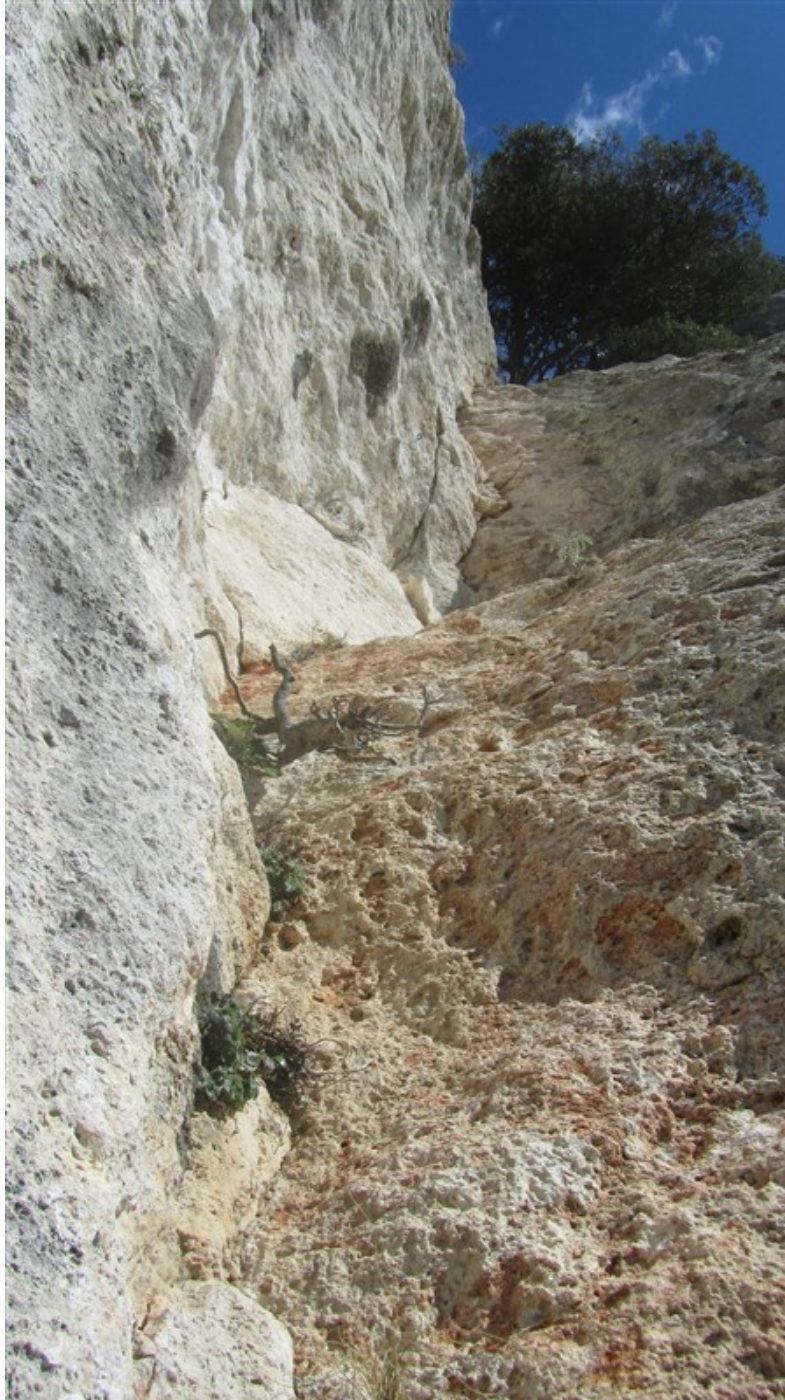
Ultima parte della nona lunghezza