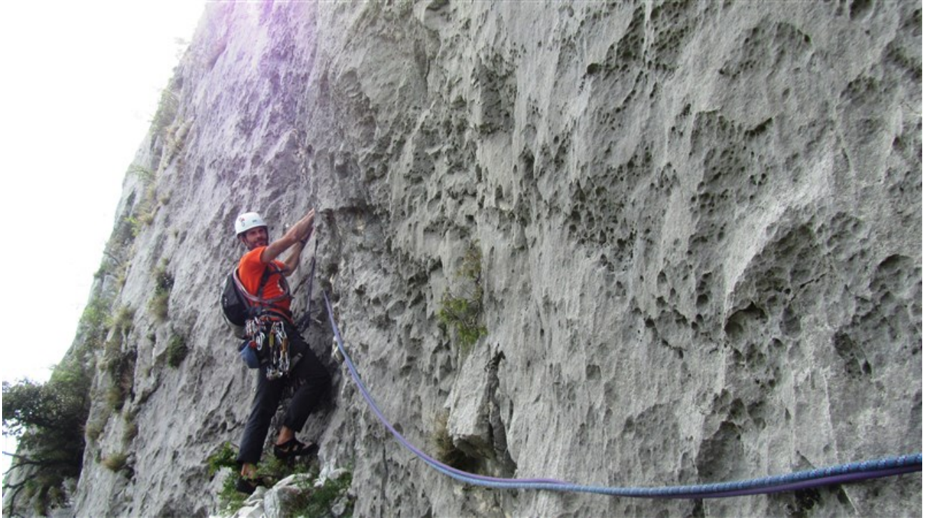
Partenza undicesima lunghezza