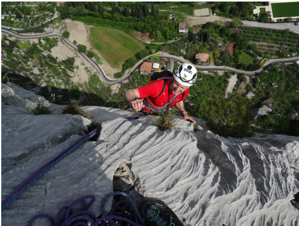
Uscita in vetta