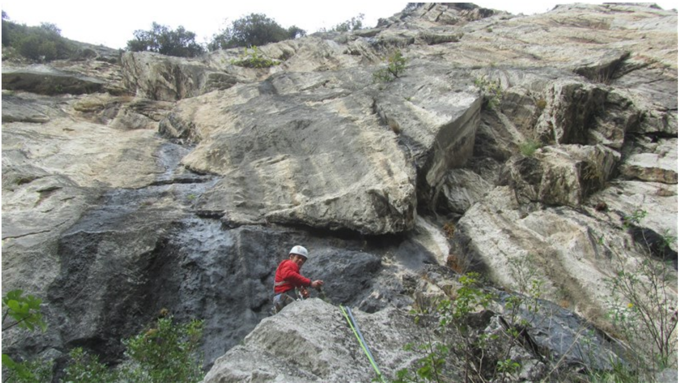
Sosta 2 e terza lunghezza visibile