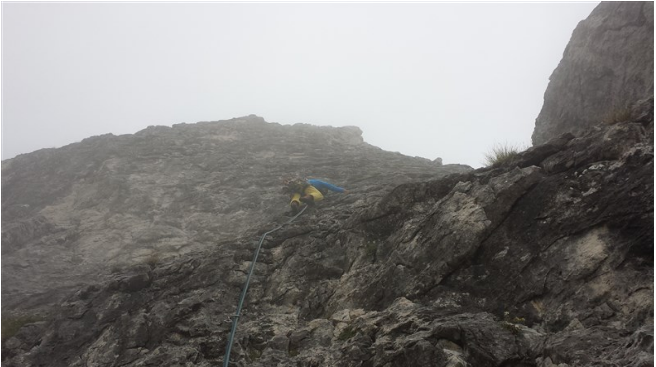
Nicola sulle ripide placche del quinto tiro