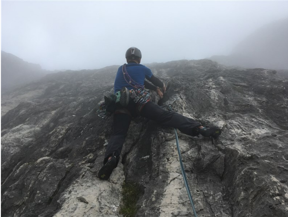
Simone sulla lama del quarto tiro