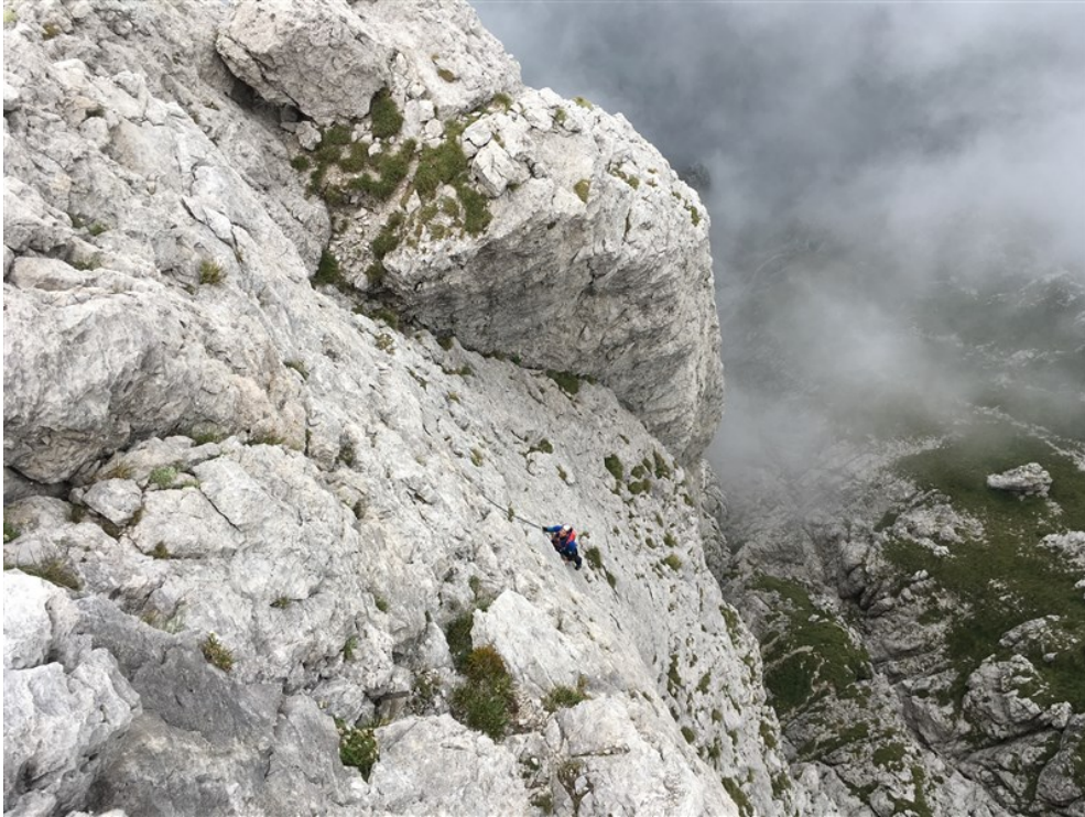
Simone in uscita dal quinto tiro