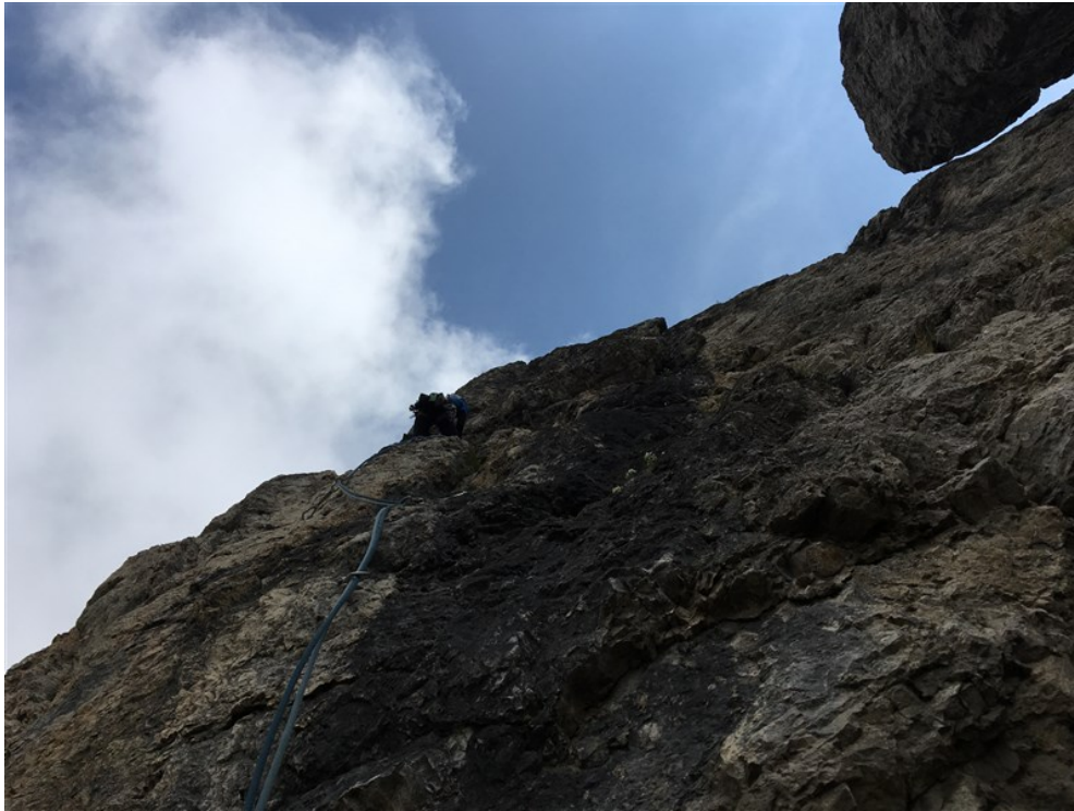
Simone alla S2