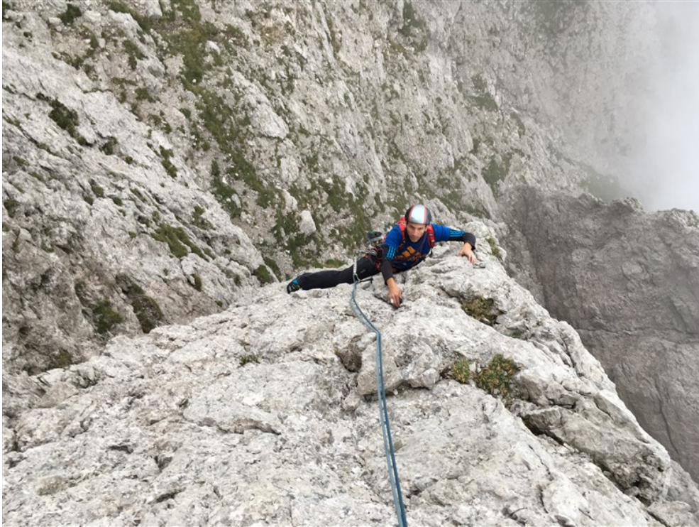
Simone in uscita dalla prima lunghezza