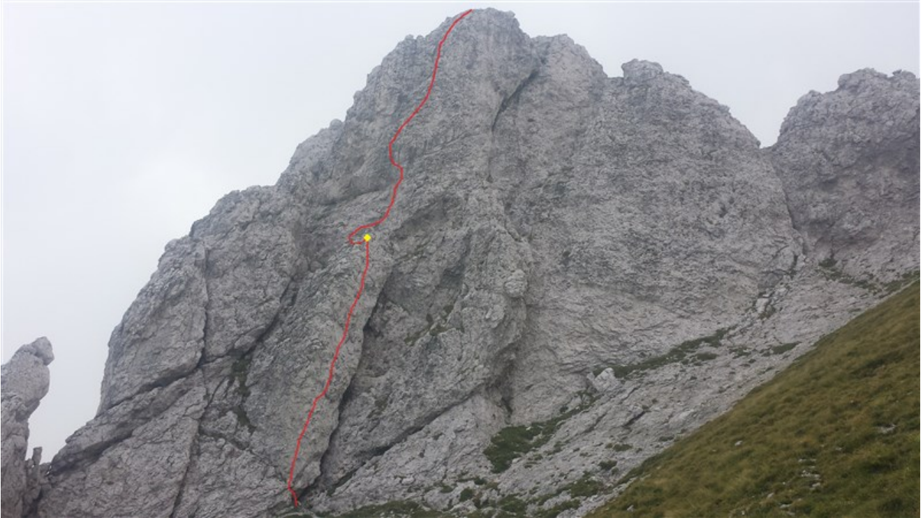
Tracciato della via delle Guide sulla parete Est del Torrione Magnaghi Settentrionale