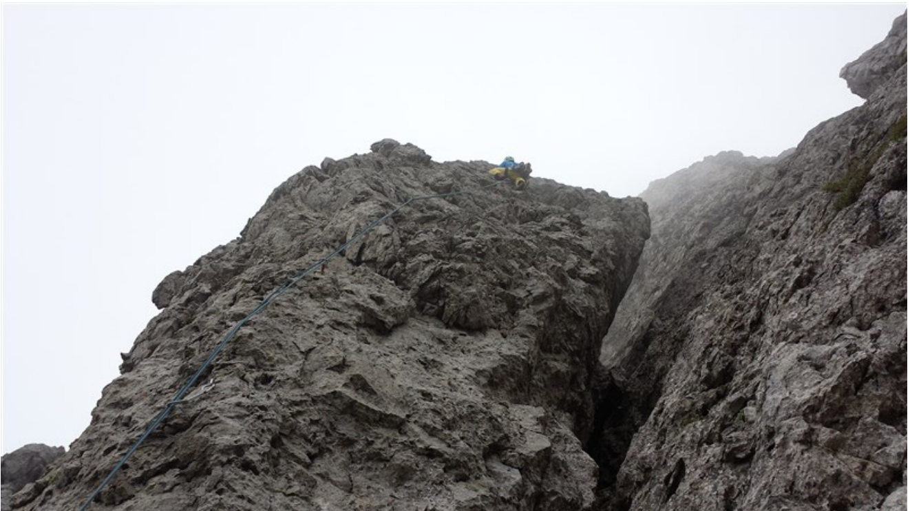
Nicola sulla prima lunghezza