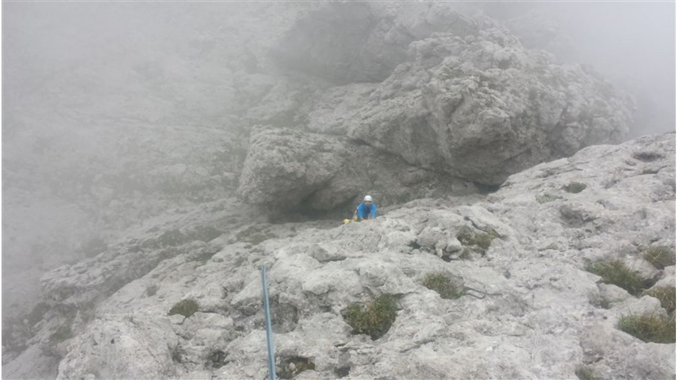
Nicola in uscita dalla seconda lunghezza