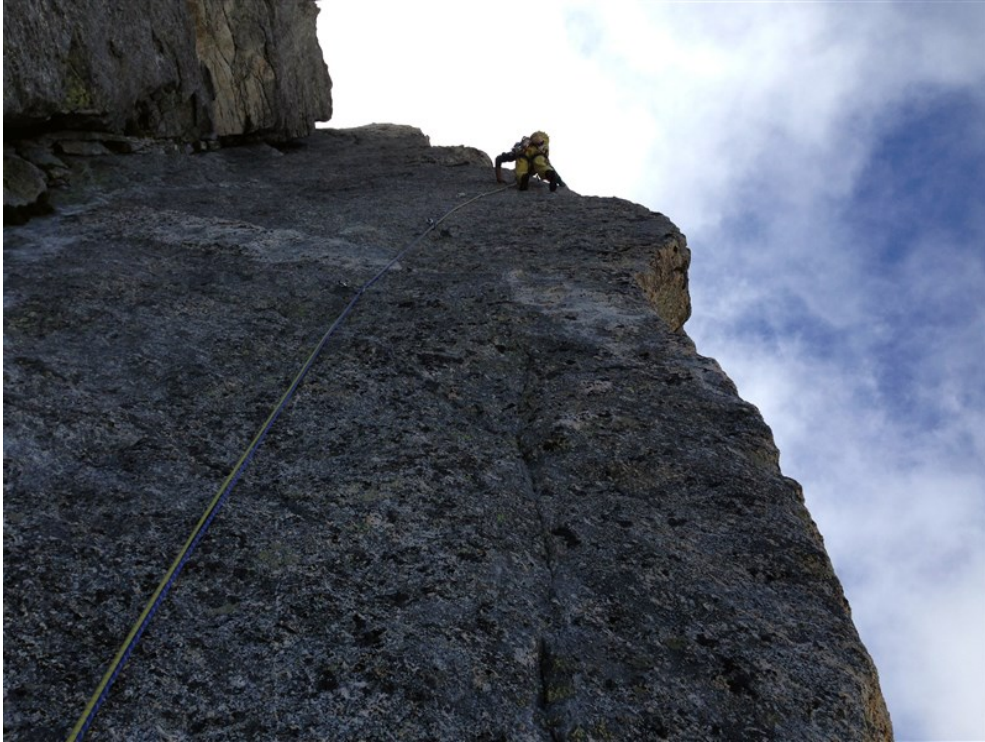
Sulla sesta lunghezza