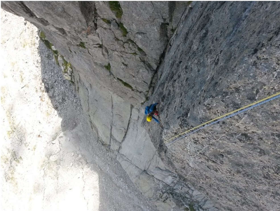
Uscita dalla sesta lunghezza