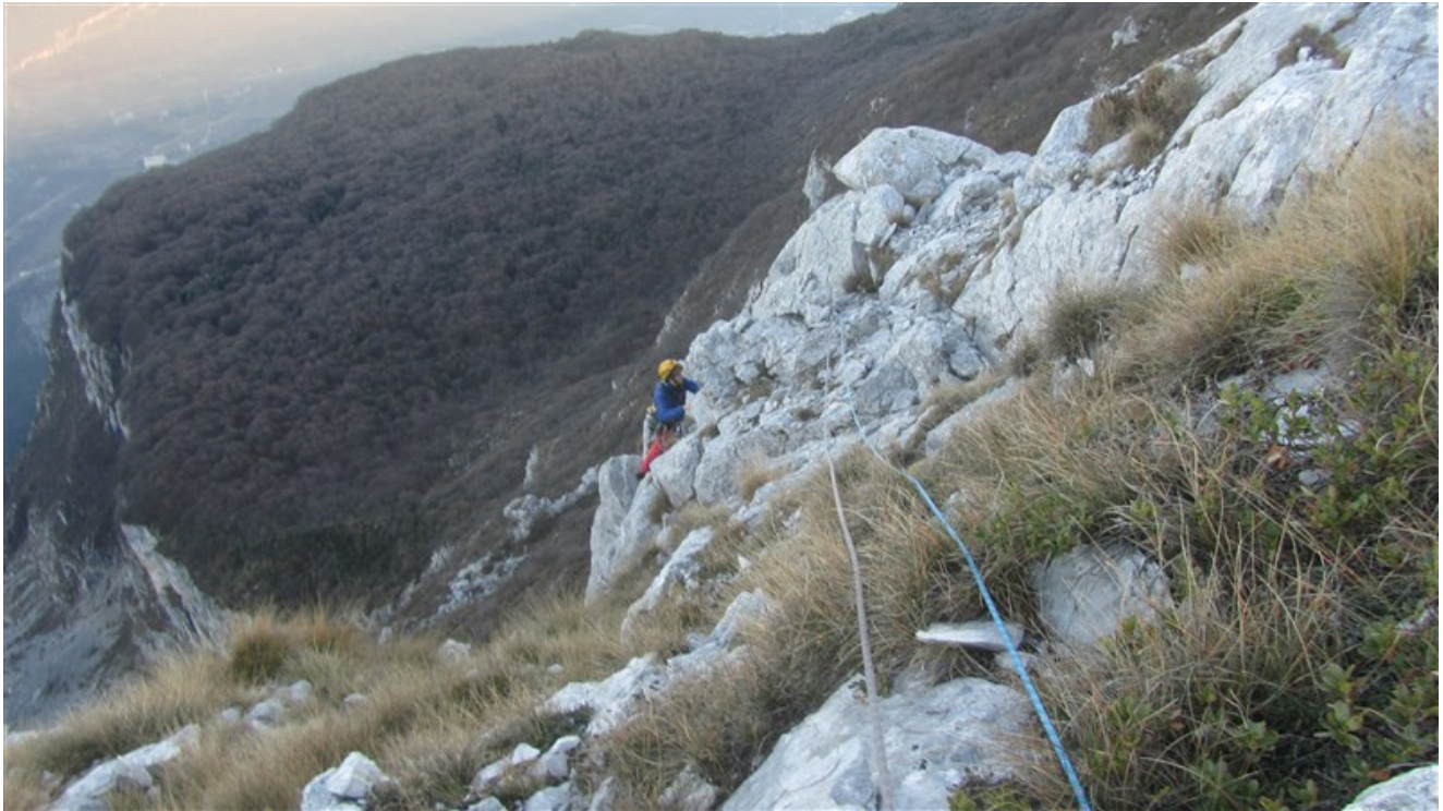
Uscita in vetta