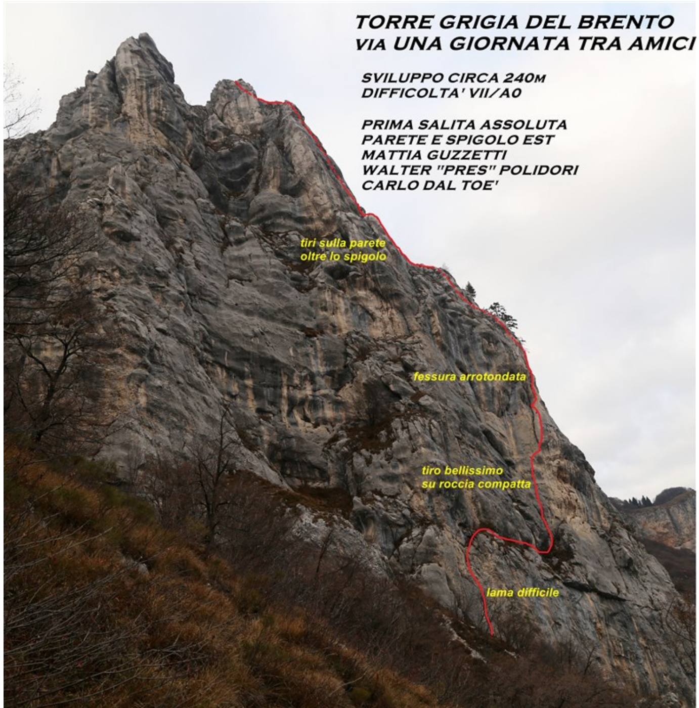
Torre grigia del Brento - Una giornata tra amici