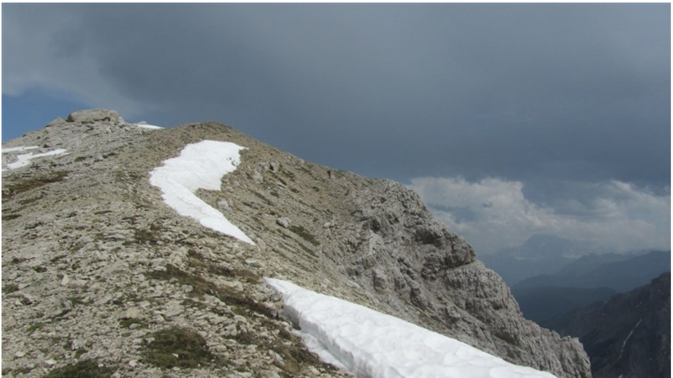
In discesa dalla normale