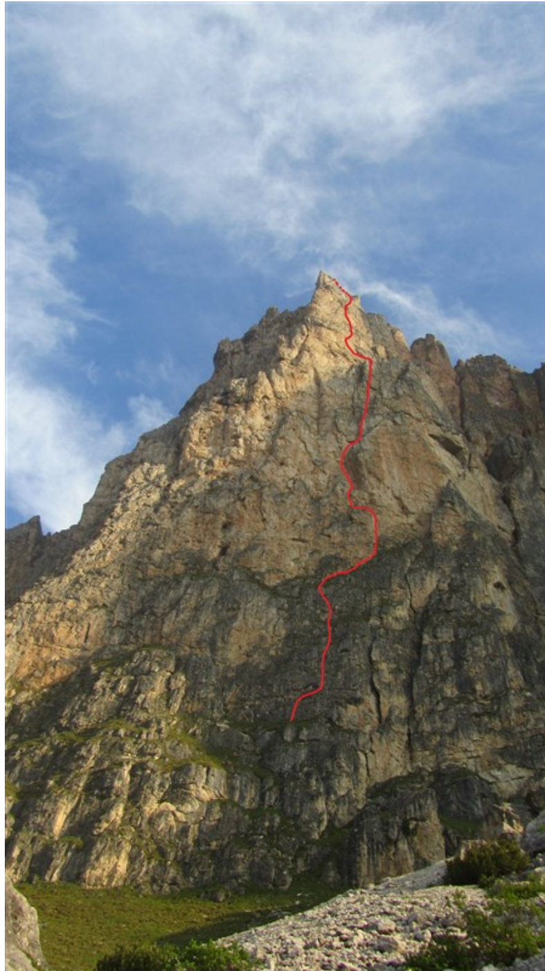
Tracciato indicativo della via Solarium