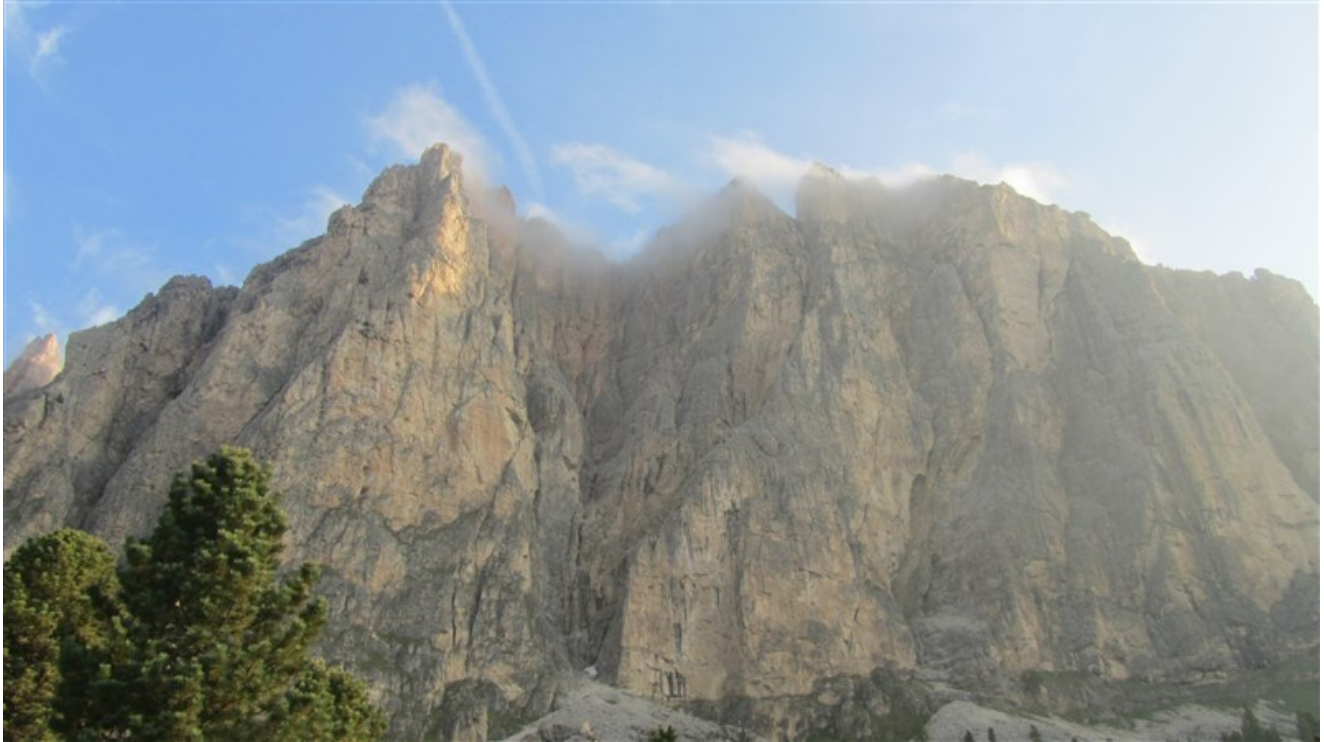
Sass da Ciampac