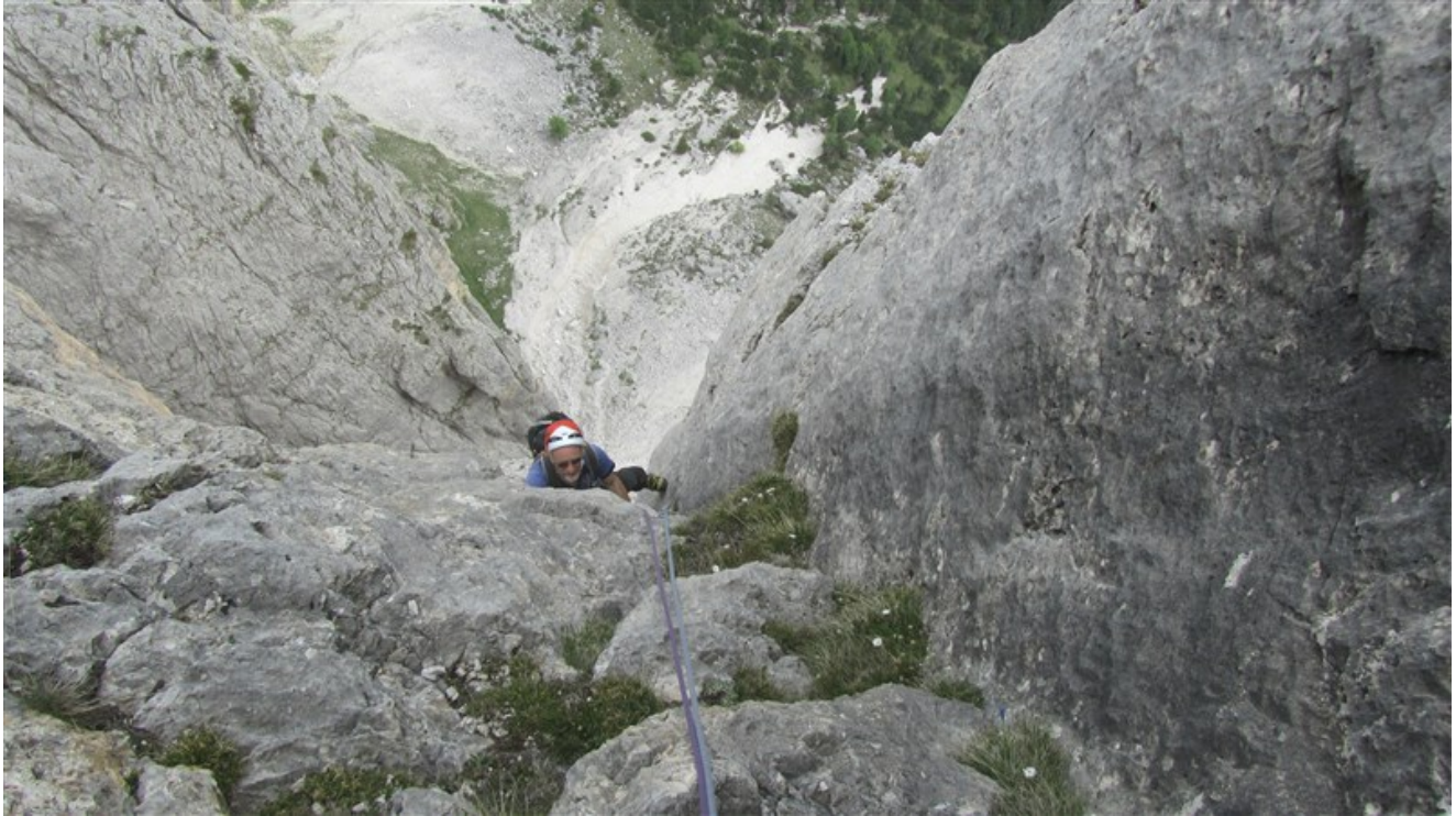
Uscita dalla nona lunghezza