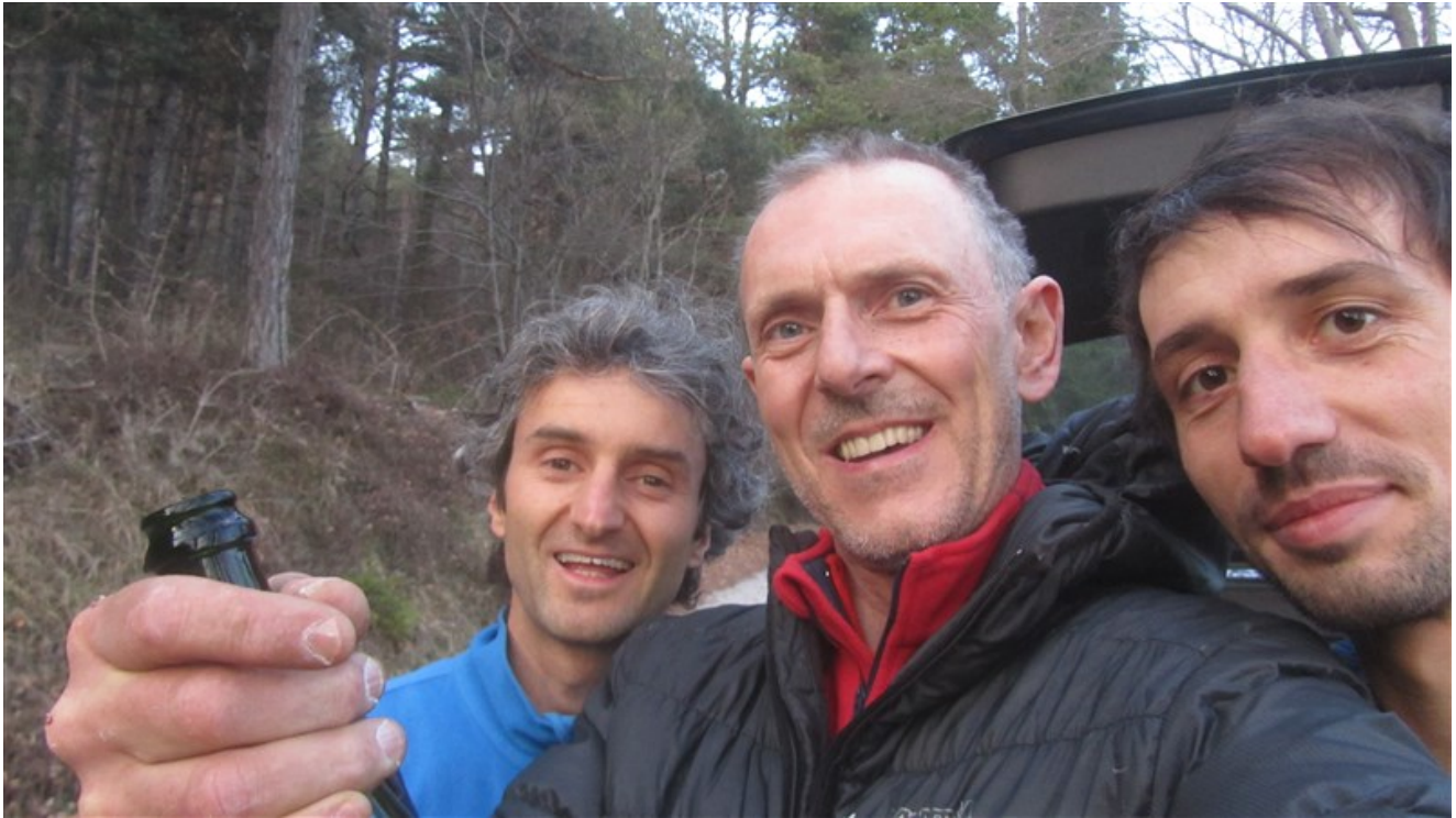
Si festeggia la via