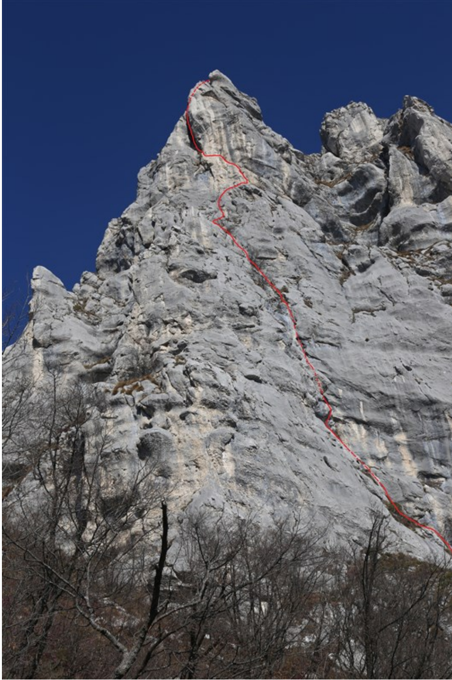
Tracciato indicativo della via Camino del pesce d'aprile