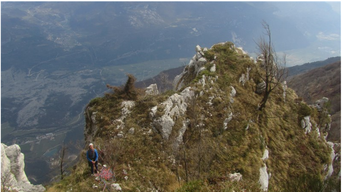
Alessandro Pelo sulla vetta dell'Anticima sud