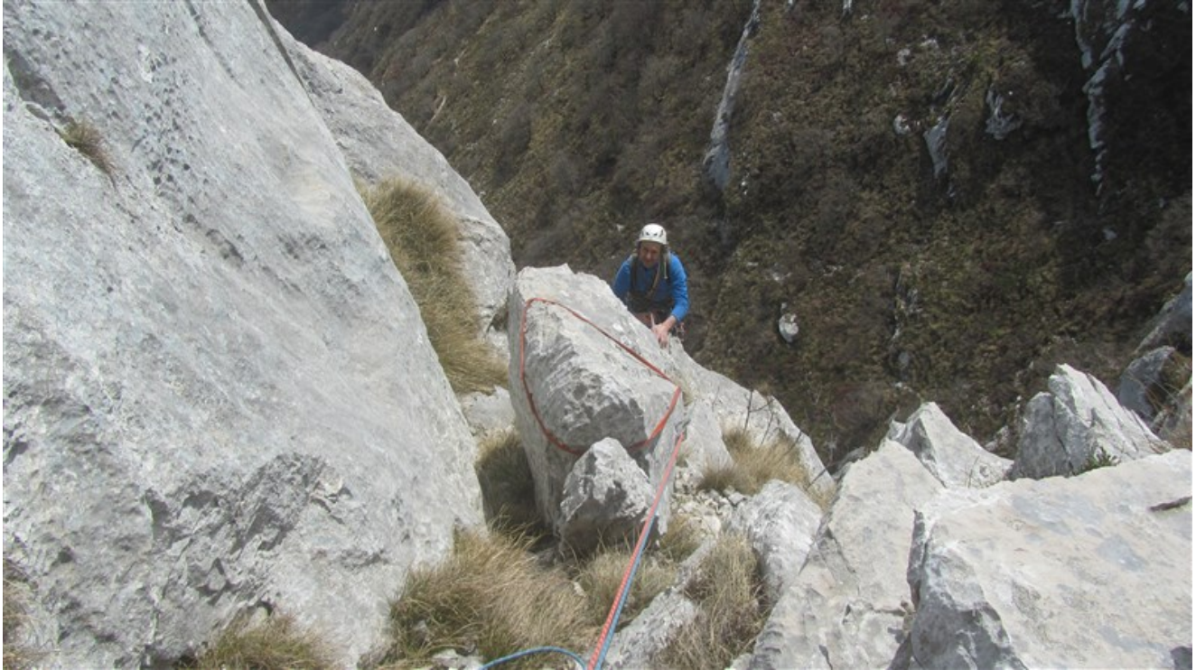
Alessandro pelo in uscita dalla quarta lunghezza