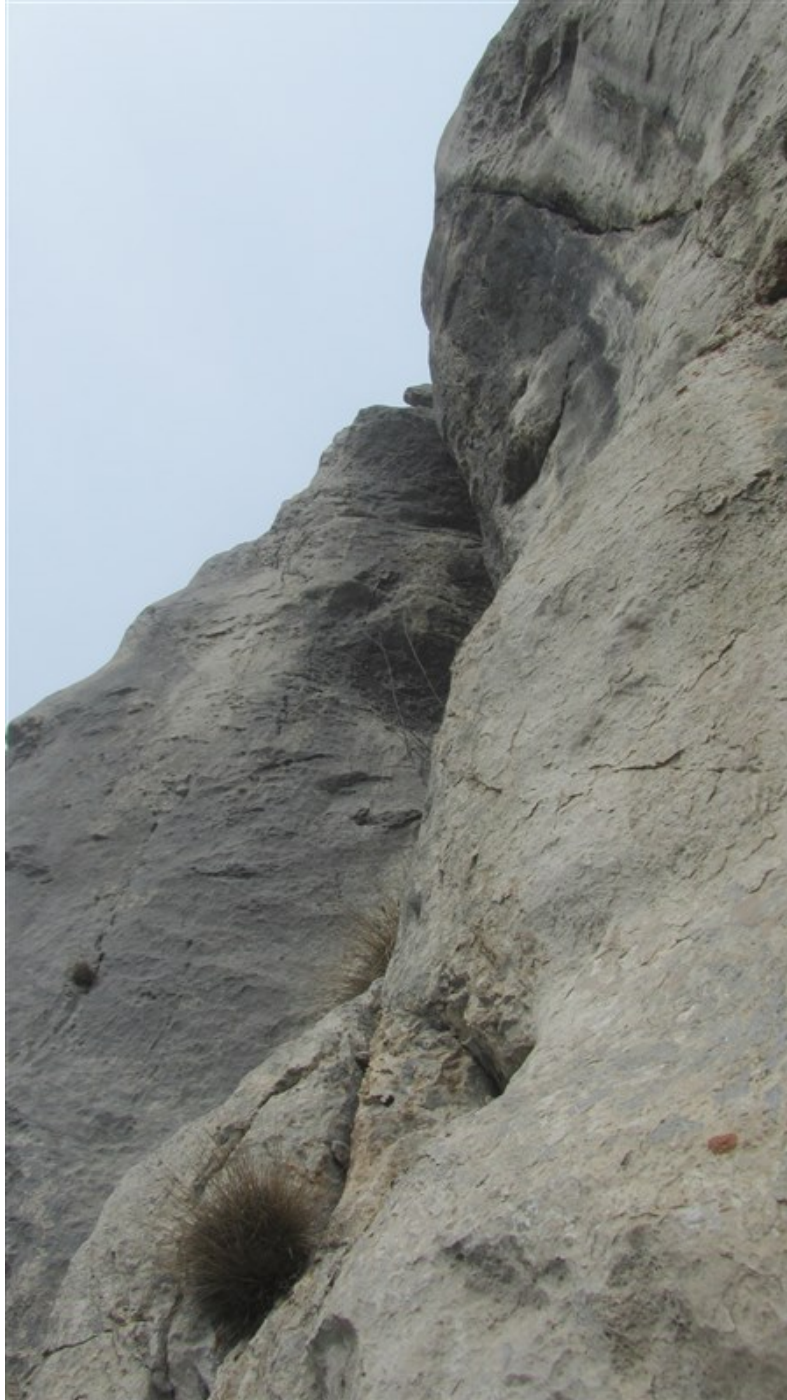
Il camino della quarta lunghezza