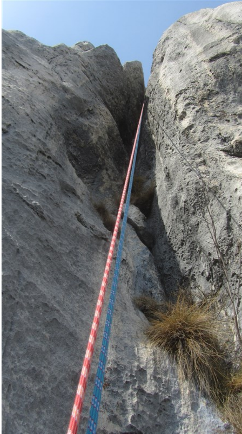
Prima doppia nel camino