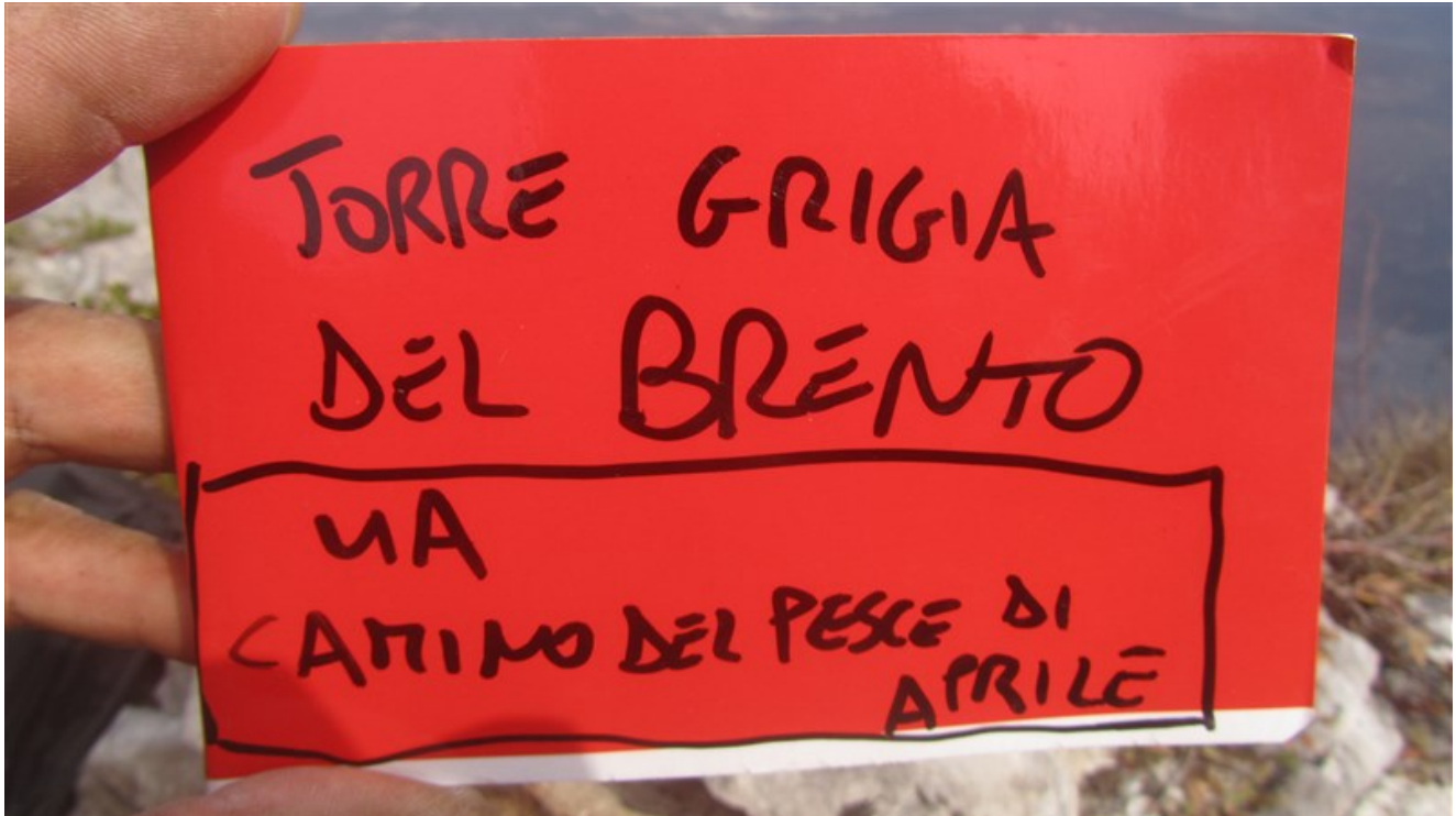
Libro di via