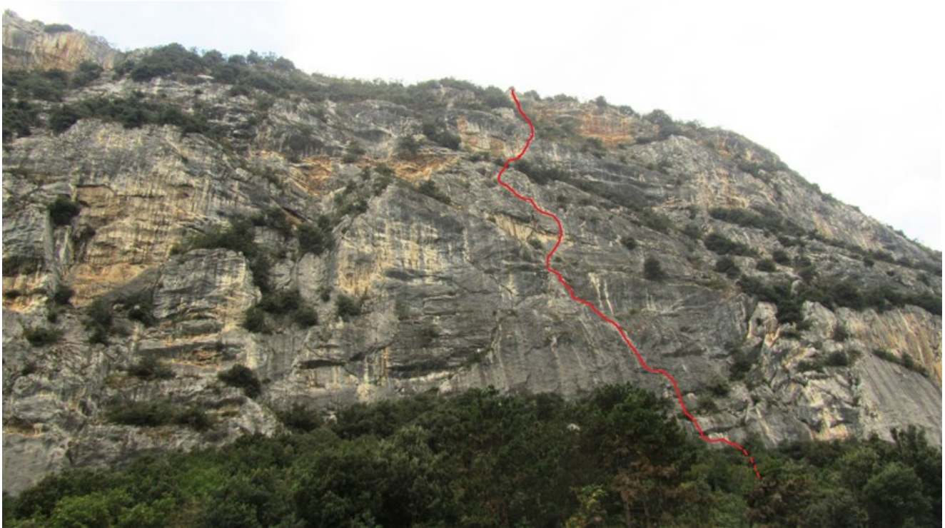
Tracciato via Athene