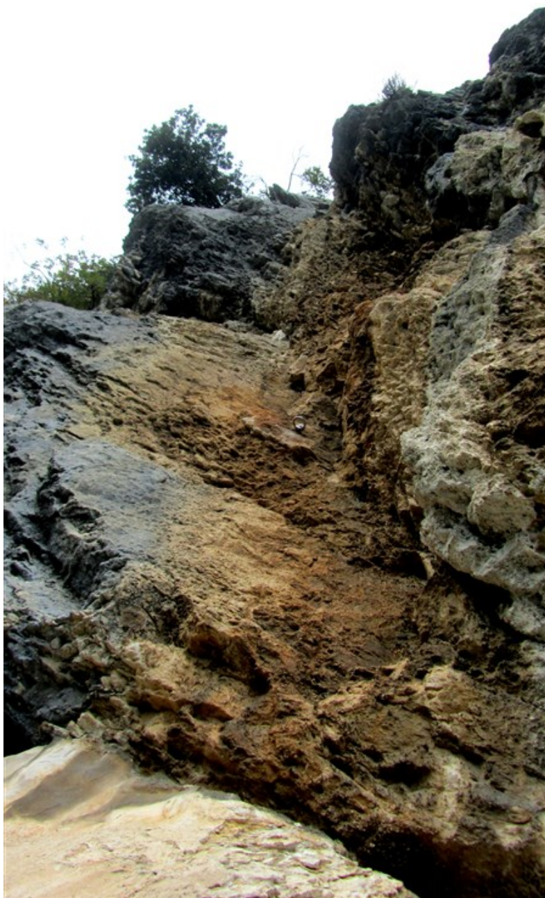
Undicesima lunghezza: il diedro giallo