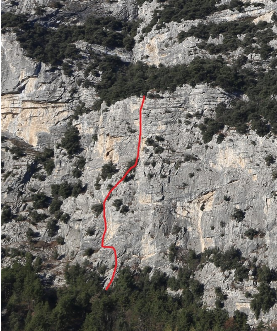
Tracciato indicativo via Diedro Baldessarini