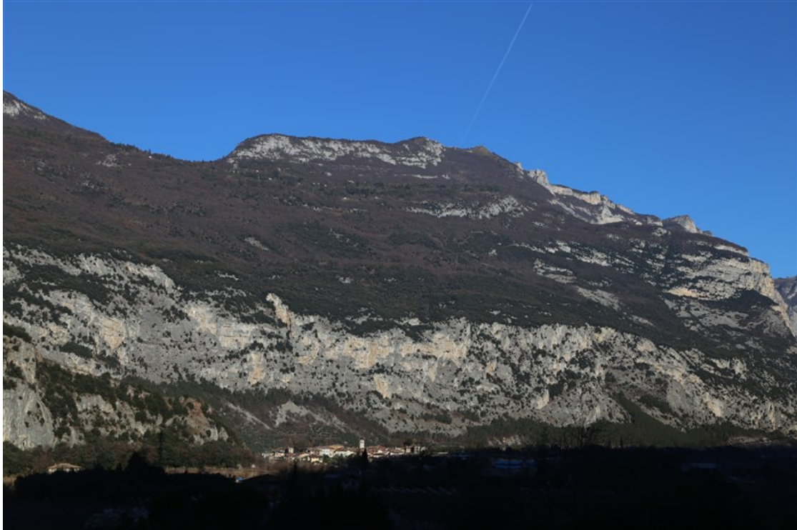
Panoramica Coste dell'Anglone