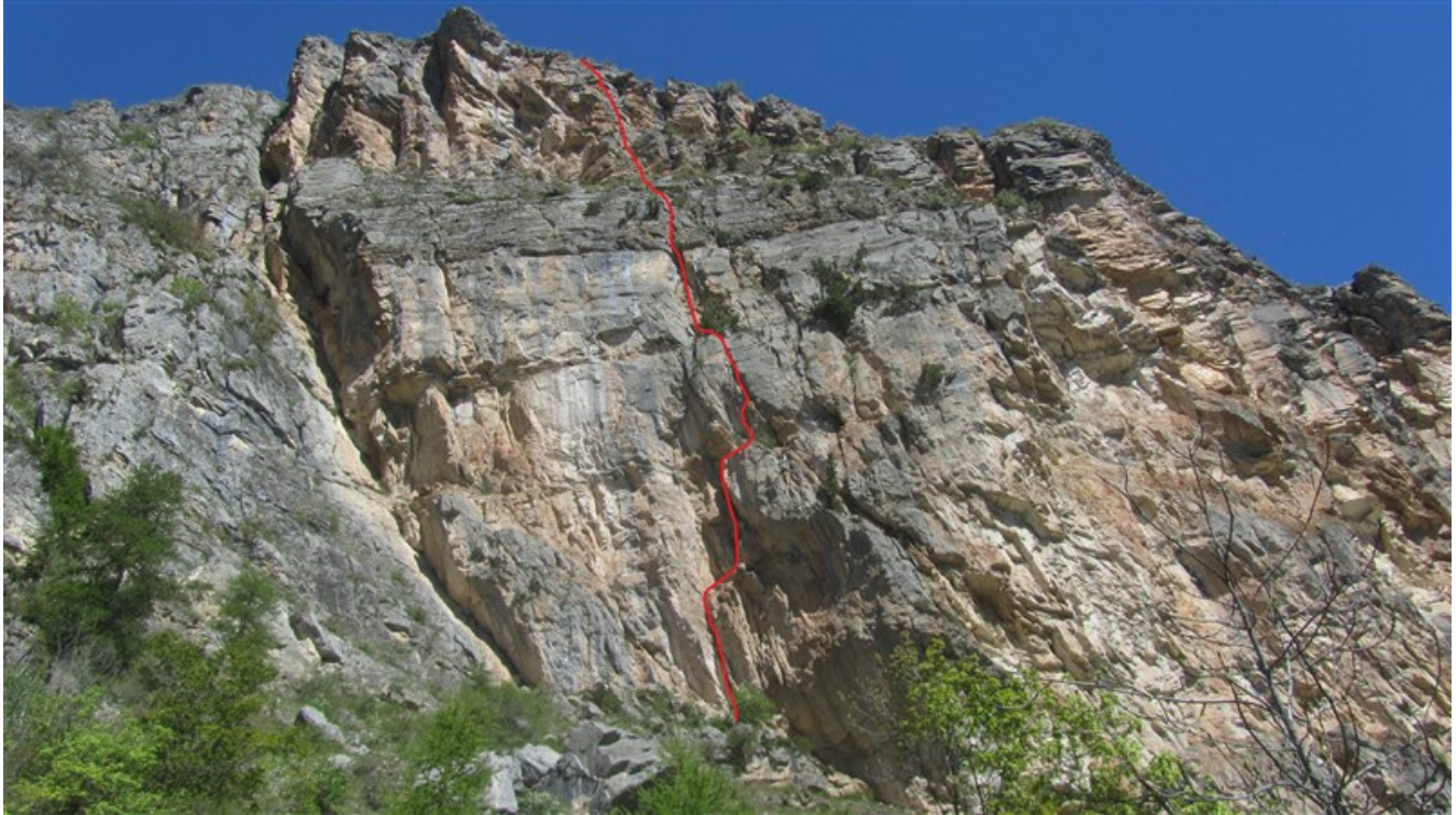
Tracciato indicativo via Les Diables