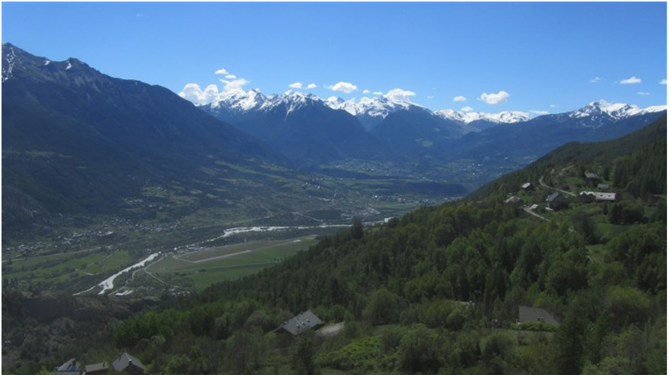
Panorama dalla parete