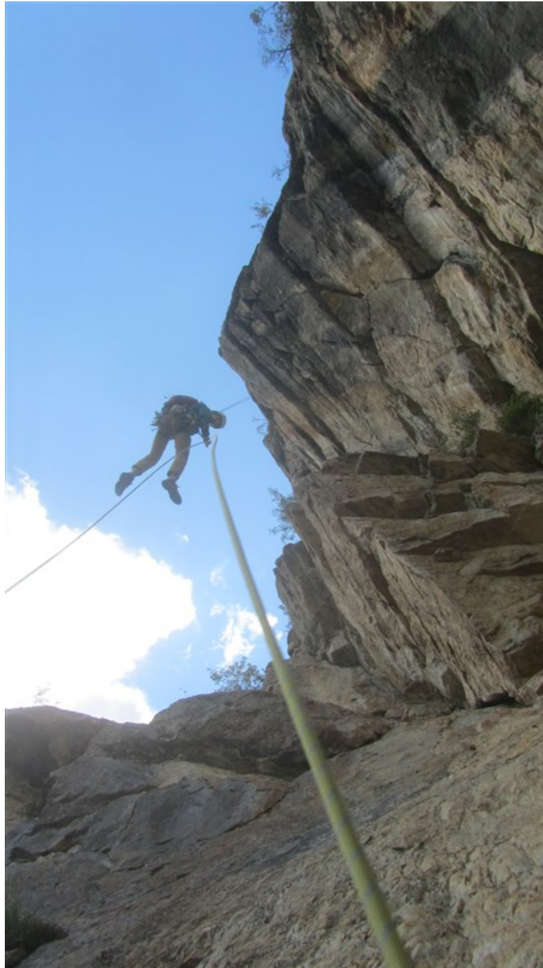
La doppia che porta nel Grande diedro