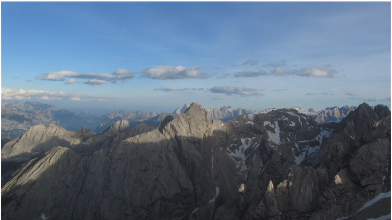
Panorama dalla cengia