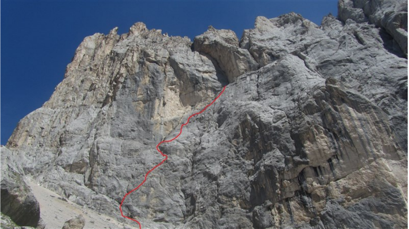
Tracciato indicativo via dei Sudtirolesi parte bassa