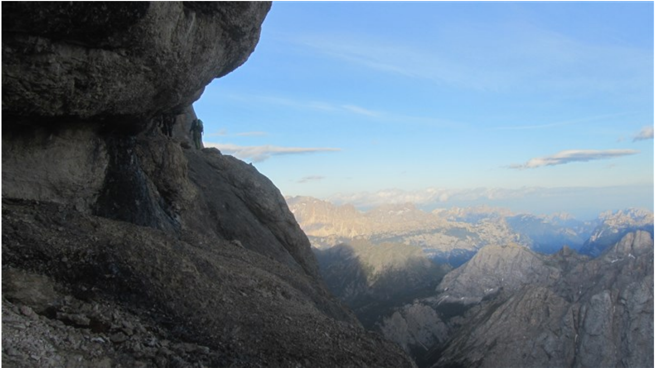
La parte iniziale della cengia