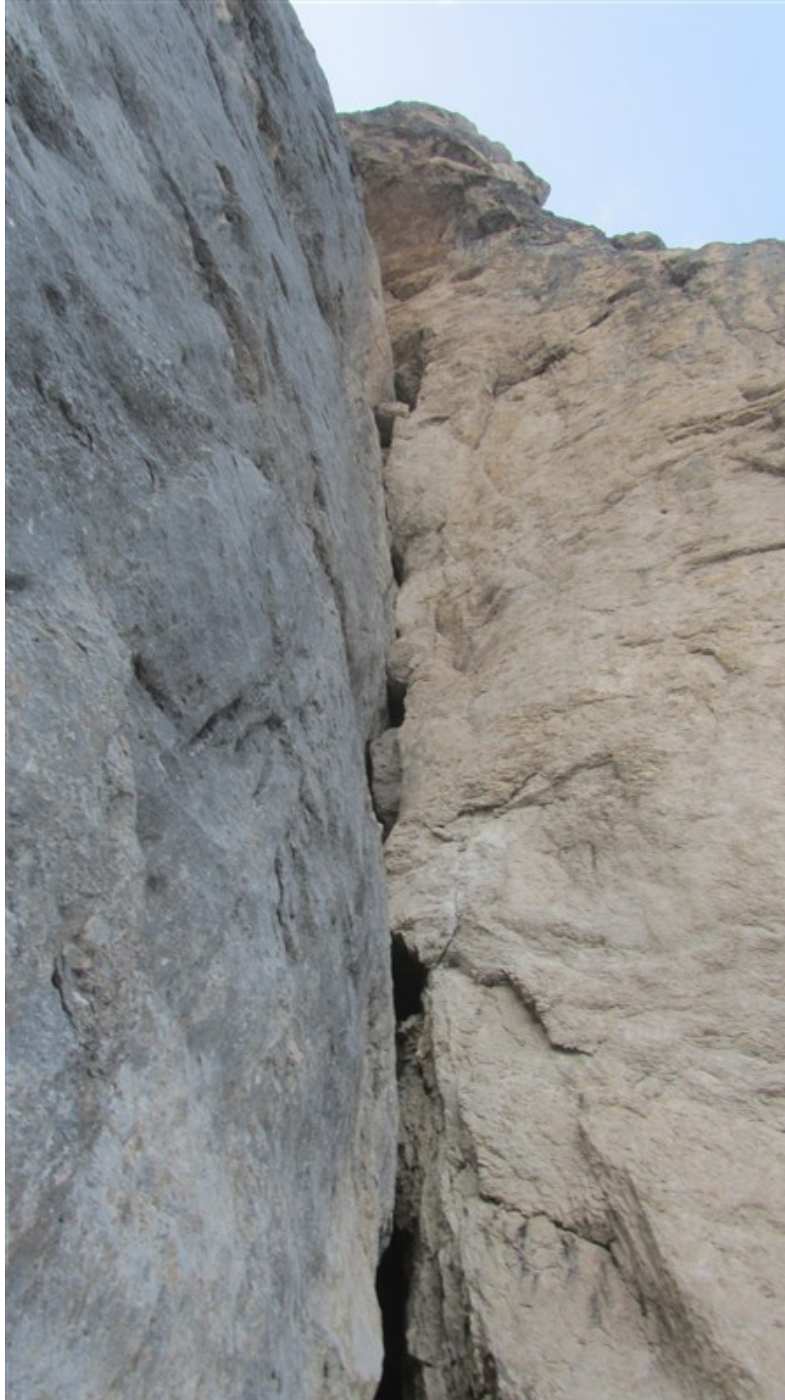
La paurosa parte superiore della via