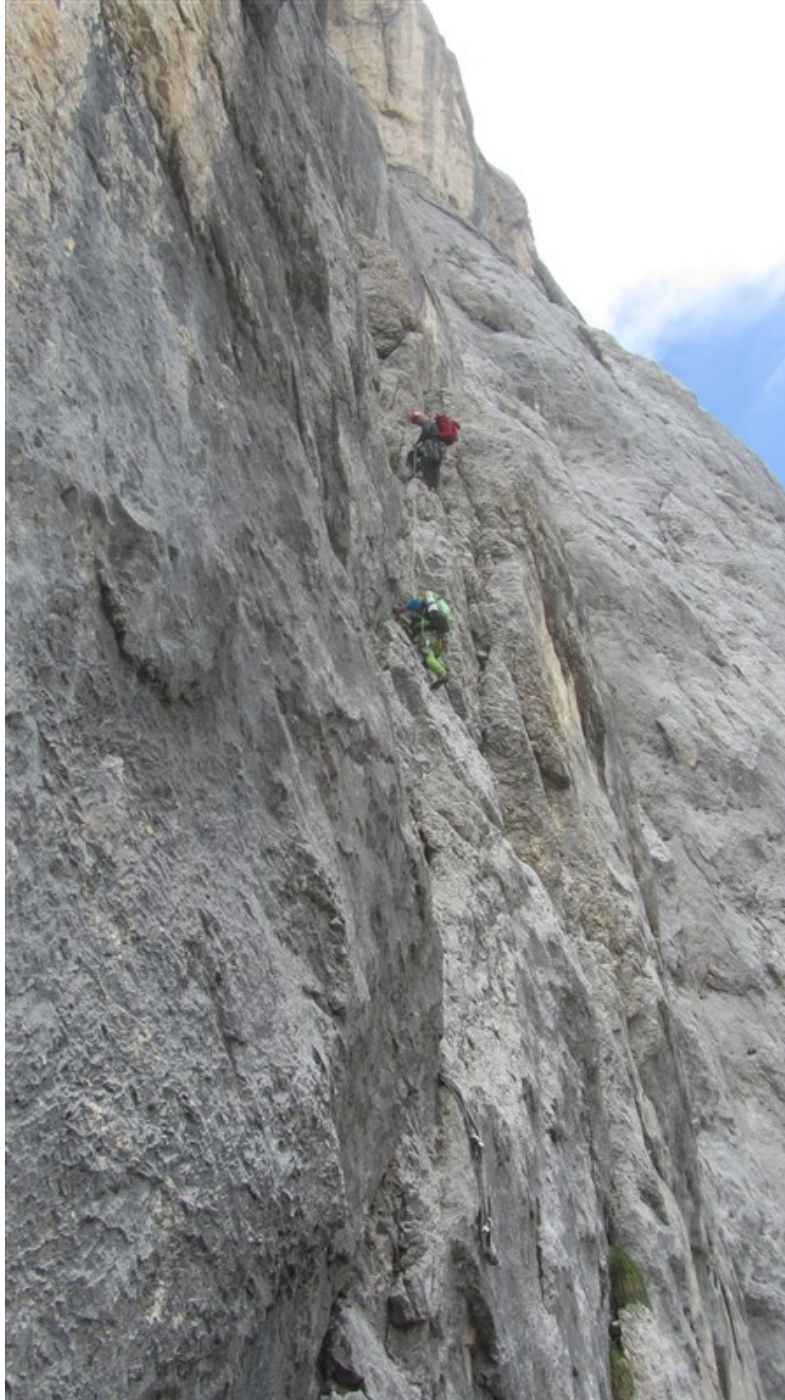
Terza lunghezza dopo il traversino